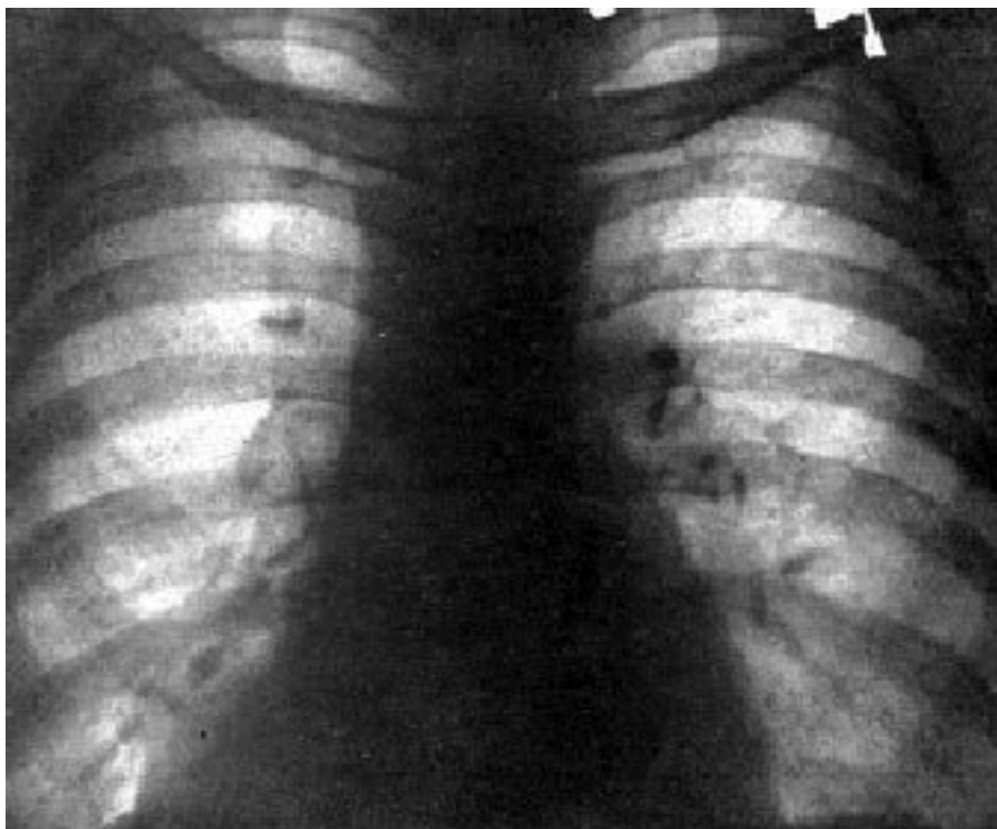
Рис. 1. Рентгенограмма больного Ю. 78 лет

На ЭКГ (рис. 2): перегрузка правых отделов сердца, отклонение ЭОС вправо, синдром S_1Q_3 .