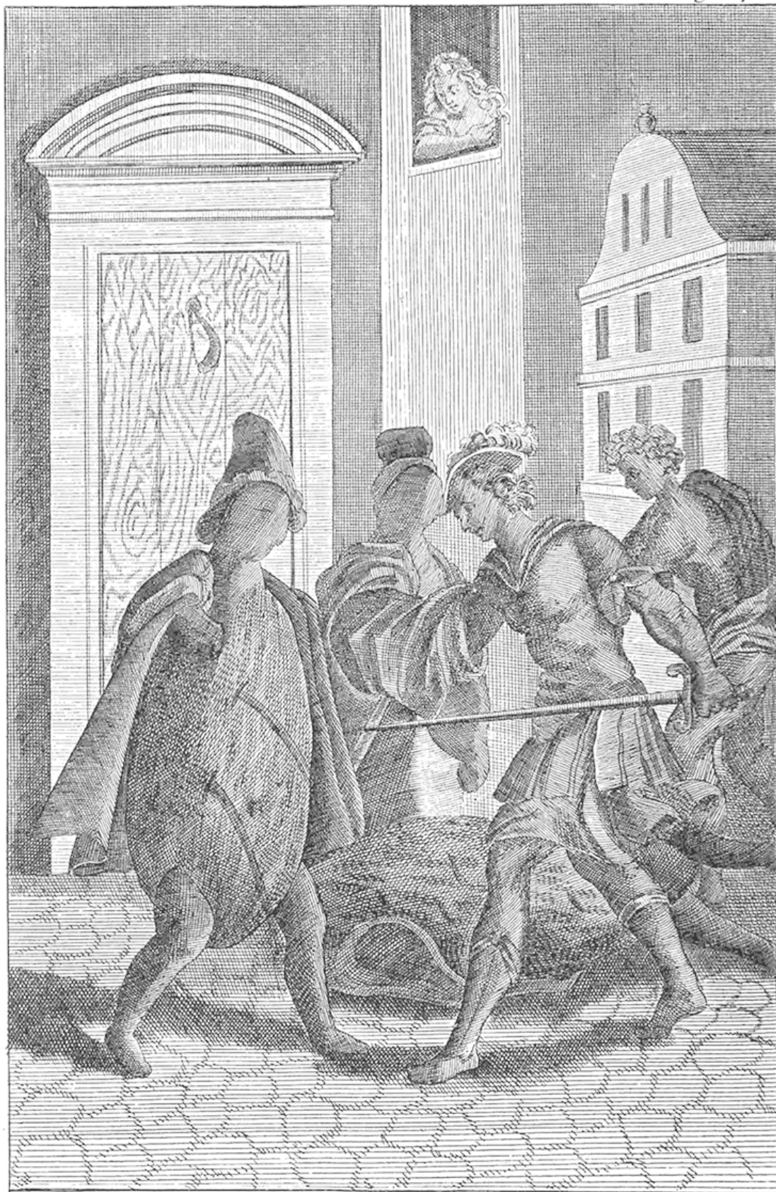
Луций вытаскивает меч и защищается от разбойников