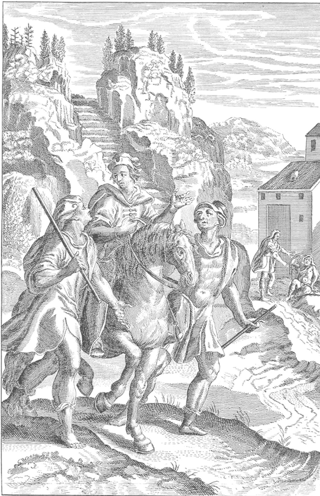
Встреча Аристомена с путниками по дороге в Фессалию