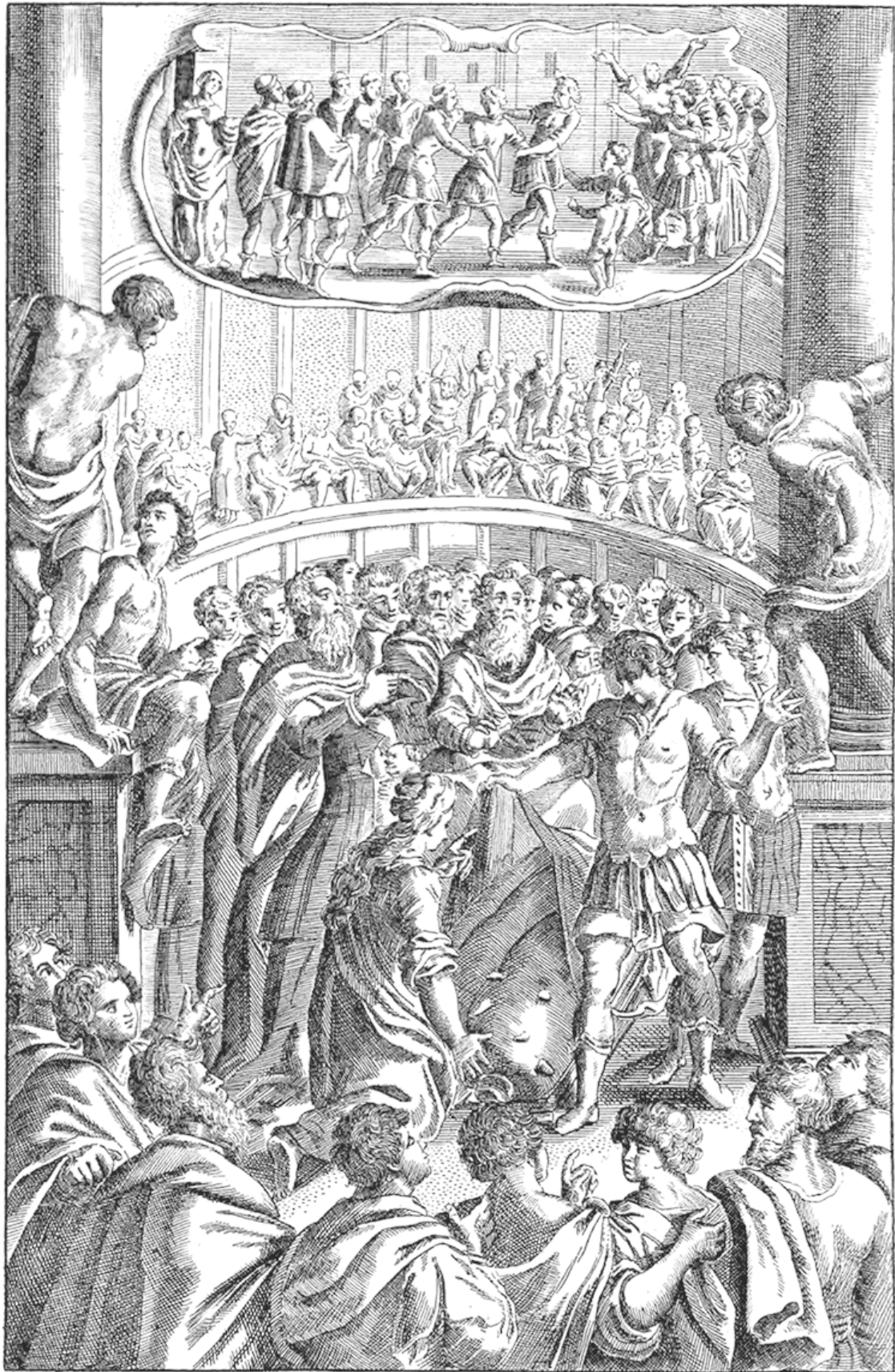
Огромная толпа собирается смотреть на суд Луция