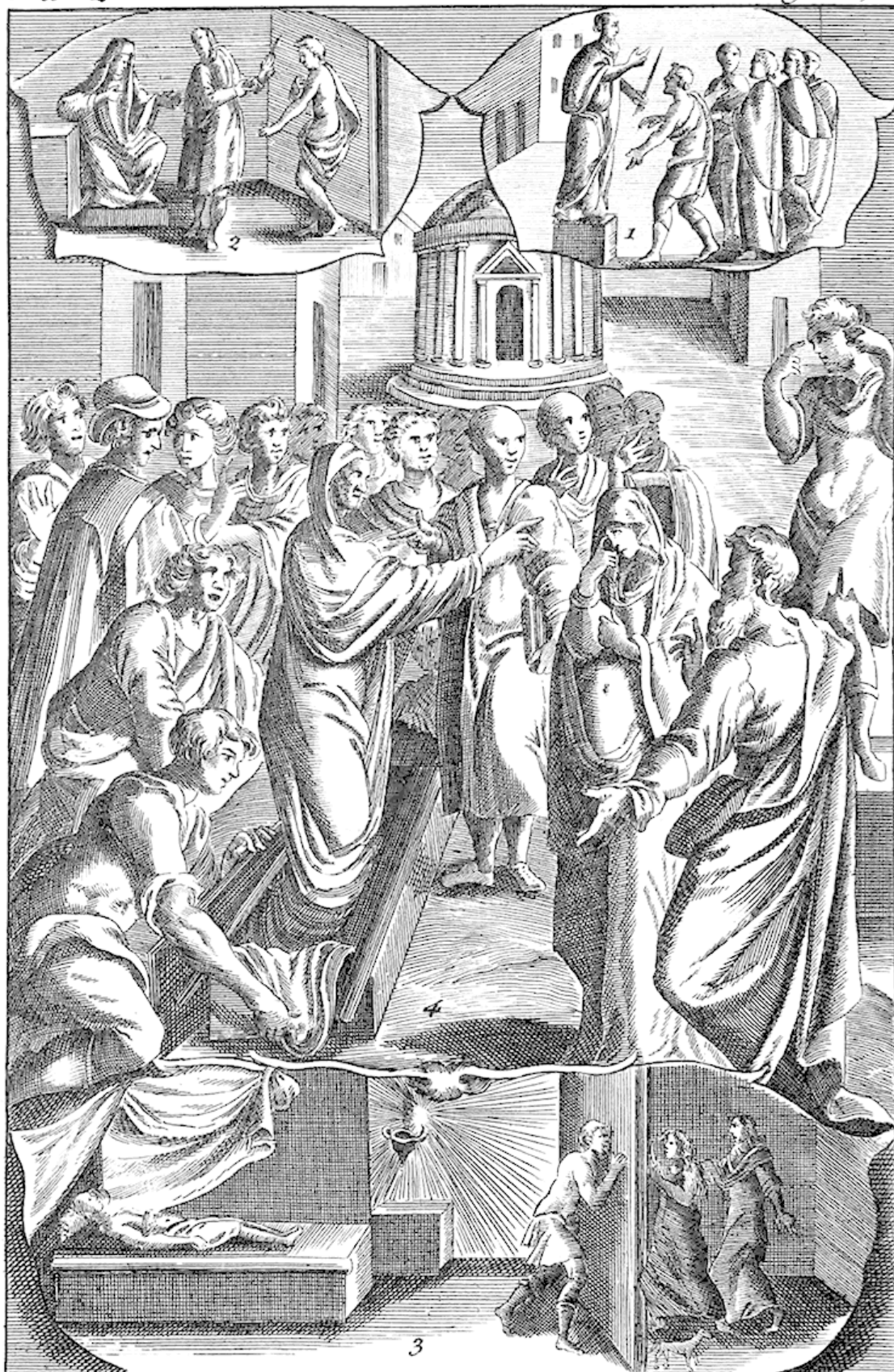
Телефрон готовится рассказывать историю о живых покойниках