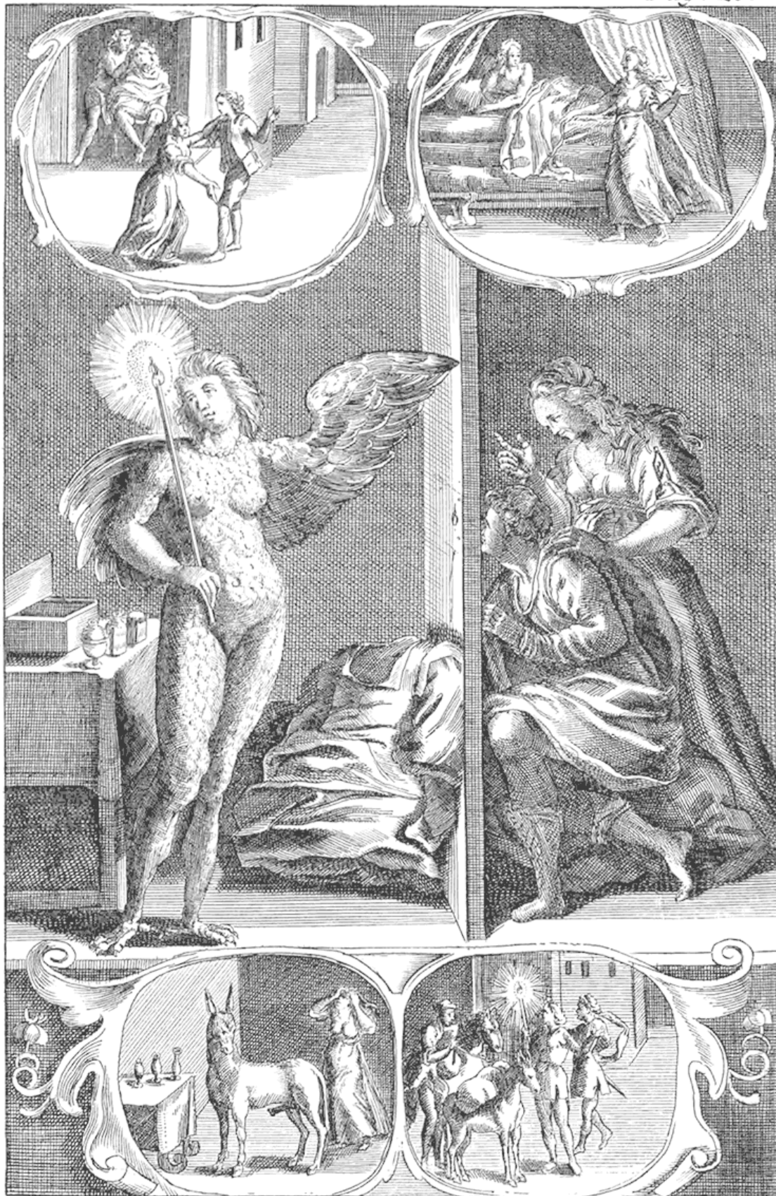
Наблюдение Луция и Фотиды за превращением Памфилы в сову