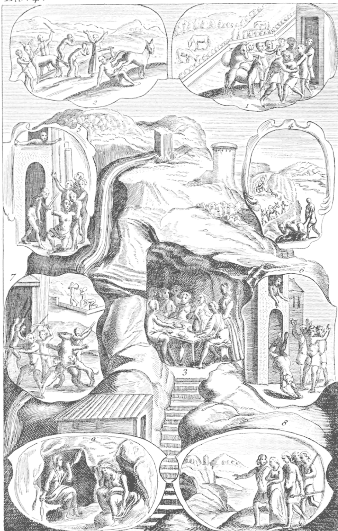
Пир разбойников за накрытым в изобилии столом