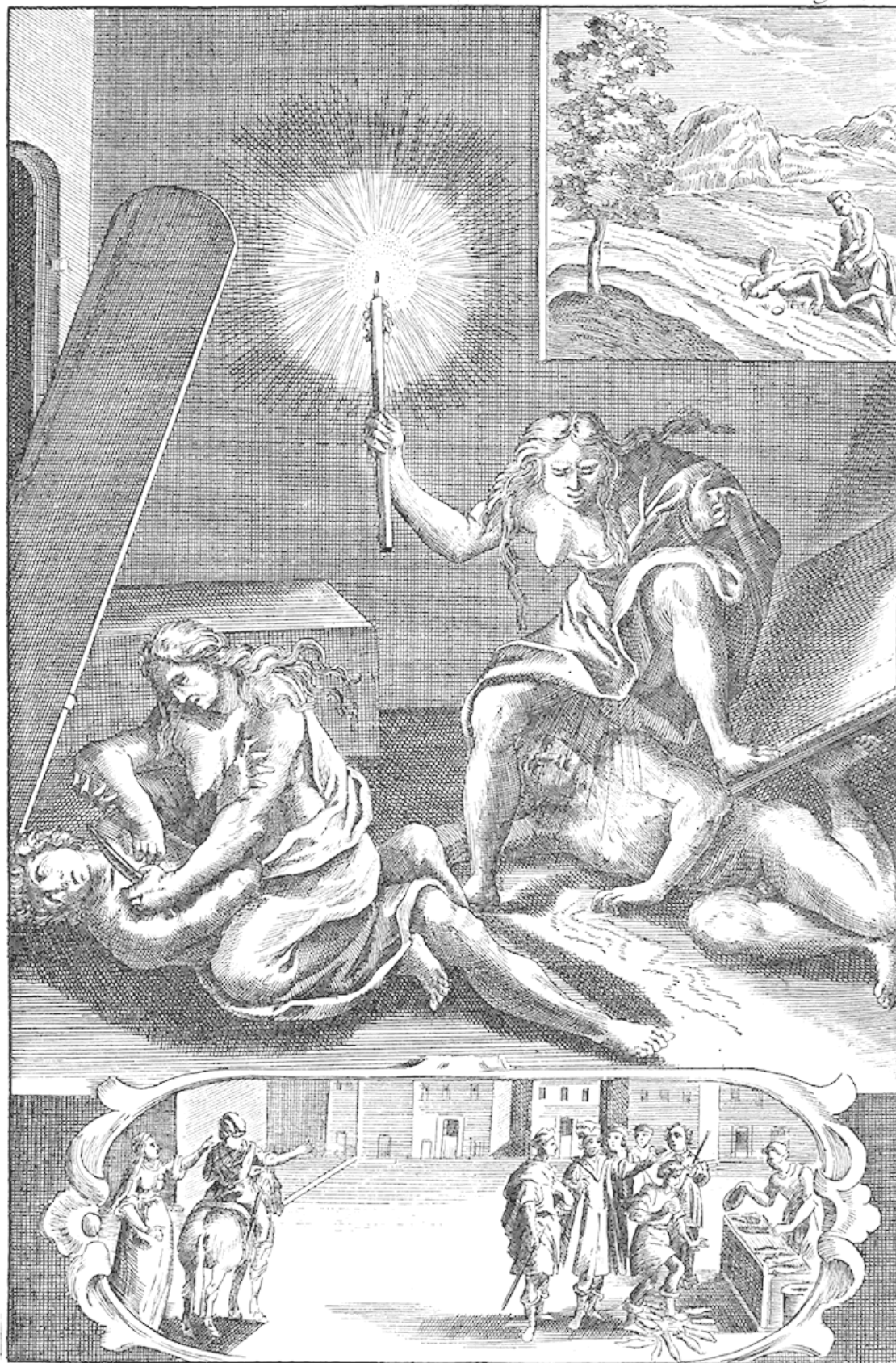
Меро́я пронза́ет мечо́м шею́ Сократа́