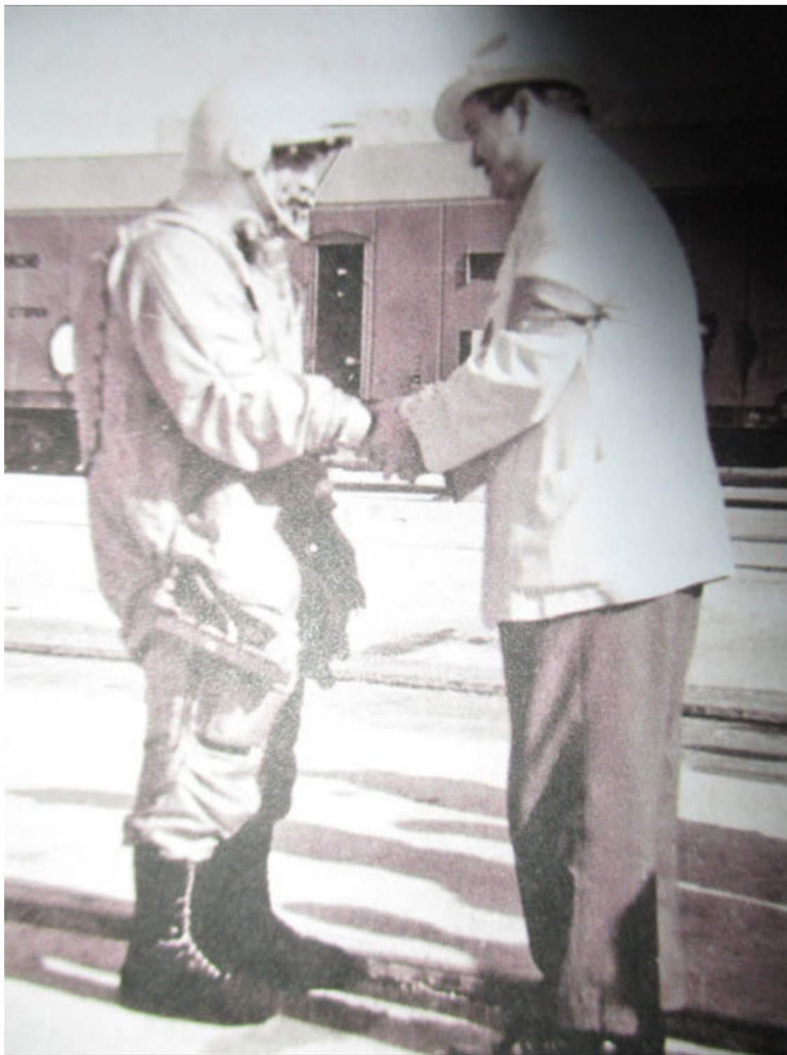
ФОТО: Г.С. ТИТОВ И ПРЕДСЕДАТЕЛЬ ГОСУДАРСТВЕННОЙ КОМИССИИ ПО КОСМИЧЕСКИМ ПОЛЁТАМ Л.В. СМИРНОВ ПЕРЕД СТАРТОМ. 6 АВГУСТА 1961 ГОДА