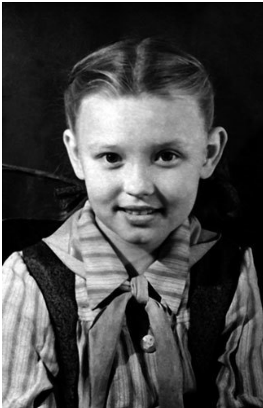
Вера Алентова в детстве.

«Мы росли, как трава во дворе. Моя мама была актрисой, но все свободное время подрабатывала в пошивочном цехе. Мой отец умер рано, когда мне было четыре года, и мама растила меня одна. Сегодня я понимаю, что мы – сами того не желая – нанесли урон вашему поколению. Мы, дети военного времени, росли в жутких условиях...»