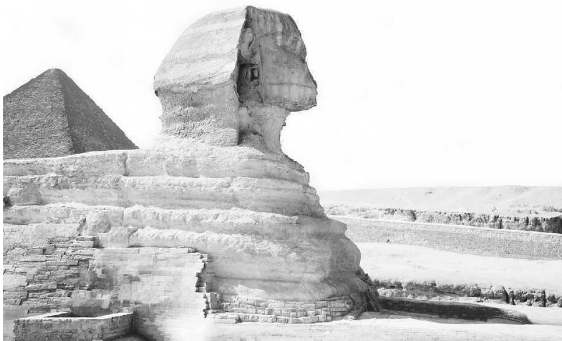
Большой египетский сфинкс в Гизе

В ближайшее время, возможно, в пирамидах Египта будет сделано самое сенсационное открытие за всю историю человечества. Международная группа ученых из Японии, Америки и Европы просканирует территорию некрополя Гизы, чтобы увидеть скрытые помещения под землей и понять, насколько глубоко уходят таинственные лабиринты. Они будут искать то, что американский пророк Эдгар Кейси называл «залом летописи Атлантиды». Он предсказал, что вход в это помещение находится под правой лапой Сфинкса и именно там хранятся данные о существовавшей сотни тысяч лет назад на Земле высокоразвитой цивилизации.