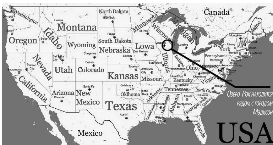
Озеро Рок расположено в юго-восточном Висконсине, США

Водолазы осмотрели как следует не только сами пещеры, но и другие территории бухты. И в одно из погружений их ждала еще одна удивительная находка, объяснения которой тоже пока нет. Был обнаружен большой гранитный камень и прикрепленная к нему длинная цепь. Что это – древний якорь с иностранного судна? Ведь гранита в этих местах не было и нет... Тогда сколько лет этот артефакт находится под водой и откуда он вообще взялся?