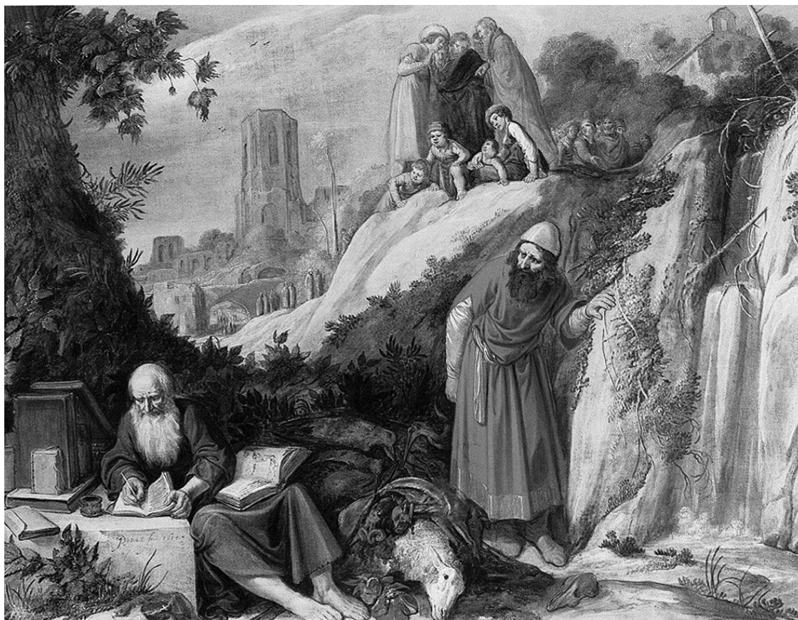
Гиппократ посещает Демокрита в Абдере. Я. Пиньяс. 1614

Как писал Вернер Йегер в своей «Пайдейе», VI и V века до н. э. являются необычайно важным моментом в истории с точки зрения этики, а также социальной значимости медицины. Врач гиппократовского толка действует на основании этических принципов, основанных на его любви к науке и к человечеству. «Там, где есть любовь к человеку, там есть любовь к науке» (Гиппократ «Наставление», 6).