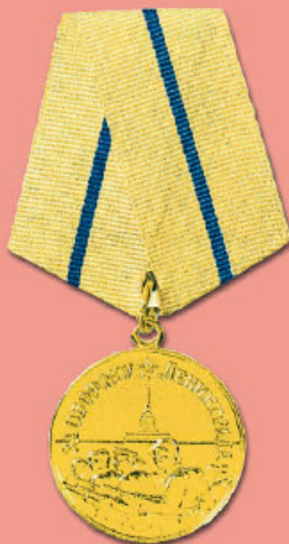
Медаль «За оборону Ленинграда»