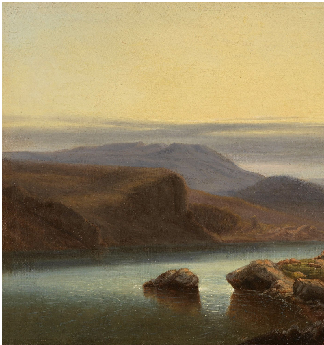
Шотландский пейзаж. Фрагмент

В древние времена, о которых потом слагались легенды, в Шотландии правил король Малькольм. Шотландская родовая знать, таны, владевшие частями страны, враждовали между собой и даже поднимали оружие против короля. Но Малькольм усмирил танов и подчинил королевской власти всю страну.