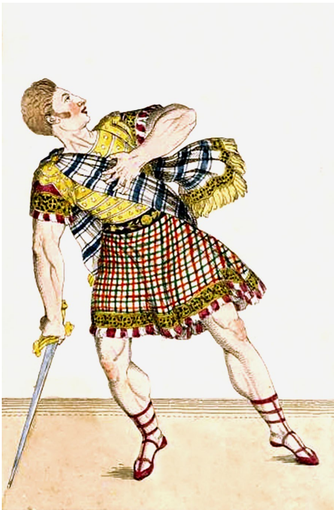
Французский хореограф и танцовщик А. Вестрис в роли Макбета. Театр Сан Карло в Неаполе