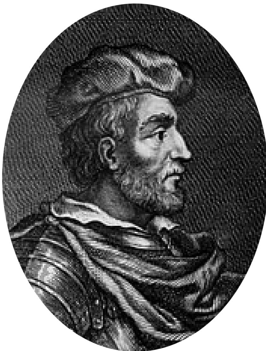
Король Шотландии Дункан I

Король Дункан послал в Лохкабер войска, но Макдовальд наголову разгромил их. Дункан растерялся и призвал верных ему танов на совет. Успех мятежников был столь внушителен, что многие таны не осмелились выступить против них и, не зная, что посоветовать королю, уклончиво отвечали на его вопросы.