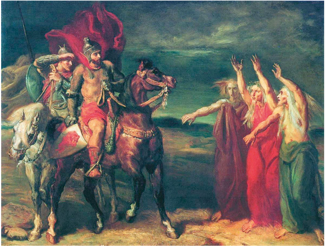
Макбет, Банко и ведьмы