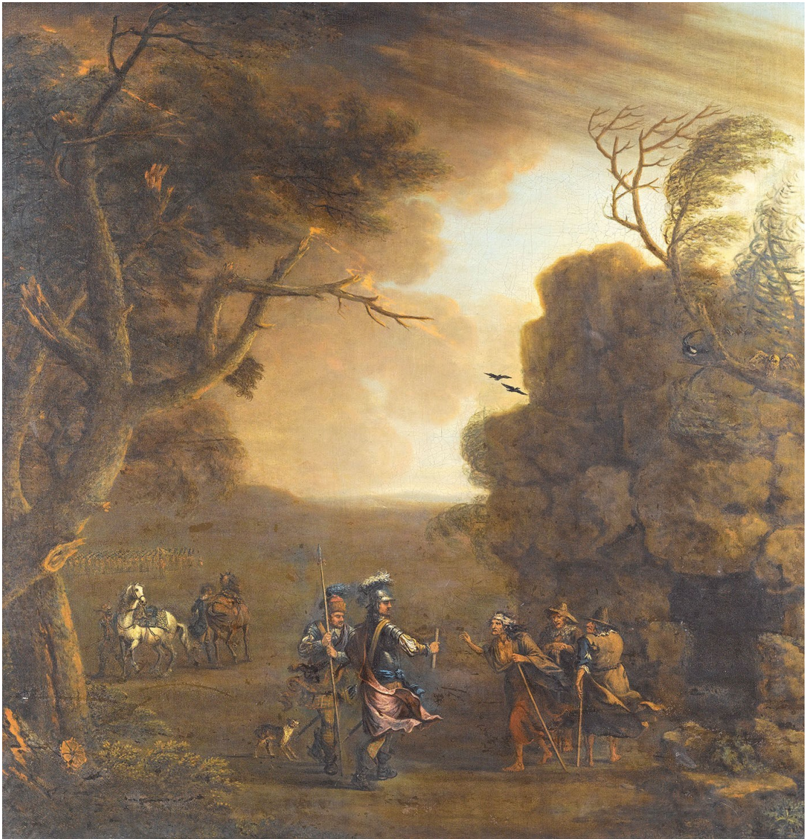
Макбет, Банко и три ведьмы

После всех этих событий Макбет и Банко, опередив свои войска, вдвоем поскакали к королю Дункану. Они ехали через дикую пустошь и вдруг встретили трех старух в одежде из лохмотьев, с растрепанными волосами и с мужскими бородами.