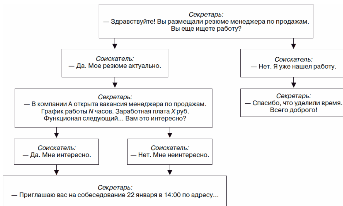
Рис. 1.1. Пример скрипта разговора с соискателем вакансии

Заниматься активным поиском кандидатов можно поручить даже секретарю. Достаточно составить скрипт приблизительно следующего содержания (рис. 1.1).