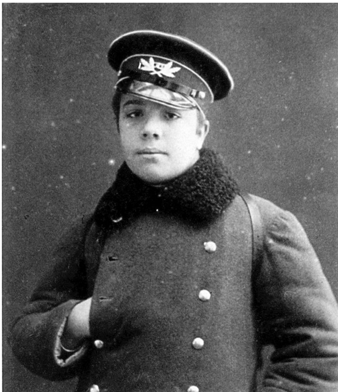
Дягилев в гимназической форме

Сергей с ранних лет учился игре на фортепиано и занимался вокалом, проявляя выдающиеся способности к музыке. Он также пробовал себя в композиции. Его первым серьезным опытом сочинения был романс в подражание Глинке «Ты помнишь ли, Мария?», который пятнадцатилетний мальчик написал по случаю годовщины свадьбы своих родителей. Каллиграфически переписанную партитуру этого романса мать Дягилева сберегла, благодаря чему она сохранилась, единственная из всего написанного Дягилевым-композитором.