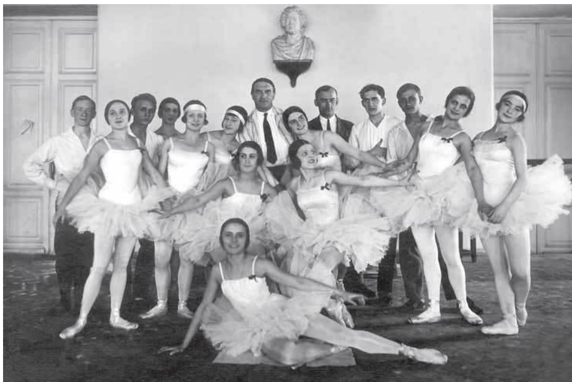
Наш выпуск. 1926 год