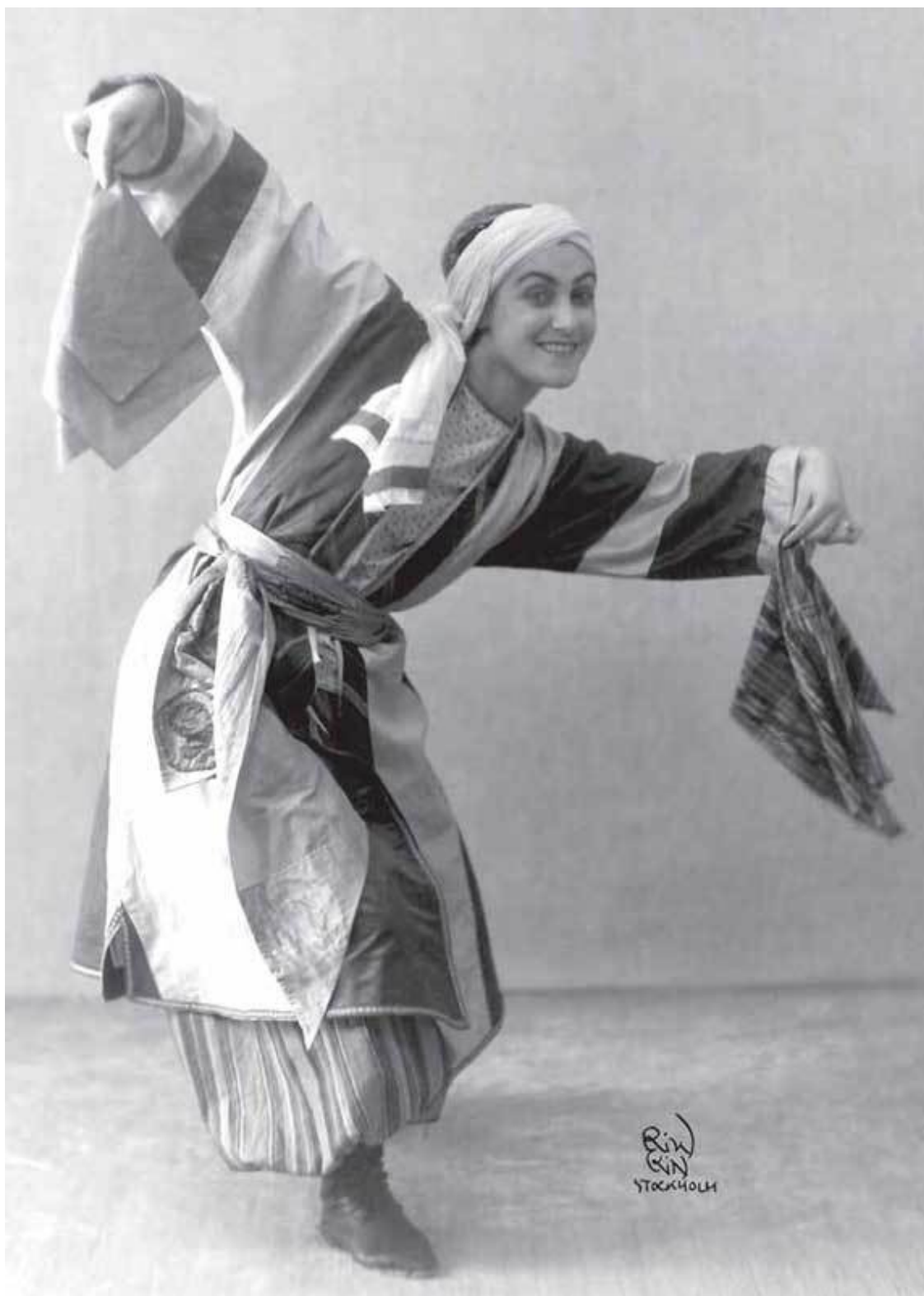
В «Узбекском танце»

Тем временем множились разного рода импресарио. Зазывали в дальние дали. Скажем, пожалуйста в Серпухов, тамошний зритель истосковался по настоящему искусству, жаждет балета.