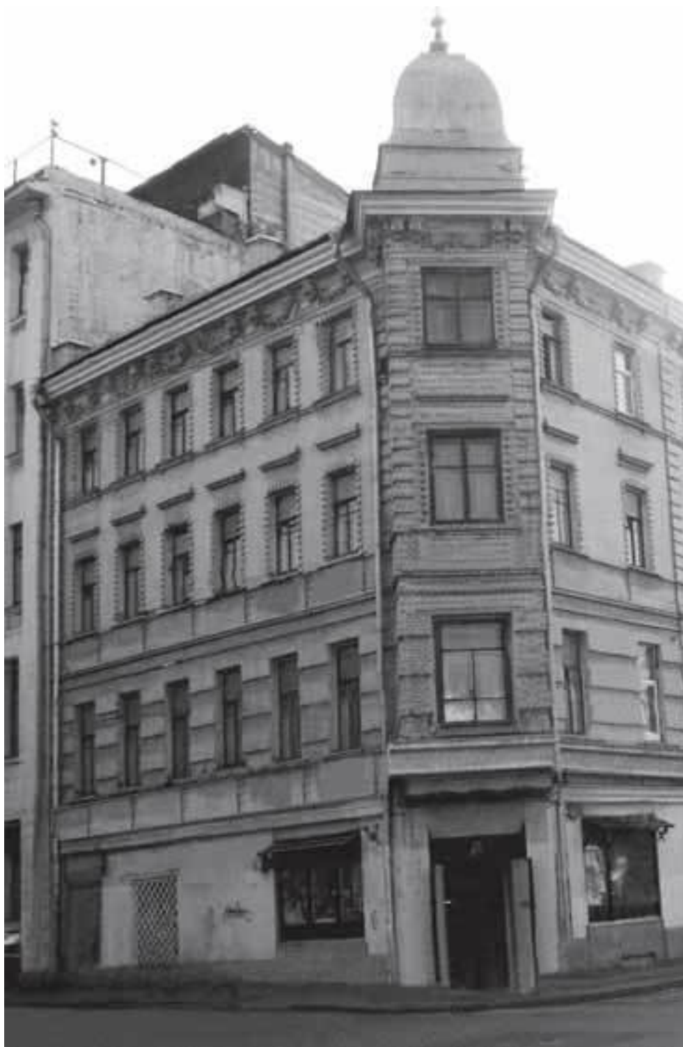
Дом моего детства на углу Рождественского бульвара и Большой Лубянки