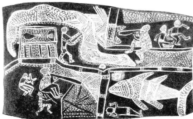
Южноскандинавские наскальные культовые изображения эпохи бронзы

Такова была идеология XVIII и XIX веков. Наверное, многие из вас слышали имена знаменитых в свое время (около 100 лет назад) ученых, таких, как Эдуард Тейлор (он был одним из крупнейших специалистов по мифологии и первобытным религиям) и Джеймс Джордж Фрэзер, книги которого, например, «Золотая ветвь», недавно у нас переизданы. Не общаясь с людьми первобытного уровня, с так называемыми дикарями, получая материалы из третьих рук, они создавали свои конструкции о дикости, темноте, наивности и примитивности человека, стоящего на низком материальном уровне развития цивилизации. Но потом многие из западных ученых вынуждены были отказаться от такого взгляда. Миклухо-Маклай был одним из первых, кто, пусть и ненадолго, вошел в мир этих людей. И что ему открылось? Что это такие же люди, с такими же переживаниями, страстями, грехами, ошибками, с умением думать логически, ясно. Миклухо-Маклай писал: «В их верования, в их душевную жизнь я старался не проникать». Он был человеком очень тактичным; и вообще он считал, что столь малого времени, какое он прожил на гвинейском побережье, недостаточно, чтобы понять душу первобытного человека.