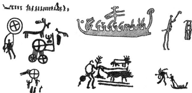
Южноскандинавские наскальные культовые изображения эпохи бронзы

Ученые спорят о том, в какой степени можно относить неандертальца к человеческим существам, но едва ли кто-нибудь из них может доказать свою точку зрения и обосновать ее, потому что мы не можем проникнуть в сознание этого человека, или человеческого существа, или недочеловеческого существа. Все-таки это, скорее всего, другой вид, несомненно низший. В его культуре мы уже находим примитивные каменные орудия, огонь, который поддерживался довольно долго, но не находим искусства, которое является важнейшим спутником всей человеческой истории. А искусство древних людей всегда было связано с духовным, религиозным началом.