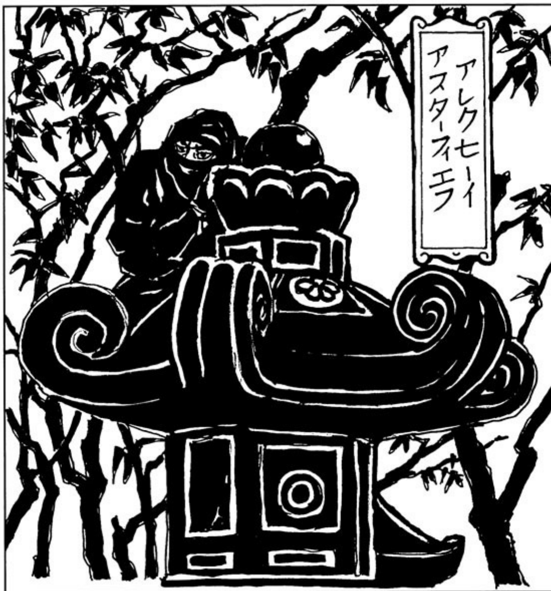
Ниндзя маскируется под каменный фонарь. Рисунок по мотивам японских гравюр

Большую ценность представляют дневники тех времен, например «Тамон-ин никки» («Дневник обители Тамон») 6 .