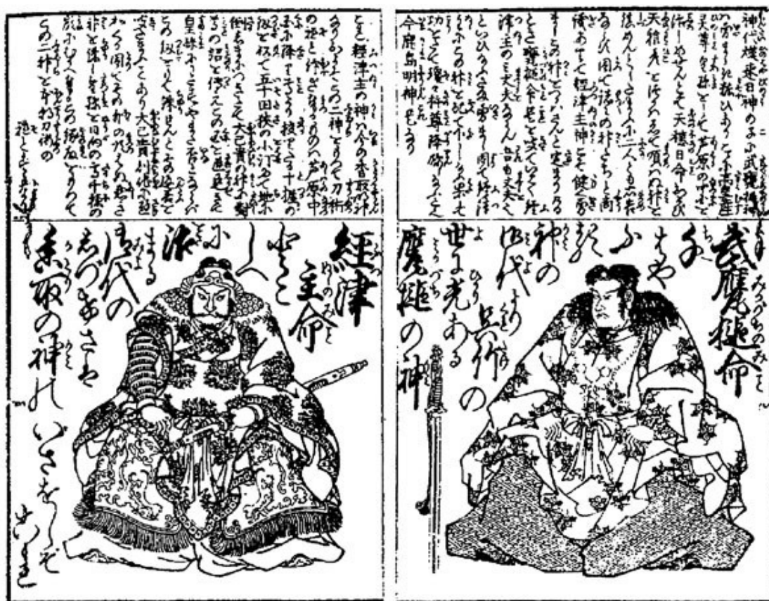
Воинские божества Фуцунуси-но микото (слева) и Такэмикадзути-но микото (справа). Со старинной гравюры

В качестве таких «разведчиков» в «Кодзики» и «Нихонги» упомянуто несколько богов, в том числе и покровители воинов и воинских искусств Такэмикадзути-но микото и Фуцунуси-но микото. Интересно, что с важнейшими центрами почитания этих богов, храмами Касима-дзингу и Катори-дзингу, связаны две крупнейшие школы японского боевого искусства: Касима синто-рю и Катори синто-рю, каждая из которых включает в свою программу свой вариант системы шпионажа и разведки – синоби-но дзюцу .