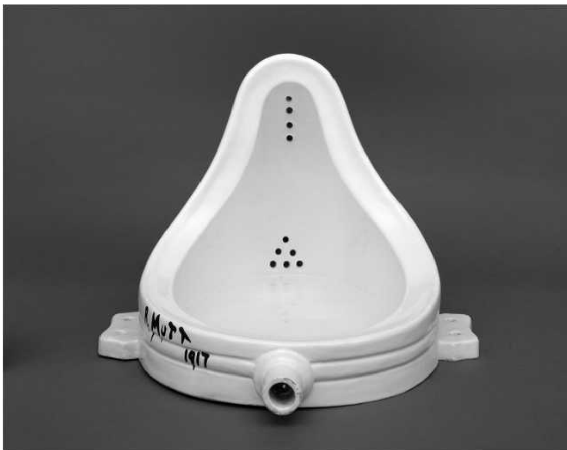
Ил. 1. Марсель Дюшан. «Фонтан» (1917)

По крайней мере так представлялось самому Дюшану. Он был уверен, что изобрел новую форму скульптуры, подразумевающую, что художник выбирает предмет массового производства без сколь-либо очевидных эстетических достоинств и лишает его функционального предназначения, – иными словами, делает бесполезным, – после чего, присвоив имя и изменив контекст и ракурс, превращает в настоящее произведение искусства. Свое изобретение он назвал «реди-мейдом», то есть готовым изделием.