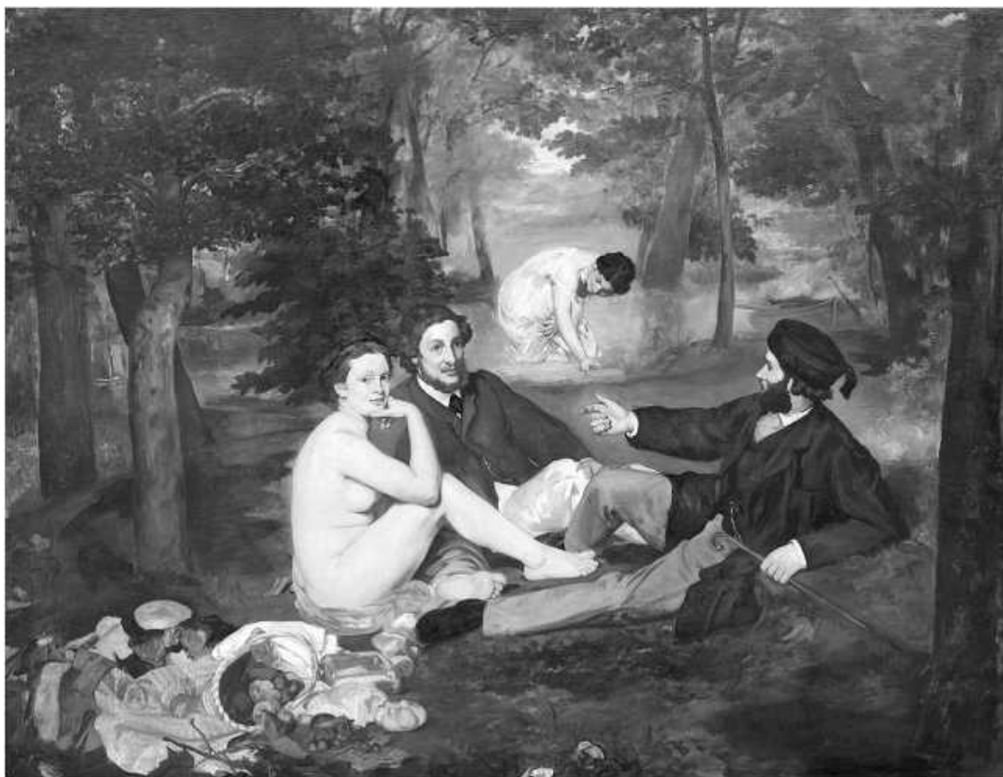
Ил. 3. Эдуард Мане. «Завтрак на траве» (1863)

Замысел Мане заключался в том, чтобы взять за основу классические аллегории и композиции и «освежить», придав им современное звучание. Исходя из этого, в картину он поместил трех персонажей – двоих приятных на вид молодых людей современного облика и хорошенькую юную женщину, – и взял сюжетом пикник горожан в парке. Оба натурщика одеты с иголочки – красивые сюртуки и галстуки выгодно оттенены элегантными брюками и темными ботинками. На даме же одежды нет. Никакой. Совсем.