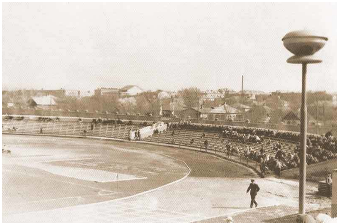
Каменск-Шахтинский, 60-е годы, стадион «Прогресс»