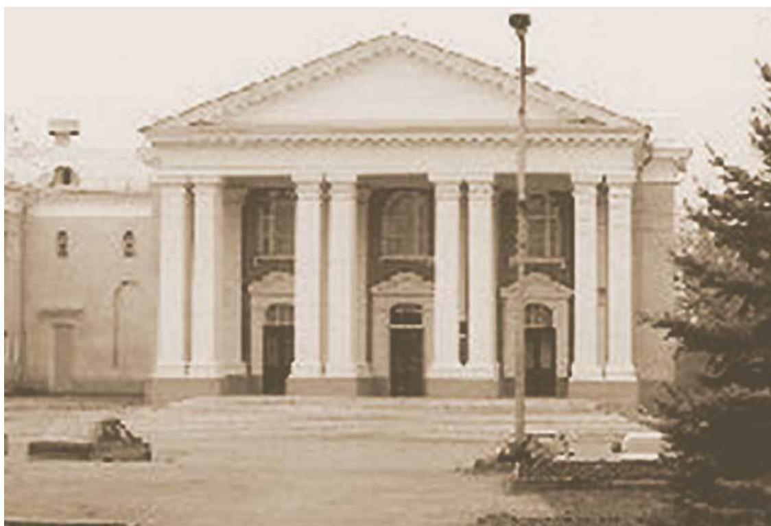
Каменск-Шахтинский, 60-е годы, ДК Маяковского