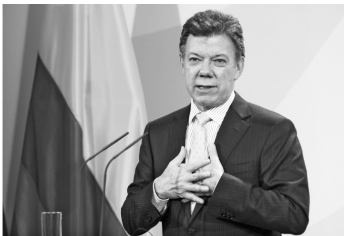
Президент Колумбии Хуан Мануэль Сантос