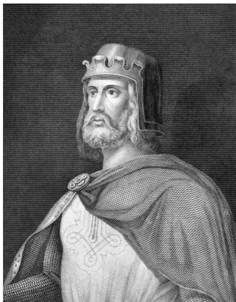
Генрих I Птицелов

Древние тайные общества прекрасно знали, как оградить любую гробницу от посягательств. Вспомним знаменитое проклятие гробниц: практически все, кто вскрыл могилу Генриха Птицелова, умерли.