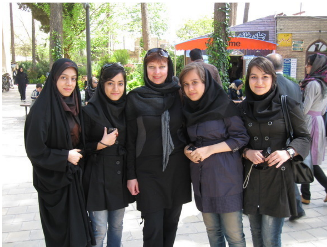
Так женщины одеваются в Иране

Пить спиртные напитки в Иране категорически запрещено. Сказать честно, и не тянет, наверное, потому, что когда нет соблазна, нет и соблазненных. Там можно купить безалкогольное пиво, но по вкусу оно, в основном, напоминает наш лимонад. За употребление наркотиков можно вообще больше не строить планов на жизнь.