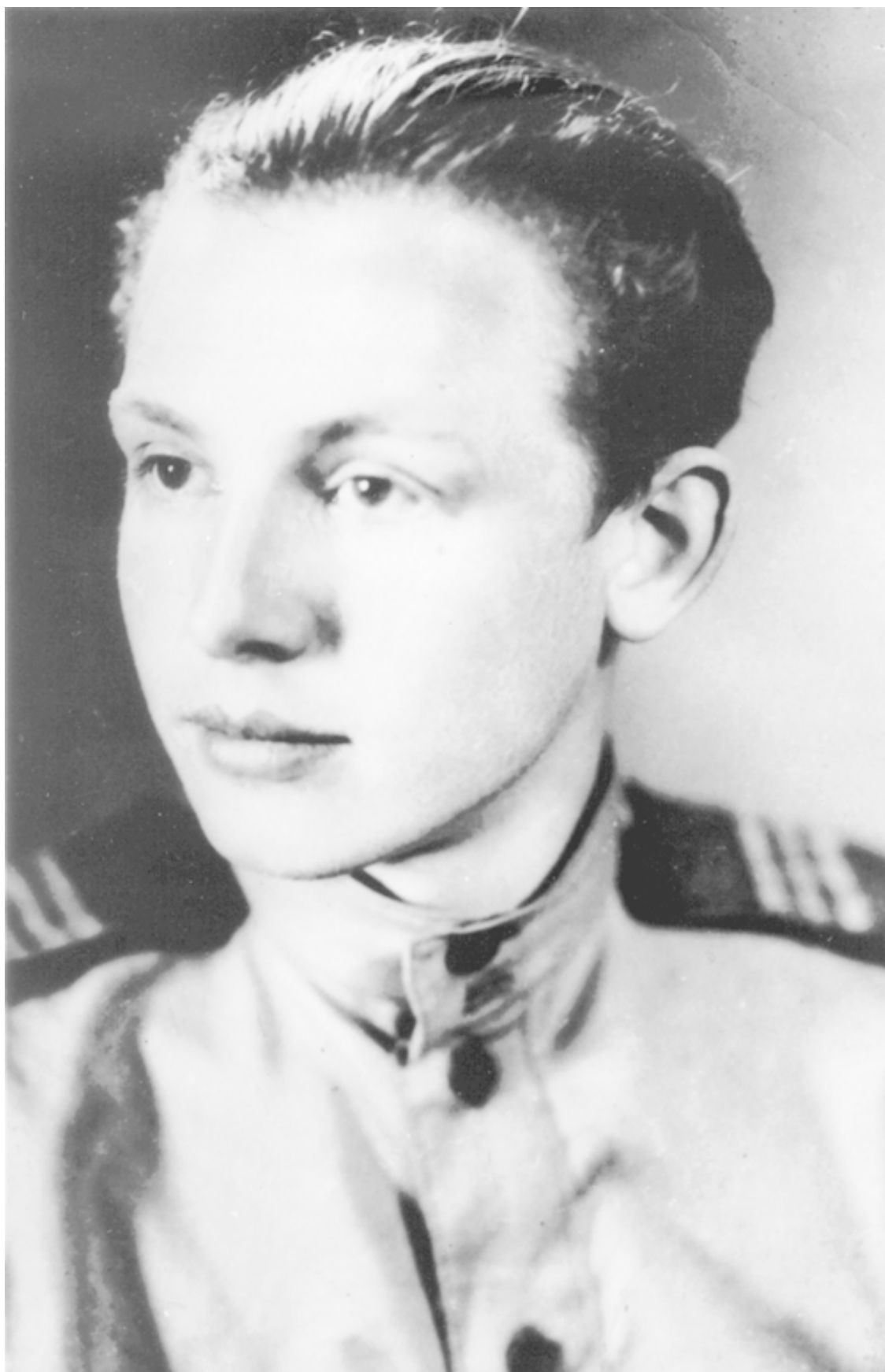
Восемнадцатилетним мальчишкой ушел на фронт