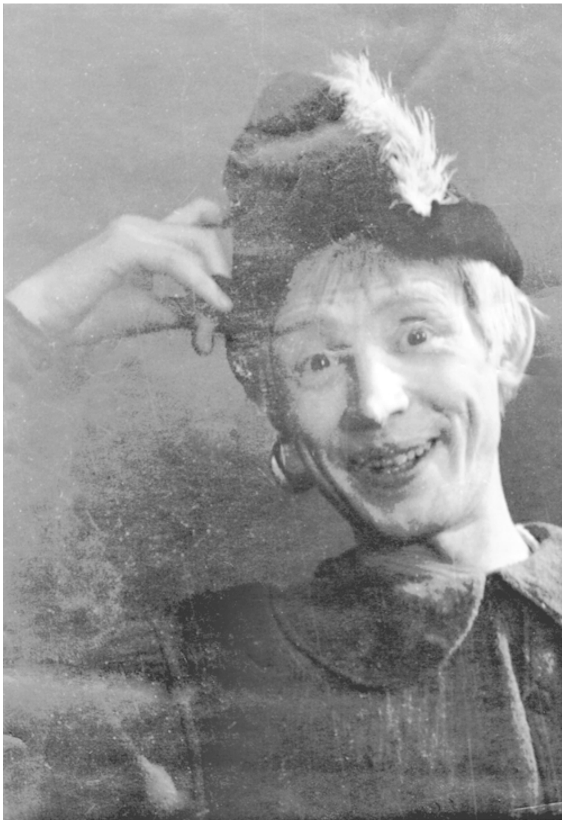
Бионделло. «Укрощение строптивой». Сталинградский театр им. Горького, 1953 год