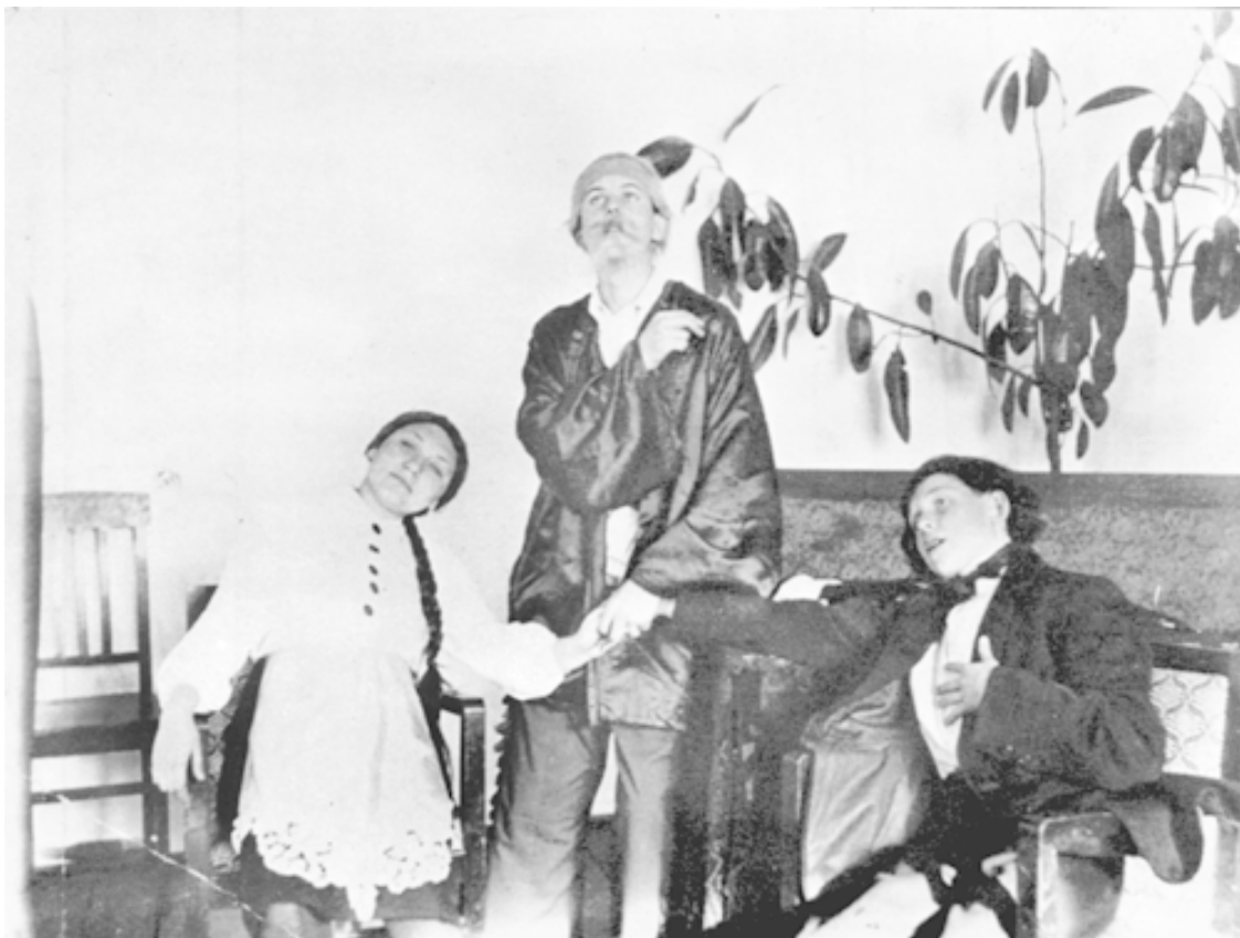
Первый снимок на сцене. А.П. Чехов «Предложение». Драмкружок школы № 14 г. Красноярска

Я посмотрел. Они были еще в той поре, когда недельный цыпленок мог бы преподавать им уроки гордости и орлиного достоинства. Были они голые, из них торчали черенки будущих перьев, не то что летать да парить – держаться-то на ногах они не могли, только противно шипели и разевали клюв. В общем, ничего такого, что видел в них он, я не заметил.