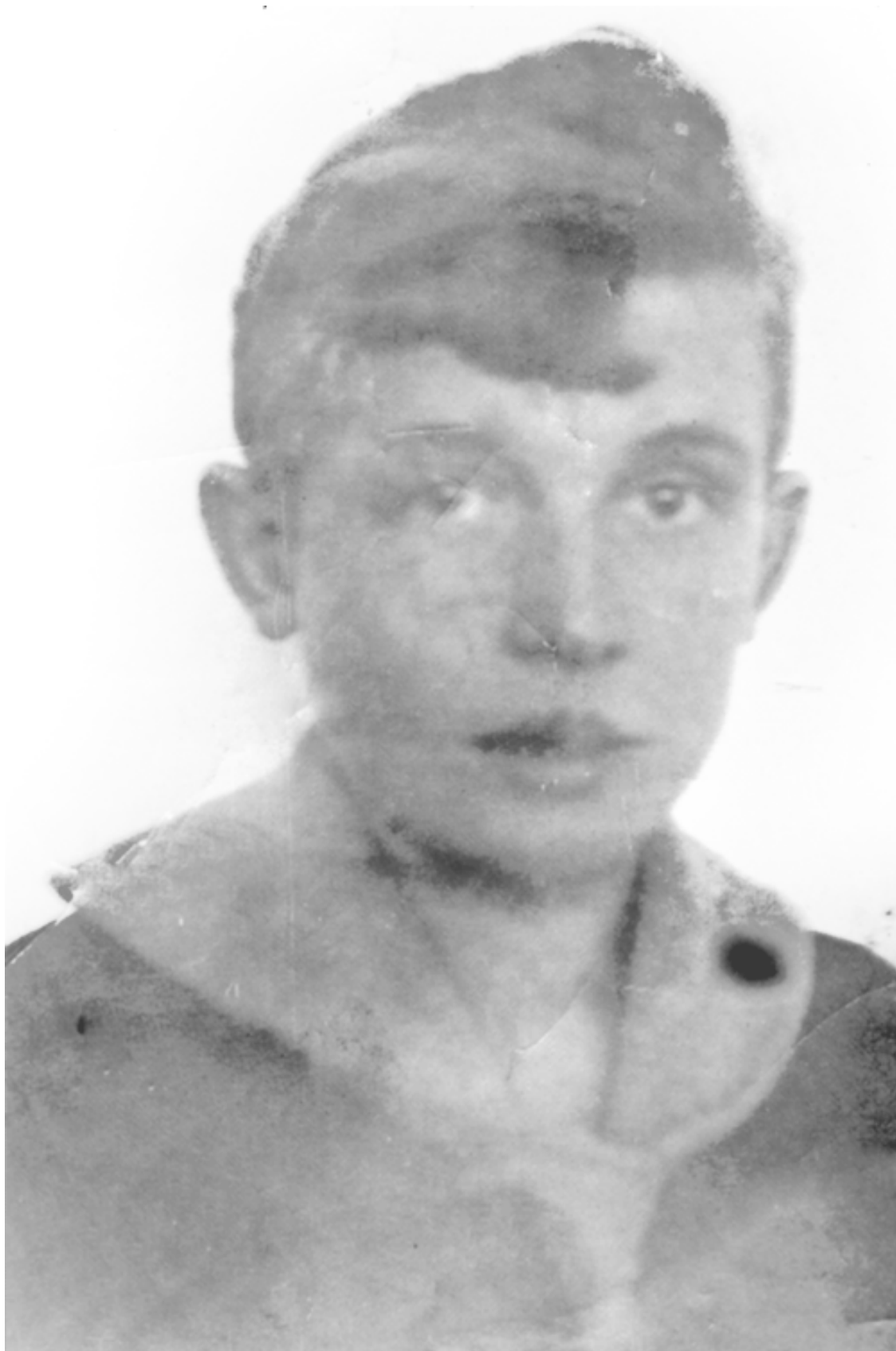
Очень старый снимок из 14-й школы г. Красноярск. Восьмой класс, 1941 год

– Есть инстинкт жизни, но не долголетия.