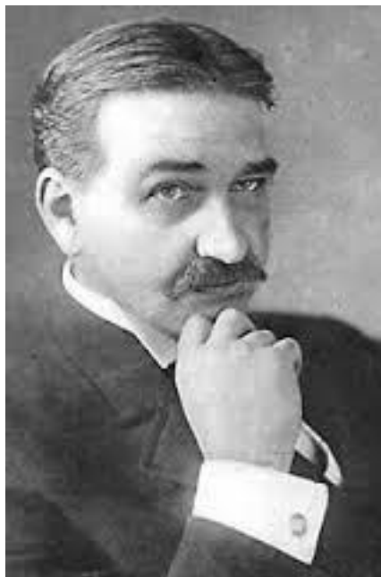
Лаймен Фрэнк Баум

Лаймен Фрэнк Баум (1856–1919) замечательный детский писатель, родился в США, в городе Чаттануге (шт. Нью-Йорк) и прославился на весь мир своими великолепными детскими книгами, среди которых «Сказки матушки Гусыни» и «Страна Оз», больше известной в нашей стране, как «Волшебник Изумрудного города».