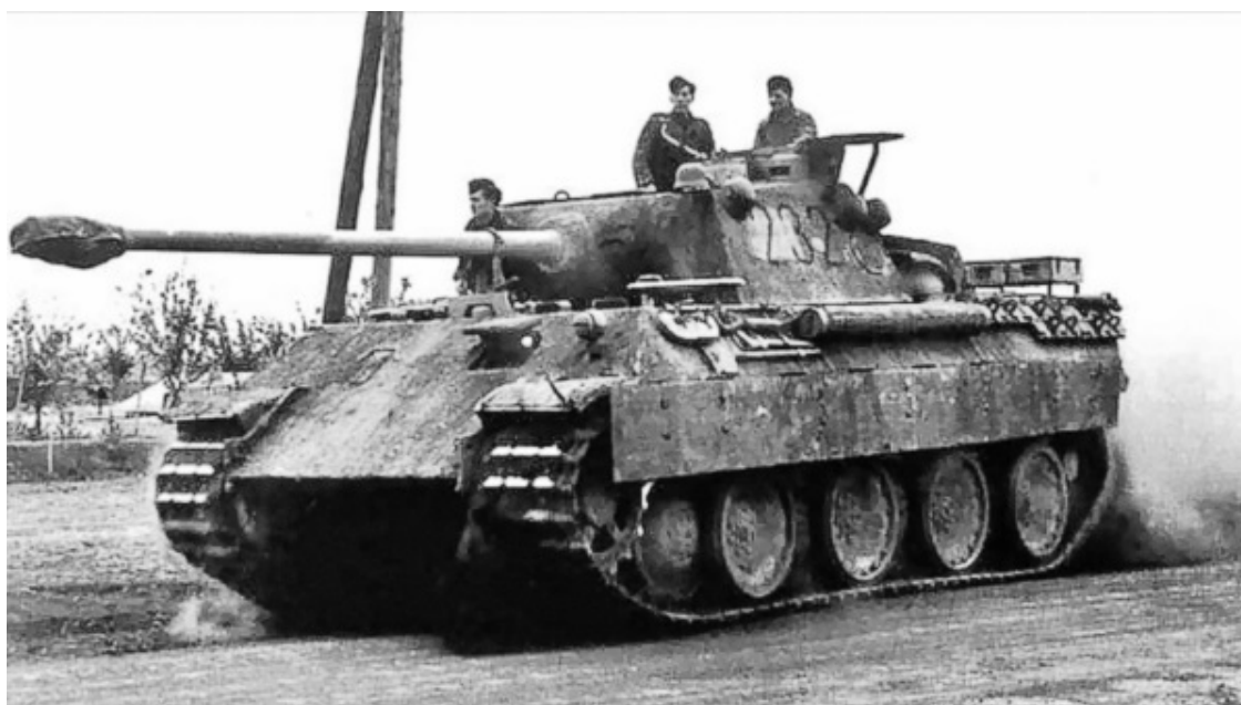
Немецкий танк «Пантера»

Линия фронта протянулась от Баренцева до Азовского моря, в районе Курска огромным выступом протяженностью 550 километров угрожающе вдавилась в расположение немецких войск. Это и есть та самая Курская дуга, где лоб в лоб должны были столкнуться главные наступательные силы вермахта и Красной армии. Почти 2 000 000 солдат, тысячи орудий, самолетов и танков изготовились на направлении главного удара в напряженном ожидании схватки.