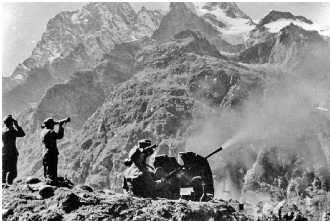
Немецкие солдаты в горах Кавказа

Еще накануне сражения под Курском Гитлер приказал строить мост через Керченский пролив. Он не оставлял надежды прорваться на Ближний и Средний Восток через Кавказ. Кавказский фактор стал доминировать в стратегии фюрера после поражения под Москвой и провала плана молниеносной войны.