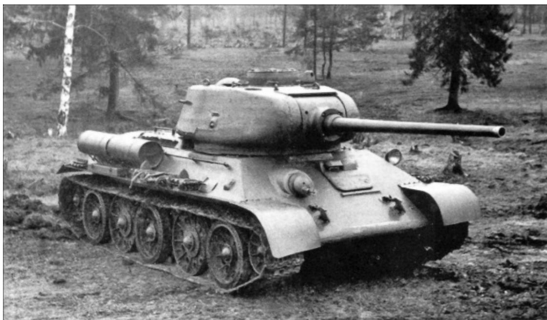
«Т-34» – гордость советского танкостроения

12 июля на Прохоровском поле разгорелась настоящая танковая сеча. До позднего вечера слышался несмолкаемый гул моторов и лязг гусениц. То и дело танковые башни взлетали в воздух от прямых попаданий, их отбрасывало буквально на десятки метров. Из-за дыма и гари уже невозможно было отличить своих от чужих. Горели сотни танков и самоходных орудий. Прохоровское поле превратилось в гигантское кладбище бронетехники.