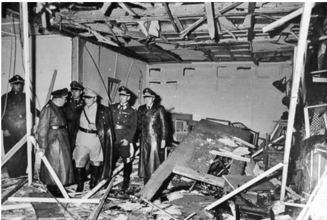
Последствия взрыва в «Волчьем логове» Гитлера