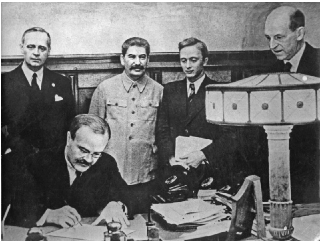
Подписание пакта Молотовым и Риббентропом

Небольшой приграничный город Белосток. Апрель 1941-го. Прошло уже почти два года с того самого дня, как немцы оккупировали Польшу, и потому тревога не покидает улочки городка. Люди запасаются мукой, солью, керосином. И готовятся к военному времени. Народ ничего не понимает в больших политических играх Советского Союза и Германии, но по вечерам все слушают новости из Москвы.