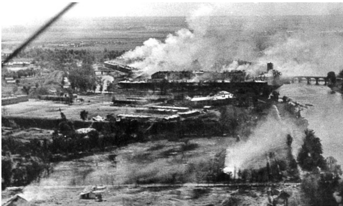
Штурм Брестской крепости 22 июня 1941 года

Первым советскую границу перешел диверсионный отряд «Бранденбург». Выводилась из строя связь, расчищались мосты и дороги. Следом волна за волной хлынула пехота, танки и авиация.