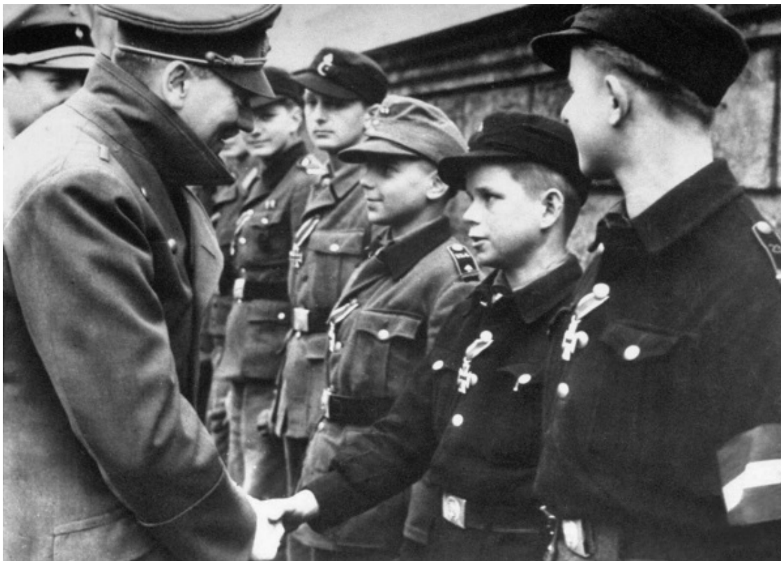
Гитлер пожимает руки воспитанникам «гитлерюгенда»

Еще в 1930-е появились первые школы организации юных гитлеровцев – «гитлерюгенда». Здесь должны были расти сильные, выносливые и преданные делу фюрера солдаты. Турпоходы и спортивные состязания постепенно переходили в военное учение, а солдатские френчи заменяли становившуюся тесной униформу «гитлерюгенда». Германии нужны солдаты, которые будут убивать каждого, кто встанет на пути великого рейха.