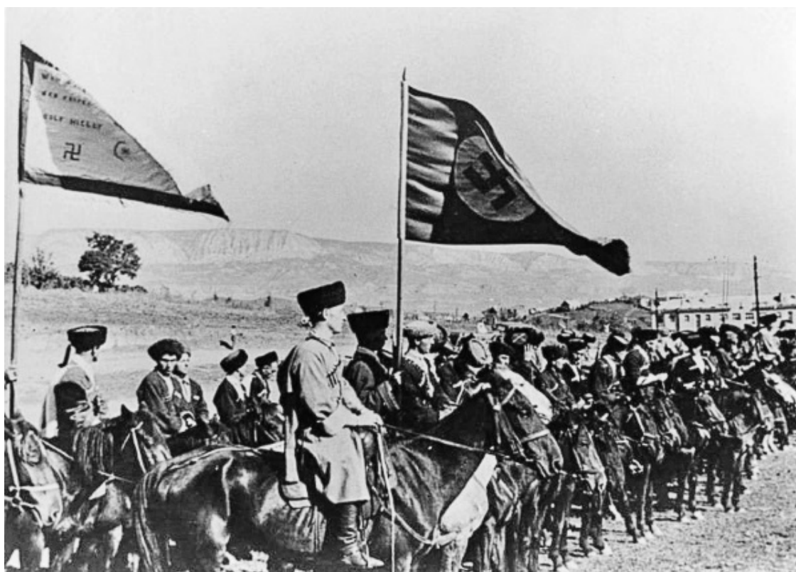
Казачья дивизия вермахта

Гитлер в резкой форме отказался обсуждать автономию для России и русских. Иным было отношение к казакам. Их освобождали из плена, в казачьих станицах не устраивали репрессий. Из пленных казаков начали формировать кавалерийские полки. Летом 1942 года офицер немецкой разведки Филипп Юх прибыл на Кубань для формирования 1-й казачьей дивизии. Вот что он помнит: «Я поступил на службу в 4-й кубанский полк. Я горжусь, что служил именно в этом полку. Потому что там, среди казаков, была поистине удивительная атмосфера. Я помню, как мы вместе с казаками уходили из станицы. Казаки шли вместе с вермахтом».