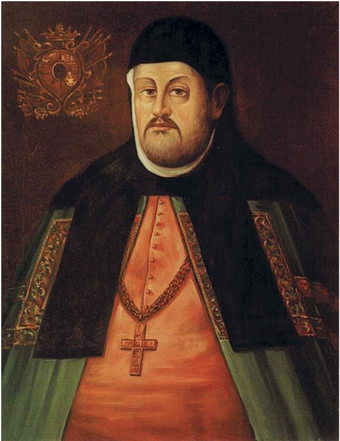
Неизвестный художник. Ипатий Потей. XVII в.

Действительно, Терлецкий опередил всех: он съездил к королю и привез от него к Потее следующую грамоту (от 18 февраля): «Узнали мы сильное желание и добрую мысль вашу к соединению церкви Божией греческой с вселенскою римскою, как издавна под властью одного пастыря, святейшего папы римского, бывало. Это желание и намерение ваше не только хвалим, но и с благодарностью принимаем, усматривая, что это дело духа святого и от Бога начало свое берет, который, как сам в Троице единый, так и церковь свою святую и веру христианскую в единстве и согласии иметь хочет, и одного пастыря в ней поставил, которому не только овец своих, то есть простой народ, но и барашков, то есть всех духовных, епископов, пресвите-