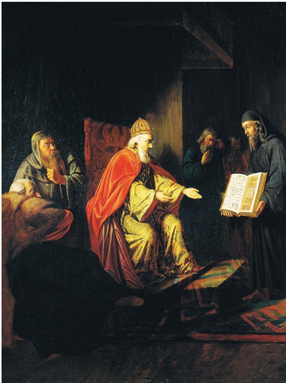
И. Эггинк. Великий князь Владимир избирает религию. 1822 г. Фрагмент

Петр Могила митрополит и его поведение. – Продолжение гонения на православных. – Переселение в Московское государство.