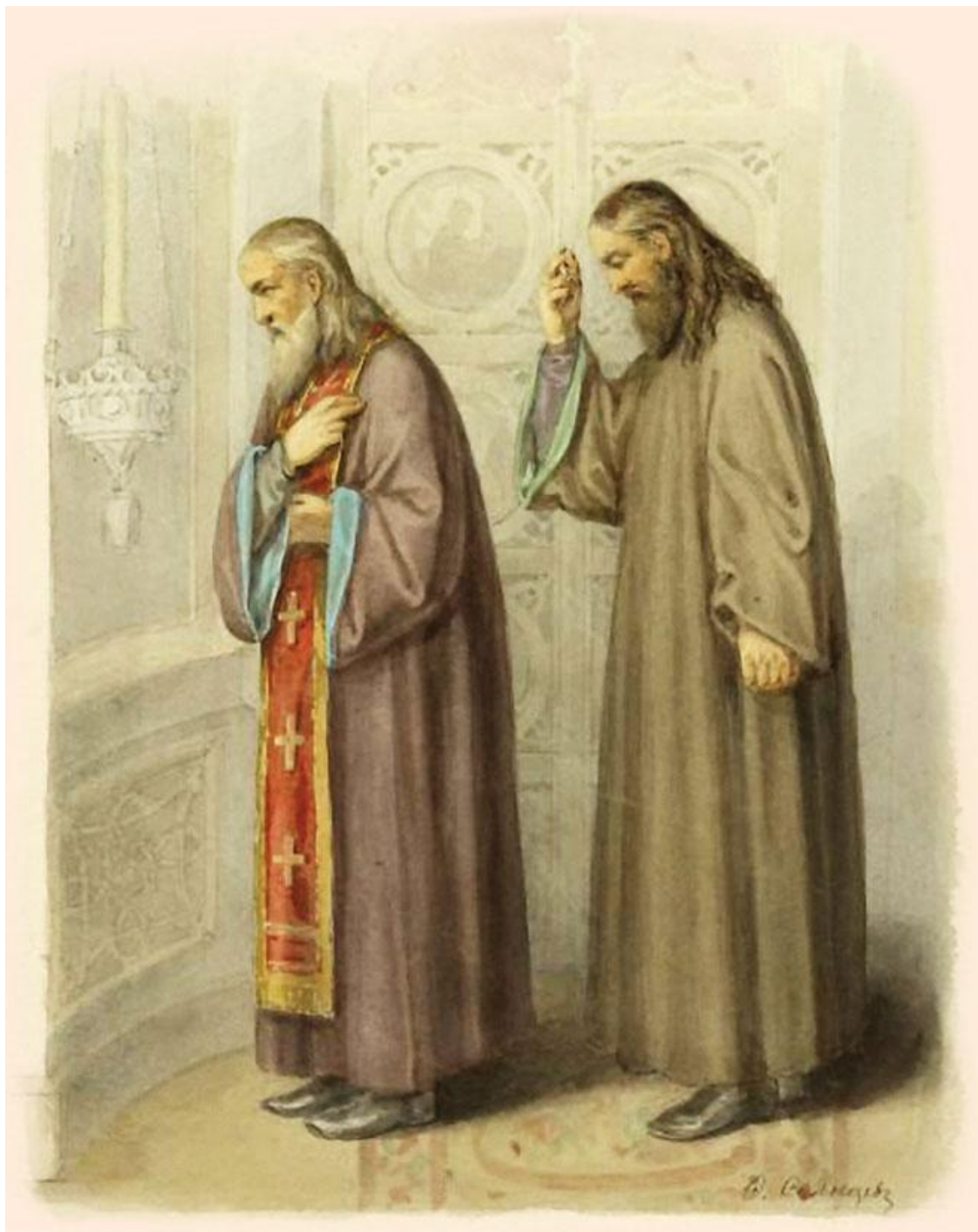
Ф. Солнцев. Священник и дьякон перед началом литургии. Рисунок из книги «Древности Российского государства». Ранее 1853 г.