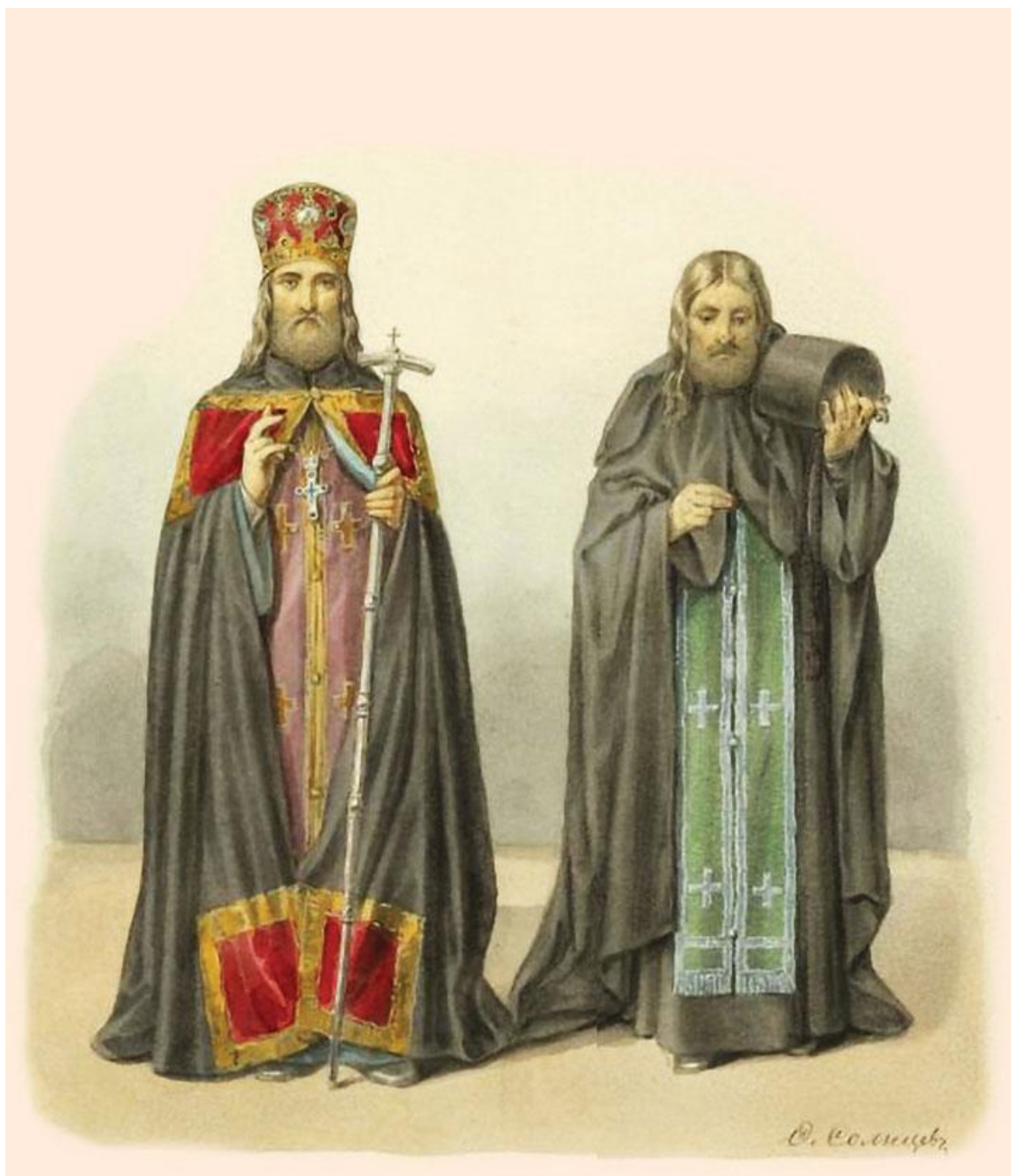
Ф. Солнцев. Архимандрит и иеромонах. Рисунок из книги «Древности Российского государства». Ранее 1853 г.

Не знаем, кто первый начал разговор об унии, Потей или князь Острожский; знаем, что 21 июня 1593 года князь писал владимирскому епископу следующее письмо: «Всякий человек должен стараться о том, чтобы быть размножителем и любителем хвалы Божией. И я, по причине многочисленных мирских занятий моих, хотя не мог посвятить всего себя заботам об умножении хвалы Божией, однако, по христианской обязанности, с давнего времени было у меня желание, и теперь не слабеющее, но более и более распаляющееся, желание найти способ к тому, чтобы церковь Христова, всех церквей начальнейшая, в первобытное состояние прийти могла. Но, как вижу, достойное создается достойными и честное совершается честными. Так и мне или несчастье воспрепятствовало, или собственное недостойнство мое не допустило положить начало доброму делу. Однако св. писание говорит: «Сила Божия в немощи совершается», и потом: «От человек невозможное Богу возможно». Опираясь на эти слова, незадолго перед тем, не славы ради житейской, Бог весть, но сетуя о падении церкви Христовой; не терпя