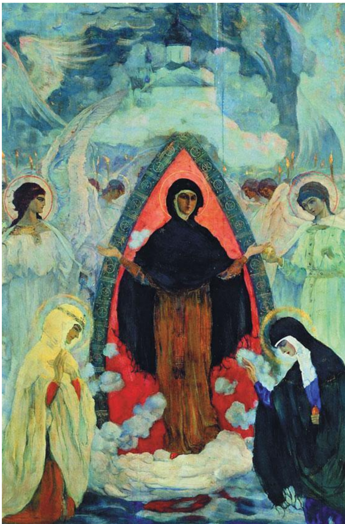
М. Нестеров. Покров Богоматери. 1914 г.

После собора Кирилл Терлецкий занемог и поехал в Сендоми́р лечиться; потом пришла весть, что он при смерти. Тогда один из урядников замковых острожских, Боровицкий, по