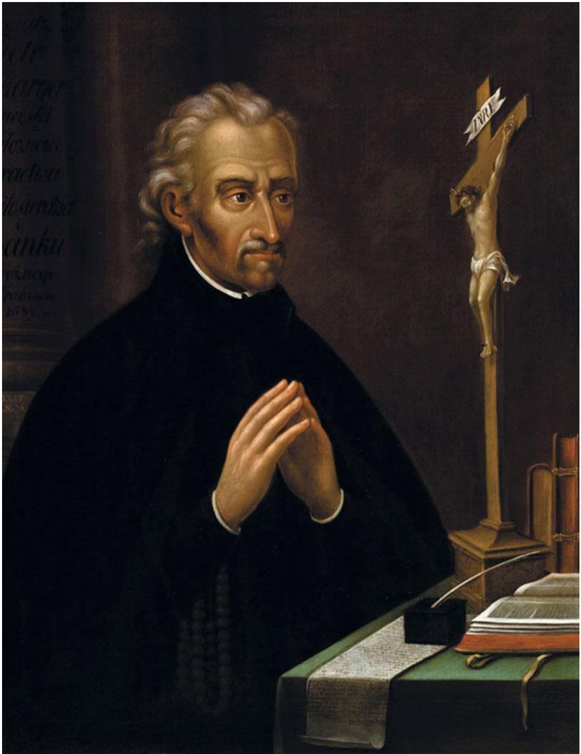
Неизвестный художник. Петр Скарга. XVII в.

Мы видели уже, что во второй половине XVI века западнорусская церковь находилась далеко не в завидном положении. Правительство, принадлежавшее к другому исповеданию, по меньшей мере равнодушное, не могло быть внимательно к ее интересам, любило кормить ее хлебом своих, а не ее служителей, отдавать не только православные монастыри, но и целые епархии в управление людям, не чувствовавшим никакого внутреннего призвания к подобным должностям, из желания наградить не заслуги, оказанные церкви, но заслуги, оказанные государству только. Такие пастыри не могли укреплять паству в вере и нравственности: отсюда ослабление дисциплины церковной, ослабление нравственности низшего духовенства, упадок