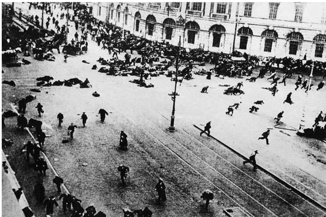
4 июля 1917 г. Расстрел рабочей демонстрации на Невском проспекте.

Спрашивается, зачем Александр Федорович начал заигрывать с военными, всячески одобряя их намерения к решительным действиям? Керенский стал заложником ситуации, при которой самой влиятельной политической силой в столице стали солдаты петроградского гарнизона. Двести тысяч вооруженных и обнаглевших от вседозволенности молодцов в солдатских шинелях категорически не желали отправляться на фронт и любые попытки правительства вернуть их к дисциплине и порядку могли кончиться для «временных» министров самым печальным образом. Солдатская масса, подпавшая под влияние большевистской агитации, стала настоящей бомбой, грозившей взорваться в любой момент. Поэтому в правительстве вызрел план «разгрузить» Петроград от разложившейся солдатской массы, отправив полки на фронт воевать за победу революции, но сделать это руками самих военных.