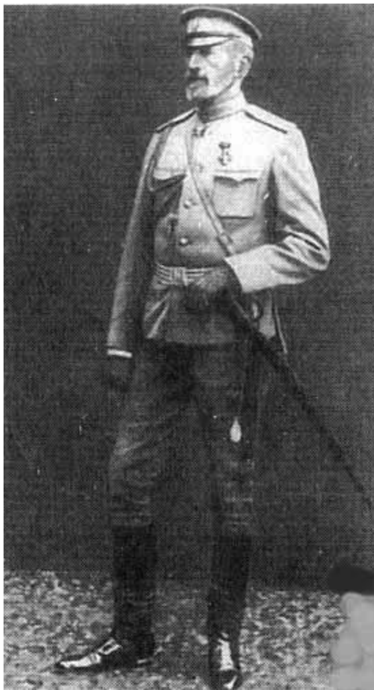
Великий князь Николай Николаевич, видный участник антимонархического заговора.

У романовской камарилы имелся еще один мотив для участия в заговоре – их личная нескрываемая ненависть к государю и его жене-немке, распутинщине, засилью при дворе либералов, лоббирующих интересы западной буржуазии и прочим прелестям самодержавного декаданса. Немаловажно, что все великие князья были представителями умирающего класса помещиков-землевладельцев, стремительно вытесняемого на обочину жизни промышленной буржуазией, а потому они объективно желали установления политической монополии на власть консервативных сил. Старая аристократия стремительно утрачивала экономическую и политическую силу, однако она сохраняла некоторое влияние административное. И этот свой последний ресурс высокородные заговорщики попытались разменять на упрочение своих политических позиций. Вряд ли члены династии отважились бы на сговор с либералами-антимонархистами, но контакты с армейскими верхами они легко могли установить через своих