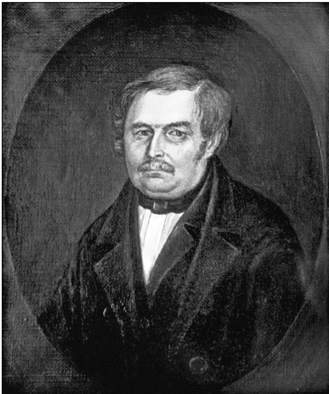
Василий Гоголь-Яновский – отец Николая Гоголя

славянскому поколению в южной России, которого вся жизнь была борьба и которого историю я взялся представить.