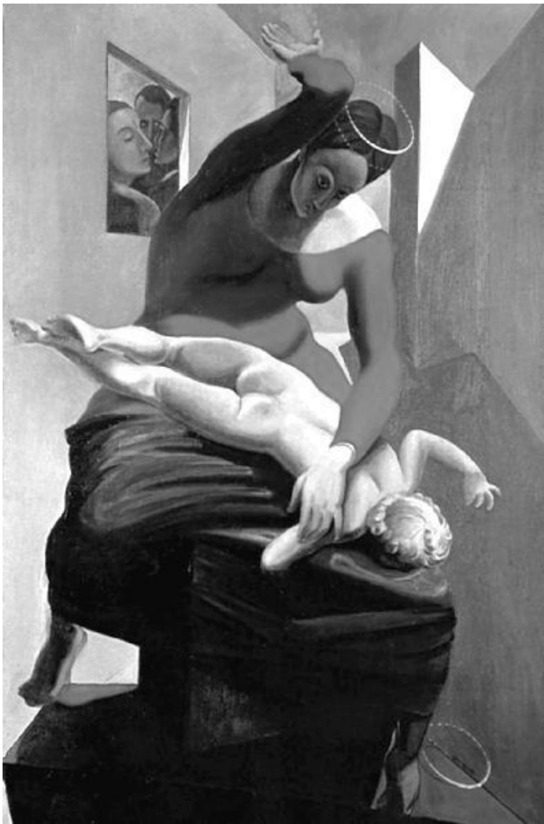
Пресвятая Дева наказывает младенца Христа. Художник Макс Эрнст