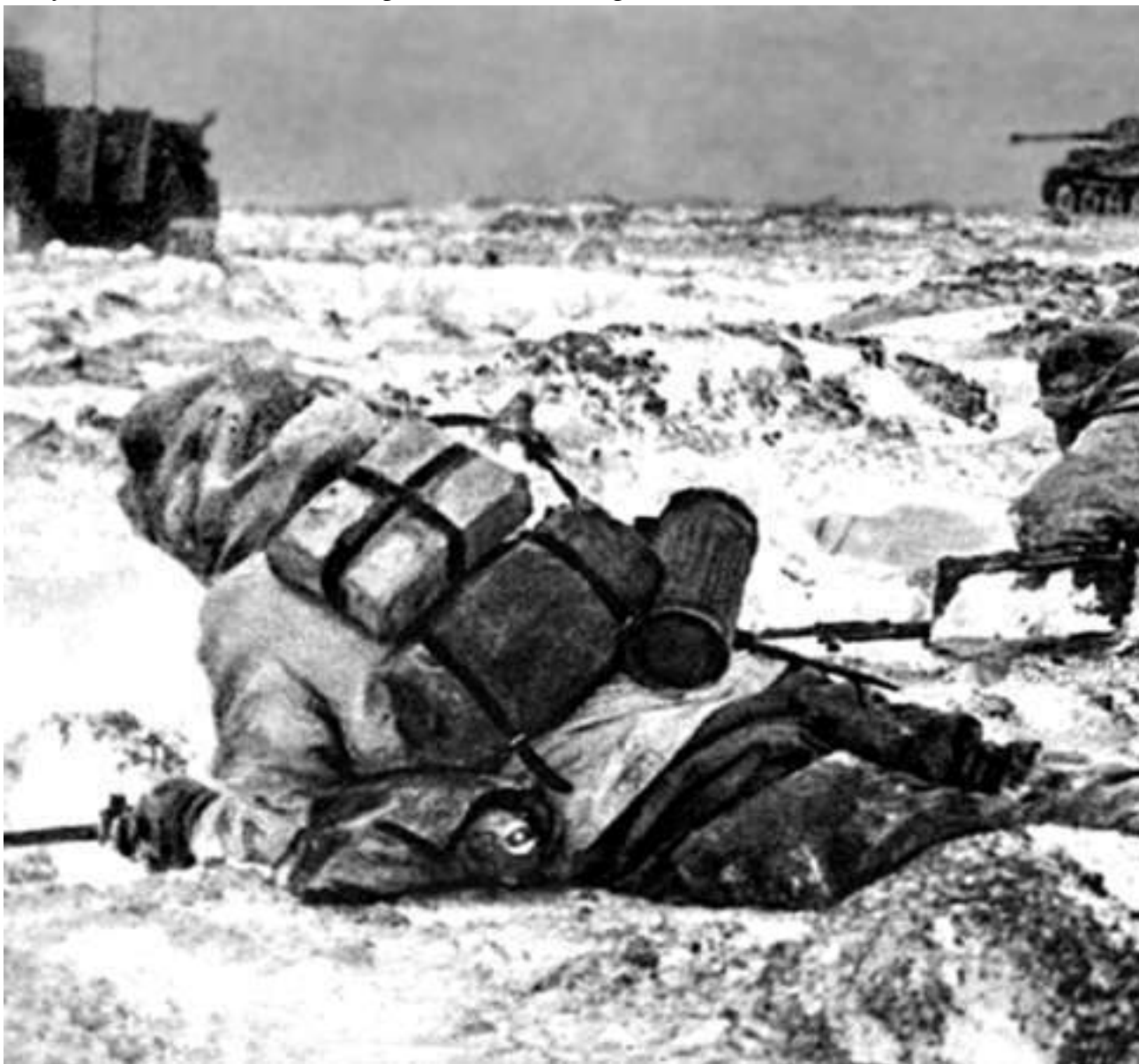
26 Иллюстрация к статье из немецкого журнала военного времени, посвященной ноябрьским боям на оршанском направлении. На фото видны «Тигры» и залегшая пехота

Здесь необходимо отметить, что три батальона 1-й штурмовой бригады и ее учебная рота по плану были поставлены в первый эшелон в линию на фронте 800—1000 метров впереди, именно впереди боевых порядков 251-й стрелковой дивизии. Соседом справа 1-й штурмовой бригады была 220-я стрелковая дивизия, соседом слева – 331-я стрелковая дивизия. Исходные позиции в 70—150 м от проволочного заграждения противника «штурмовики» (так их называли в документах) заняли скрытно и заблаговременно к 20.00 20 октября. Бригада должна была наступать вдоль Минской автострады и железной дороги.