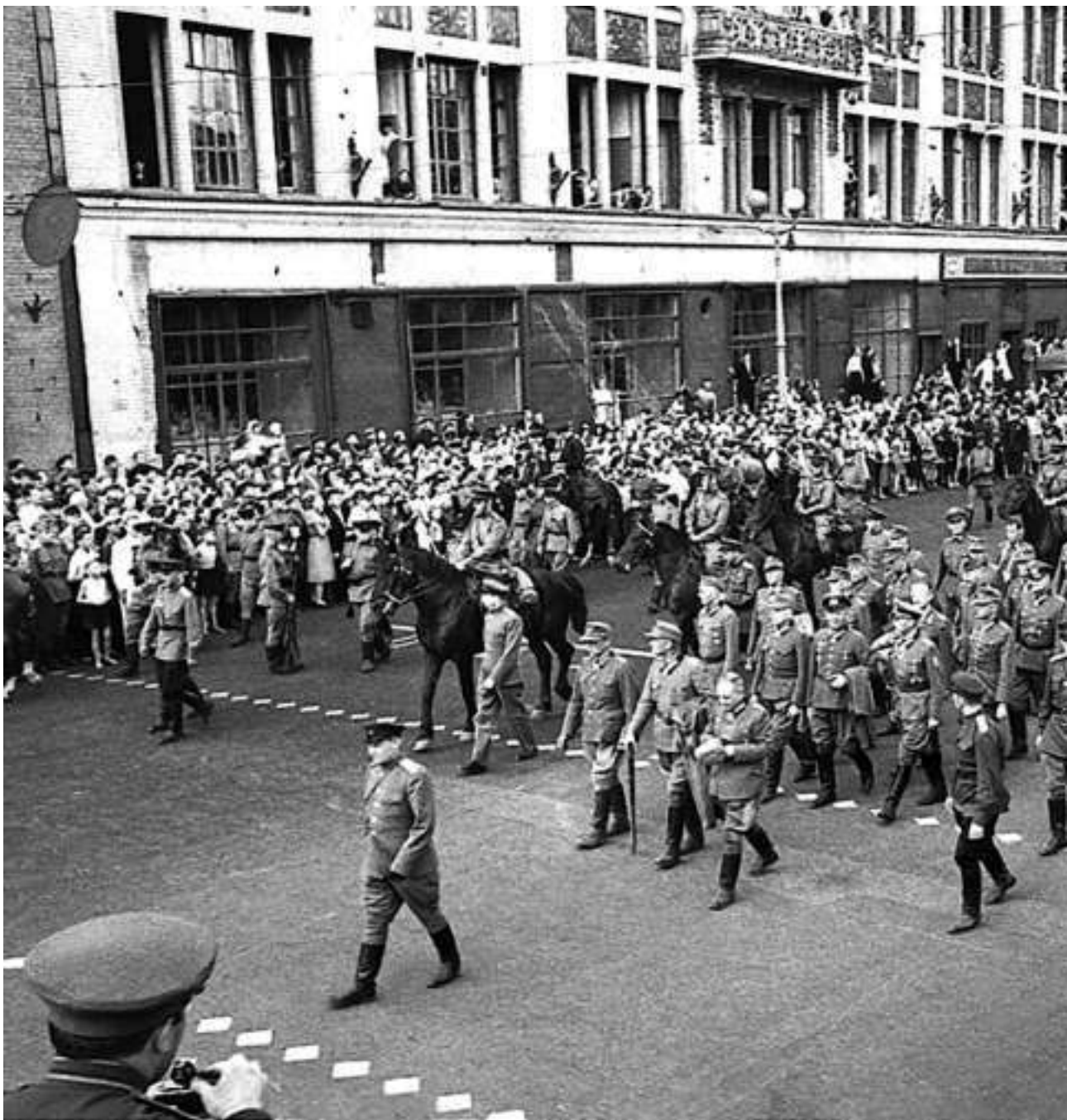
Колонна немецких военнопленных во время «марша побежденных» в Москве 17 июля 1944 г. Впереди компактной группой шагают 19 генералов

В контексте событий на Западном стратегическом направлении в целом «Багратион» выглядит настоящим чудом. Позиционный фронт группы армий «Центр», славившийся своей неподатливостью еще со времен боев за Ржев, был не просто взломан с продвижением на несколько десятков километров, он стремительно рухнул, боевые действия перешли от затяжных боев за «избушку лесника» к маневренным действиям и танковым прорывам на десятки километров в сутки.