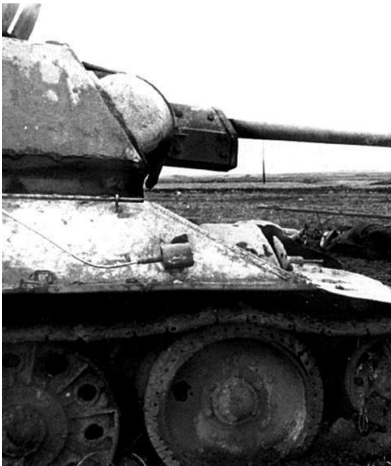
Подбитый в районе шоссе Москва – Минск под Оршей танк Т-34

С целью сломить сопротивление противника на новом рубеже командованием Западного фронта была предпринята перегруппировка войск. Находившаяся доселе южнее 21-й армии 33-я армия рокировалась вправо на оршанское направление в район м. Ленино. Для выполнения новой задачи 33-я армия была усилена и в итоге имела в своем составе шесть стрелковых дивизий в составе 70-го (338, 371, 220-я сд) и 65-го (144, 58, 173-я сд) стрелковых корпусов, 42, 164 и 222-ю стрелковые дивизии «россыпью», 5-й мехкорпус, 6-й гв. кавкорпус, две арт-бригады, 10 арtpолков РГК, 1495-й сап, 1577-й тсап, 256-ю, 43-ю гв. и 56-ю гв. тбр. Также в