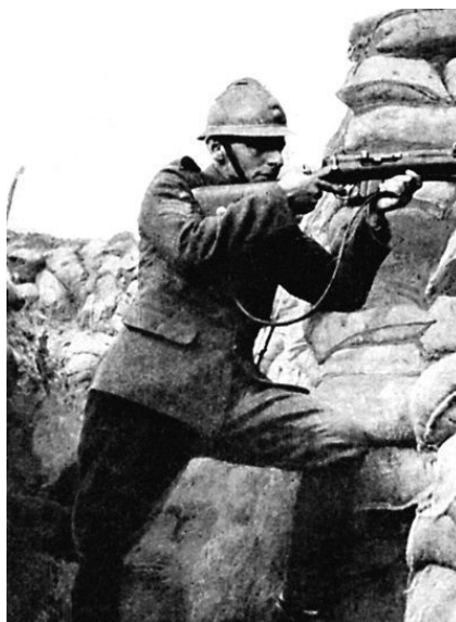
Французский снайпер поджидает жертву. 1916 г.

Во время Первой мировой войны, потребовавшей массовости специального оружия, почти всеми воюющими сторонами стали применяться линейные винтовки или охотничьи карабины, оснащенные оптикой. Из-за нехватки оптических прицелов часто в качестве снайперских брали обычные штатные винтовки, отобранные среди других как наиболее точные, даже без оптики. Во-первых, многие стрелки не считали реальным винтовочный огонь по одиночным целям, удаленным далее 300 ярдов (280 метров); во-вторых, магазинные винтовки начала века отличались высоким качеством изготовления, а следовательно, и точностью (кстати, неудивительно, что вооруженные такими винтовками буры во время Англо-бурской войны показали себя великолепными стрелками).