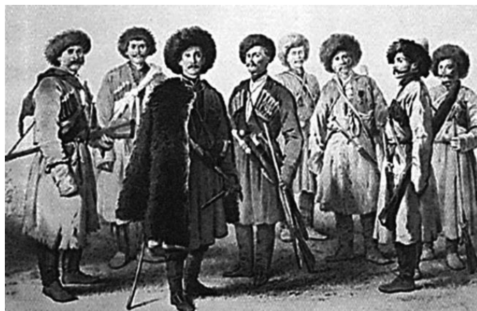
Пластуны. Россия, 1842 г.

Только в середине XIX века русская армия получила штатную 6-линейную пехотную винтовку образца 1856 года. Она, правда, как и раньше, предназначалась для оснащения только отборных стрелков, но все равно это был большой шаг вперед. Прицельная дальность винтовки – до 1200 шагов. Кстати, именно в 1856 году введено официальное название нарезного ружья – «винтовка».