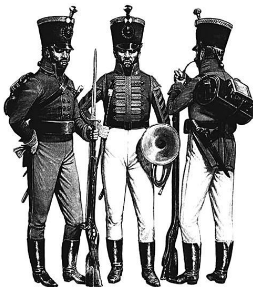
Егеря, вооруженные нарезными ружьями. Россия, XIX в.

Традиционно принято считать, что у истоков снайпинга стояли егерские подразделения, появившиеся в большинстве европейских армий в XVIII столетии. Действительно, егеря, в отличие от простых пехотинцев, обучались по особым программам, готовились к боевым действиям в рассыпном строю, учились воевать в одиночку. В ходе учений особое внимание уделялось точной стрельбе каждого стрелка в отдельности – в отличие от обычной пехотной тактики, где предусматривался залповый огонь всего подразделения.