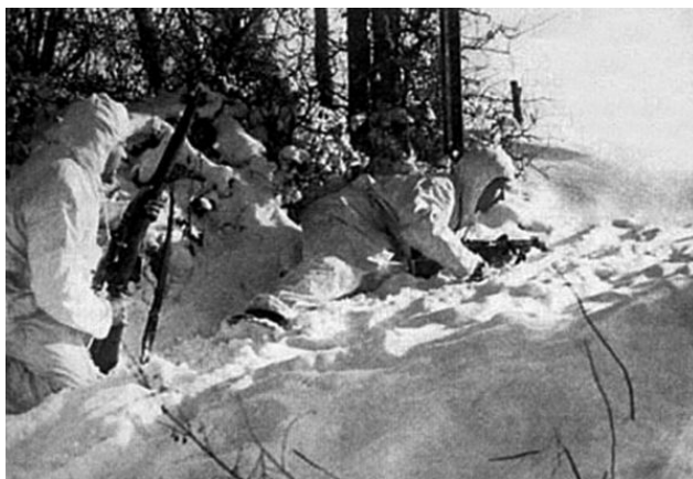
Финская снайперская пара на позиции. Карельский перешеек, 1940 г.

После подписания Версальского договора произошло то, что и должно было произойти: о снайперах попросту забыли. Упоминавшийся выше Невил Армстронг с горечью писал в 1940 году, т. е. уже после начала Второй мировой войны: «Люди, осуществившие в первые дни прошлой войны организацию, позднее известную как секция разведки батальона, лелеяли надежду, что после войны 1914–1918 годов не забудут о подготовке снайперов, разведчиков и наблюдателей. Однако среди стрелков в армии развилось пренебрежительное отношение к снайперам. Стрелки полагали, будто снайпинг только «феномен» времен позиционной войны и, очевидно, он больше не воскреснет. Снайпинг забывали. По мере того как проходили годы, телескопические прицелы исчезали из армии, и секция разведки батальона прекратила свое существование. Немногие знатоки и мастера обучения молодых солдат искусству разведки, использования местности и снайпинга вернулись после войны к своим мирным делам. Прошло 22 года, и снова «на полях Фландрии» мы сражаемся с тем же самым врагом. Снова жизни наших солдат принесены в жертву опытным снайперам немцев вследствие того, что мы не были готовы и забыли данный нам урок».