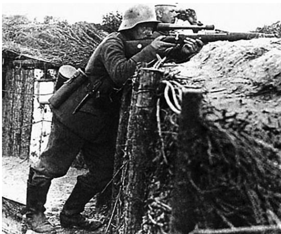
Германский снайпер в передовой траншее. Западный фронт, 1915 г.

Тем не менее подобное стрелковое мастерство пехоты стало практически бесполезным, когда в 1915 году расчет Германии на разгром и вывод Франции из войны потерпел провал (во многом благодаря наступлению русских войск в Восточной Пруссии и Галиции) и на Западном фронте стороны перешли к стратегической обороне. Активные боевые действия сменила позиционная борьба на стабильном сплошном фронте с вялыми и малорезультативными попытками сторон изменить положение.