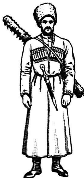
Казак-пластун Черноморского войска. Россия

...Что касается тактики пластуна – она сложная. Волчья пасть и лисий хвост – ее основные правила. В ней вседневную роль играют след – «сакма» и засада – «залога». Тот не годится «пластуновать», кто не умеет убрать за собой собственный след, задушить шум своих шагов в трескучем тростнике; кто не умеет поймать следы противника и в следах его прочесть направленный на линию удар. Где спорят обоюдная хитрость и отвага, где ни стой, ни с другой стороны не говорят: «Иду на вас!» – там нередко один раньше или позже схваченный след решает успех и неудачу. Перебравшись через Кубань, пластун исчезает. А когда по росистой траве или свежему снегу след неотвязно тянется за ним, он заплутывает его: прыгает на одной ноге и, повернувшись спиной к цели своего поиска, идет пятками наперед, «задкует» – хитрит, как старый заяц, и множеством известных ему способов отводит улику от своих переходов и притонов. Как оборотни сказок, что чудно-дивно меняют рост: в лесу вровень с лесом, в траве вровень с травой – пластуны мелкими партиями пробираются с линии между жилищами неприязненных горцев к нашим полевым за-кубанским укреплениям и оттуда на линию.