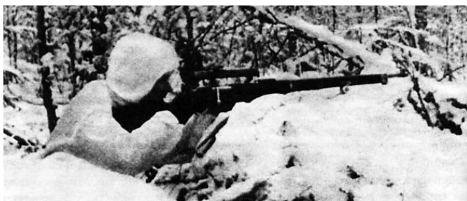
Зимняя маскировка снайпера

Во время финской войны советские командиры столкнулись с необъяснимым и страшным явлением – снайперами-«кукушками». Работа их была необычайно эффективна и признана наиболее результативной снайперской практикой. Боевая тактика снайперов-«кукушек» была непонятной своей нестандартностью, неуставностью и коварством. Финны первыми указали на то, что запрещенных приемов в снайперской практике нет. Приемам этим не было числа, и они мало повторяли друг друга.