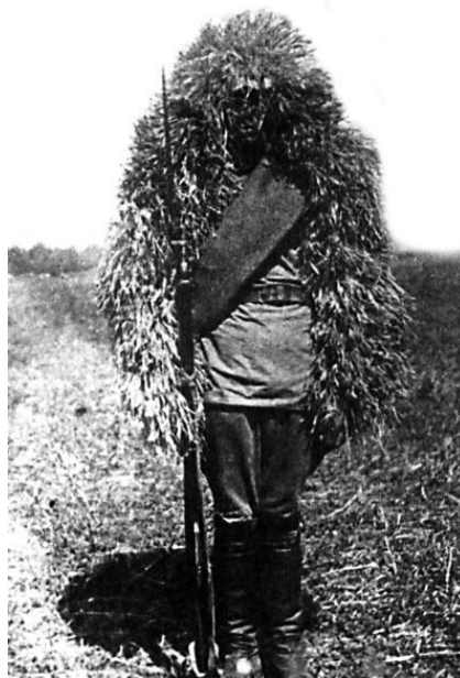
Маскировочная накидка». СССР, 1932 г.

К началу Великой Отечественной войны Красная Армия располагала значительными кадрами снайперов. Чувствительный урон, наносимый советскими снайперами, побудил немцев к производству в большом масштабе оптических прицелов и обучению снайперов.