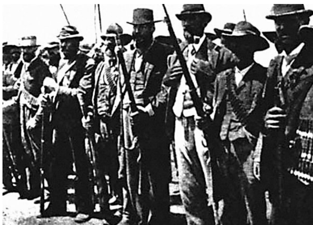
Бурские стрелки со своими дальнобойными винтовками. Южная Африка, 1900 г.

Британская армия, через три десятилетия после войны в США, потерпела ряд поражений в Южной Африке из-за меткой стрельбы буров, вооруженных новыми по тем временам магазинными винтовками Маузера. В ходе Англо-бурской войны (1899–1902) многочисленной и очень дисциплинированной английской армии долго не удавалось сломить сопротивление слабого, плохо организованного, но зато отлично стрелявшего противника – бурских полупартизанских отрядов.