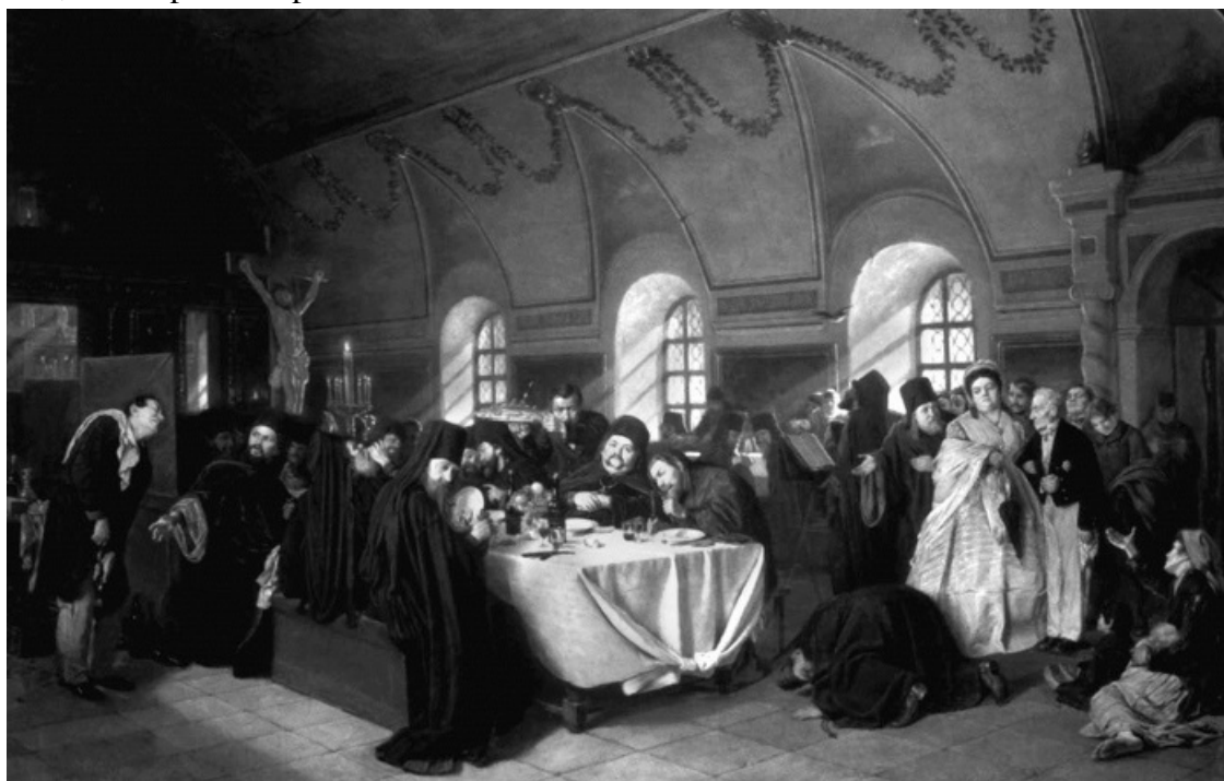
В. Перов «Монастырская трапеза»

Русское православие, которому русский народ обязан своим нравственным воспитанием, не ставило слишком высоких нравственных задач личности среднего русского человека, в нем была огромная нравственная снисходительность. Русскому человеку было прежде всего предъявлено требование смирения. В награду за добродетель смирения ему все давалось и все разрешалось. Смирение и было единственной формой дисциплины личности. Лучше смиренно грешить, чем гордо совершенствоваться.