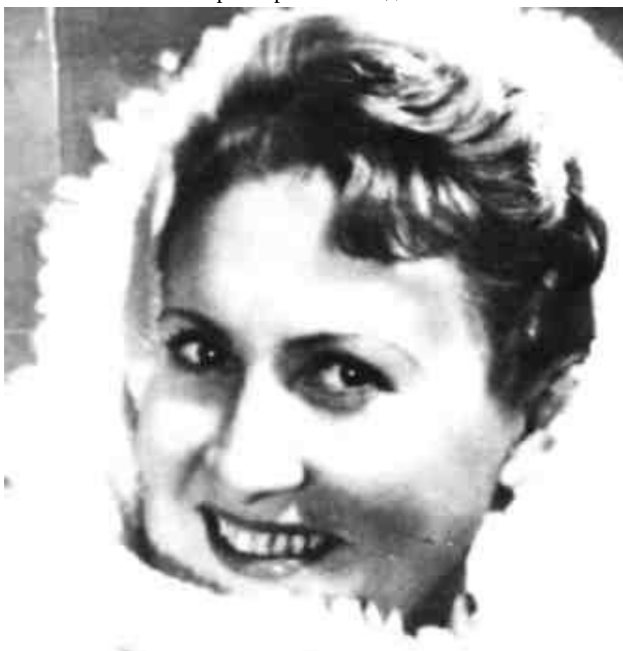
МОЯ КРАСИВАЯ МАМА

– Сколько же это всё стоит – прокат рояля и его доставка?