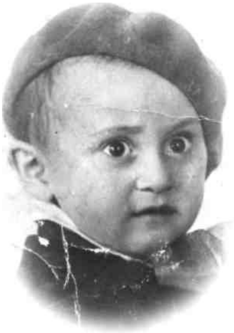
«ЧЕСТНОЕ СЛОВО. ЭТО – Я»