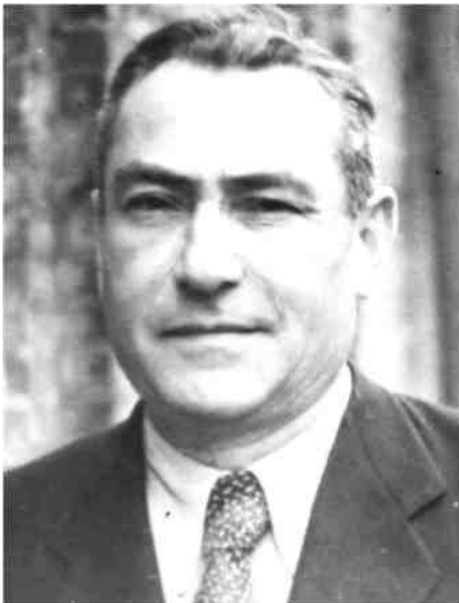
МОЙ ДОБРЫЙ ПАПА

Отец очень переживал, что мы остались без профессий, волновался, на что мы будем жить. Особенную тревогу у него вызывал я, человек без регулярной зарплаты. Когда стали приходить первые гонорары, папа очень недоверчиво воспринимал их, считая случайными, и ожидал, что вот-вот они закончатся, и я пойду на панель. Когда гонорары стали регулярными, и немалыми, когда появились первые книги, пошли первые спектакли по моим пьесам, отец перестал вслух высказывать свои опасения, охотно посещал все мои премьеры и творческие вечера, стал приносить мои книжки в парк и хвастать ими перед друзьями-пенсионерами. Но затаённое чувство тревоги, что всё это в любой момент может прекратиться, не покидало его до самой смерти.