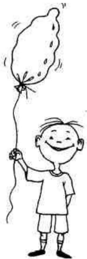
ФУТЛЯРЧИК ДЛЯ ОГУРЦОВ