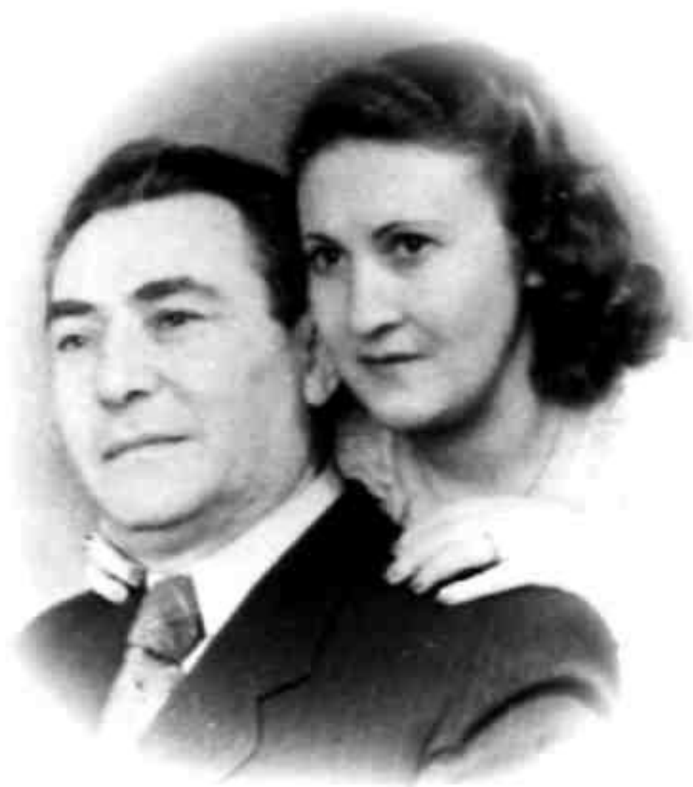
ОНИ БЫЛИ КРАСИВОЙ ПАРОЙ

спишь!» Папа нравился женщинам – вспоминаю, какие призывные взгляды бросали на него мамины подруги. Не сомневаюсь, что у него были романы на стороне, но он вёл себя осторожно, как минёр, и мама никогда об этом не знала. Когда я женился, он дал мне завет: