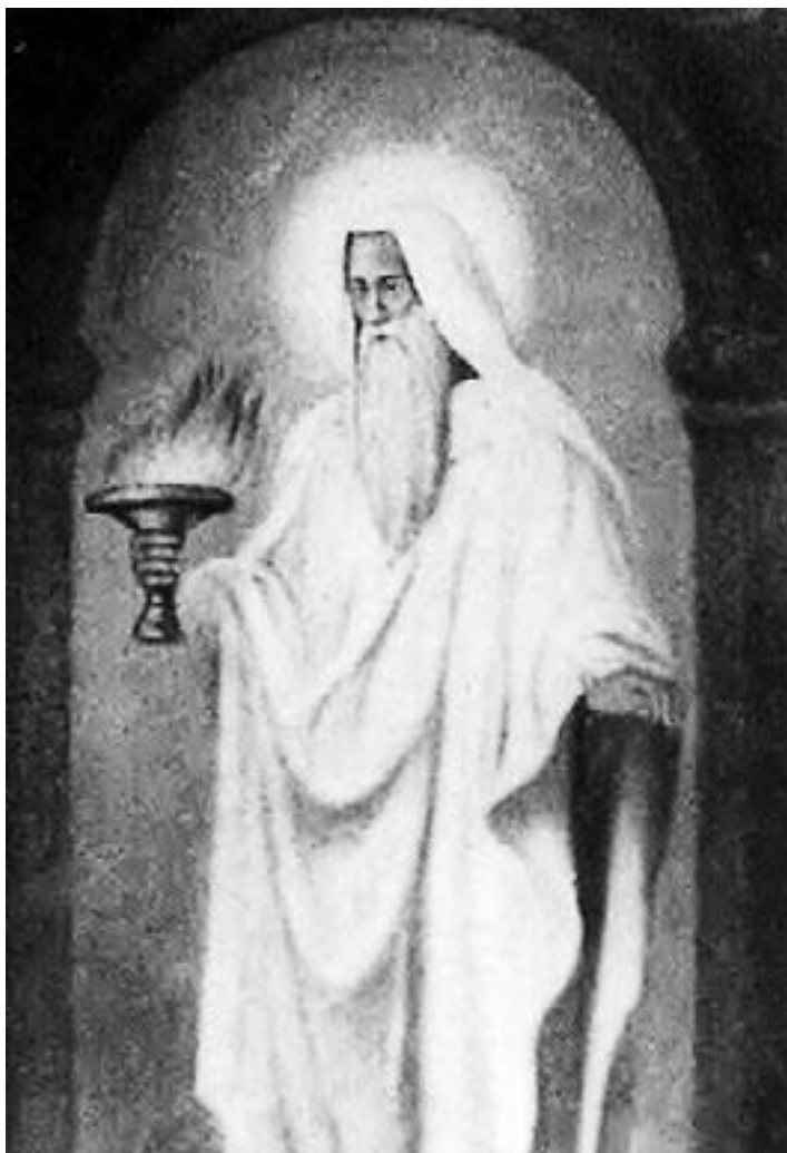
Зороастр – основатель религии древних персов – с пламенеющей чашей

В нартском эпосе упоминается легендарная чаша Амонга, предвещавшая счастливые или несчастливые события. В исламе чаша из бирюзы Джамы, в которую смотрят суфии, символизирует зеркало мира. В Индии мы находим представления о чаше с напитком бессмертия – Сомой или амритой (хаома в зороастризме, амброзия в Греции), утерянным даром богов, делающим человека сопричастным Вечности. Великой святыней считают верующие и чашу Будды, почитая ее как источник мудрости и силы, символ чистоты и возвышенных стремлений. Пламенеющая чаша отчеканена на древнееврейских серебряных шекелях времени Соломона и более древних. В тибетском буддизме Бодхисаттвы изображаются держащими чашу с языками пламени.