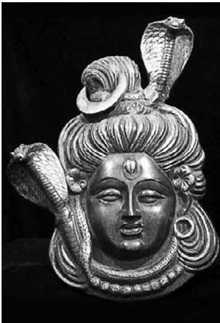
Голова индуистского бога Шивы с налобной жемчужиной