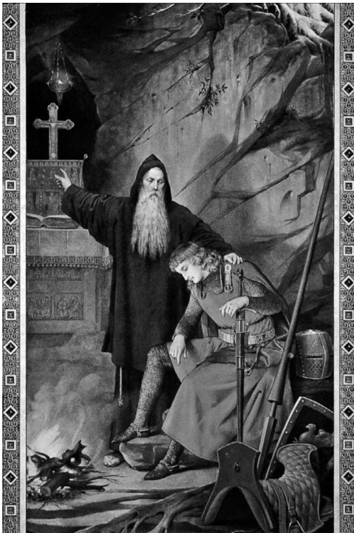
Отшельник Треврицент рассказывает Парцифалю о Святом Граале. Росписи в Зале певцов замка Нойшванштайн