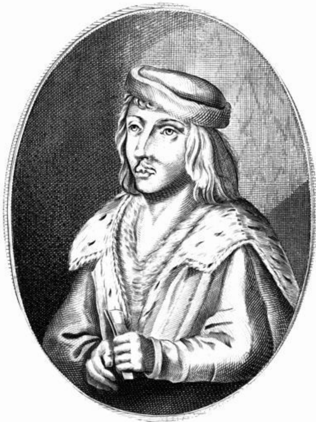
Иаков II Шотландский. Старинная гравюра

Переговоры шли долго. Когда четыре года назад Марию сосватали в первый раз, её отец заявил, что не может выплатить такое приданое, какое хотела бы сторона жениха, и брак не состоялся. На этот раз всё было серьезнее, и в феврале 1449 года к шотландскому двору отправились представители Бургундии, чтобы обсудить детали брачного контракта. Нам известно лишь, что отмечены эти переговоры были великолепным турниром в Штирлингском замке, где девятнадцатилетний Иаков II, несмотря на возраст, уже немало к тому повидавший в своей жизни, сражался против бургундского рыцаря. А сам брачный контракт был подписан 1 апреля. Помимо политического союза королевства Шотландия и двух герцогств, Бургундского и Гель-