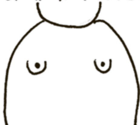
МНОГОШУМА ИЗ НИЧЕГО