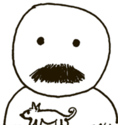
ГЕРАСИМ и МУМУ