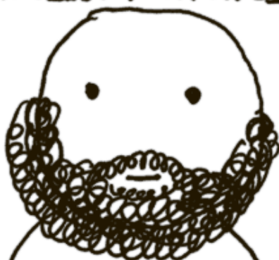
А ПРОПАДИ ВСЁ ПРОПАДОМ