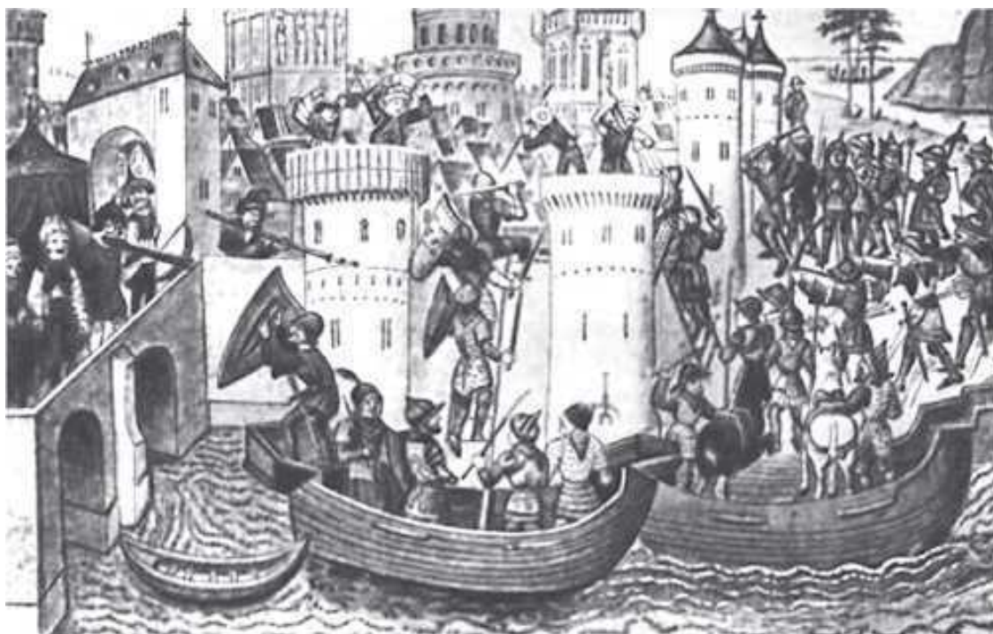
Взятие турецкими войсками Константинополя. Средневековая гравюра.

Византия же после этого «крестового похода» так и не смогла полностью восстановиться, а через два с половиной столетия закончила своё существование. Как пишут историки, – в результате захвата Константинополя турками.