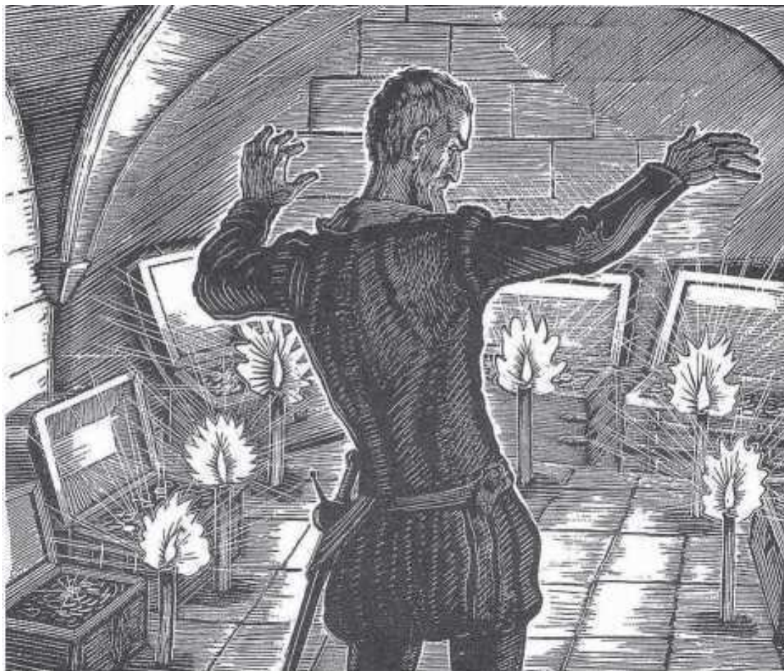
Гравюра В.Фаворского «Скупой рыцарь». Иллюстрация к «Маленьким трагедиям» А.С.Пушкина

В капиталистическом обществе роль денег иная: