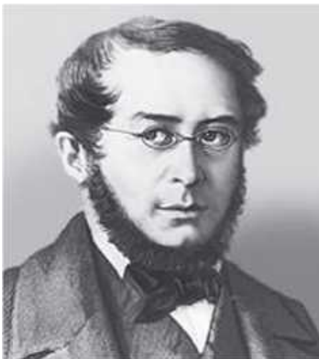
Пьер Жозеф Прудон

• эффективность обмана как способа неэквивалентного обмена напрямую зависит от умственных