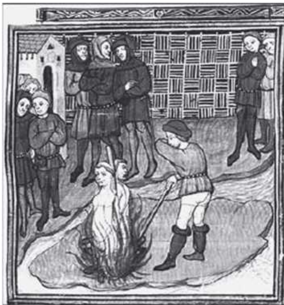
Казнь тамплиеров. Миниатюра из книги «Французские хроники Св. Дени»

Во-вторых, в католической Европе уже в X–XI вв. сложились своеобразные «оффшоры», в которых христианам разрешалось заниматься ростовщичеством. Речь идёт о таких городах-государствах Италии, как: Венеция, Генуя, Флоренция, Ломбардия, Сиена и Лука.