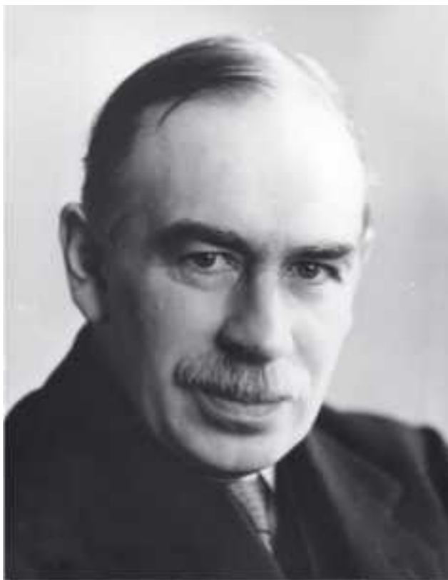
Джон Мейнард Кейнс

Известный английский экономист Джон Кейнс (1883–1946) также усматривал цикличность развития экономики в изменениях психологических настроений людей и использовал такие далёкие от точной науки понятия, как «склонность к сбережению», «склонность к инвестированию» и т. п. «Психологизм» Кейнса рельефно просматривается в главной его работе «Общая теория занятости, процента и денег».