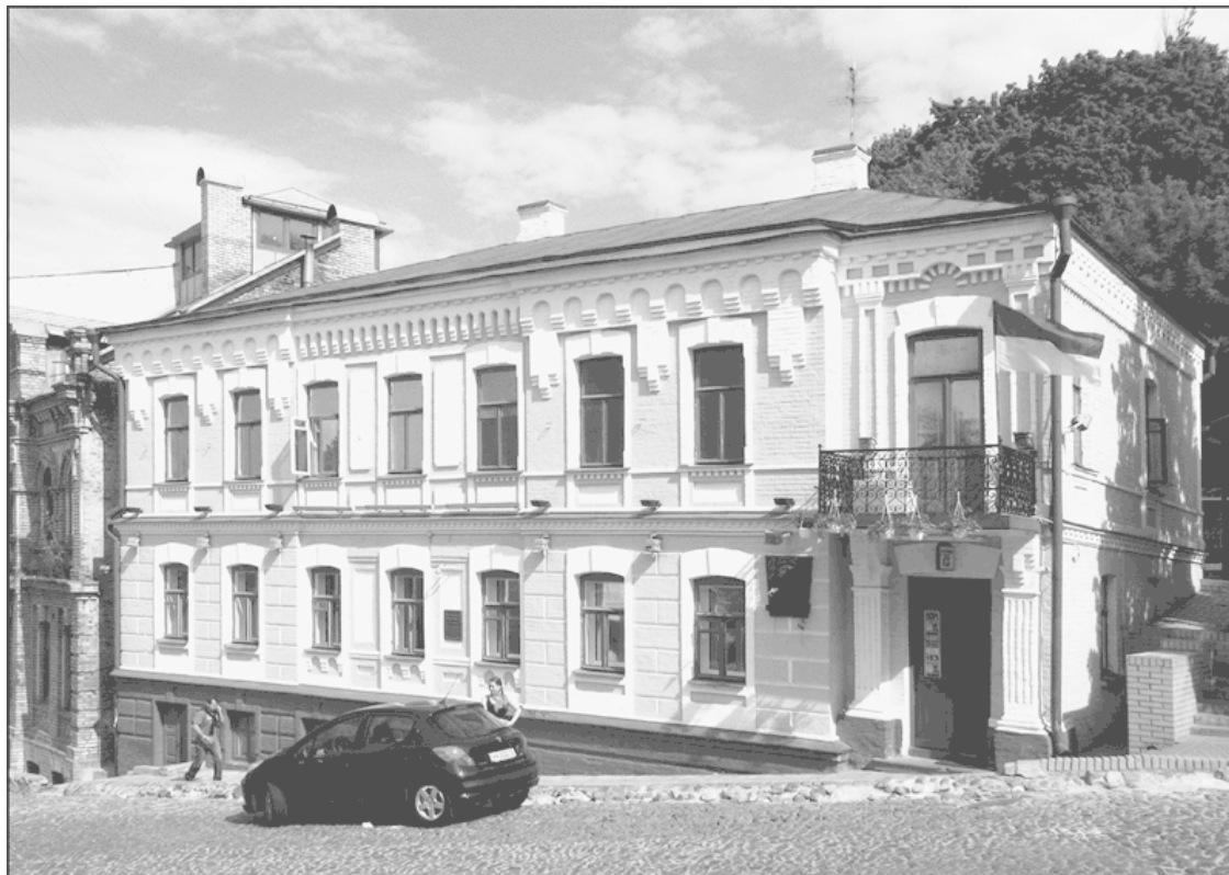
Дом № 13 по Андреевскому спуску.

у пышущей жаром изразцовой площади „Саардамский Плотник“, часы играли гавот, и всегда в конце декабря пахло хвоей, и разноцветный парафин горел на зеленых ветвях».