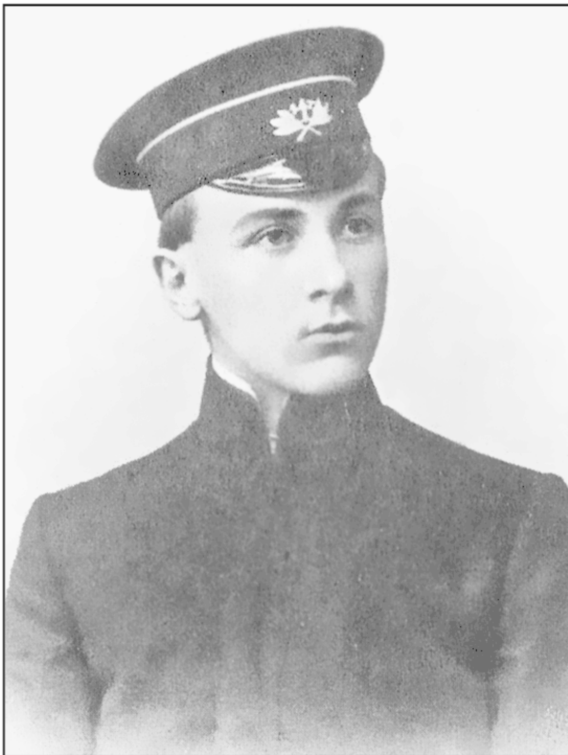
М. А. Булгаков в 1909 г.