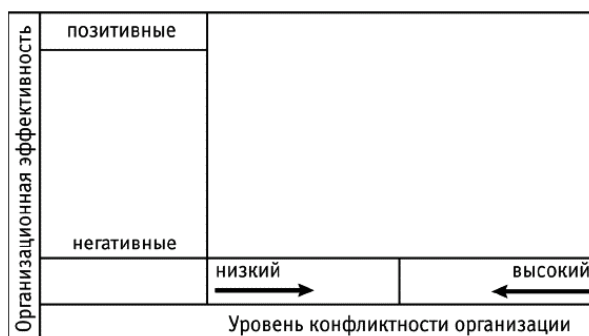
Рис. 1 Мера конфликтности (начало)

Ремарка. Большинство опрошенных сразу говорили, что высокий уровень конфликтности определяет низкую эффективность организации. Однако для многих было откровением, что низкая конфликтность имеет те же последствия: организация, в которой нет конфликтов, останавливается в развитии. И ключ здесь – в балансе позитивных и негативных последствий.