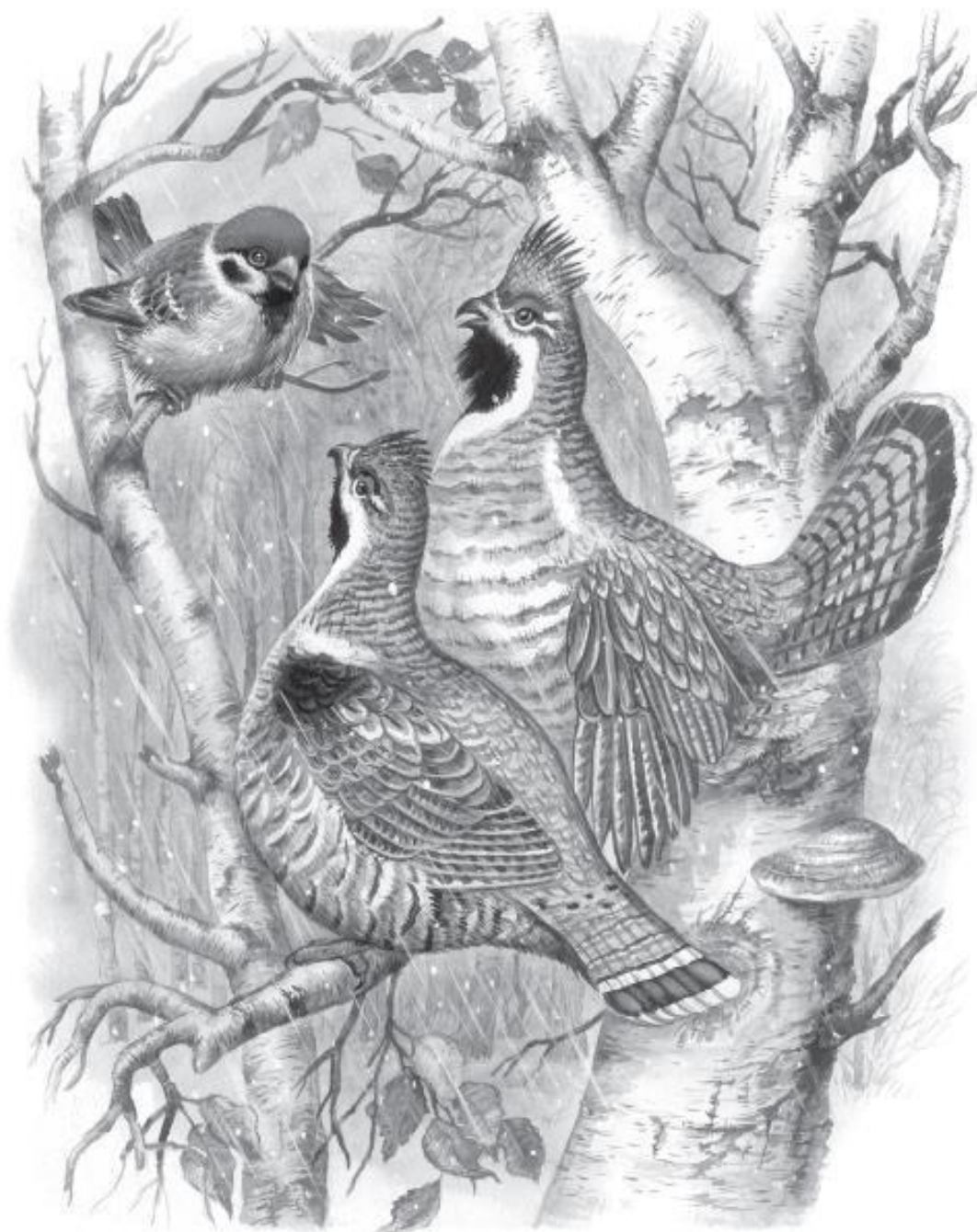
Рисунки И. Цыганкова.