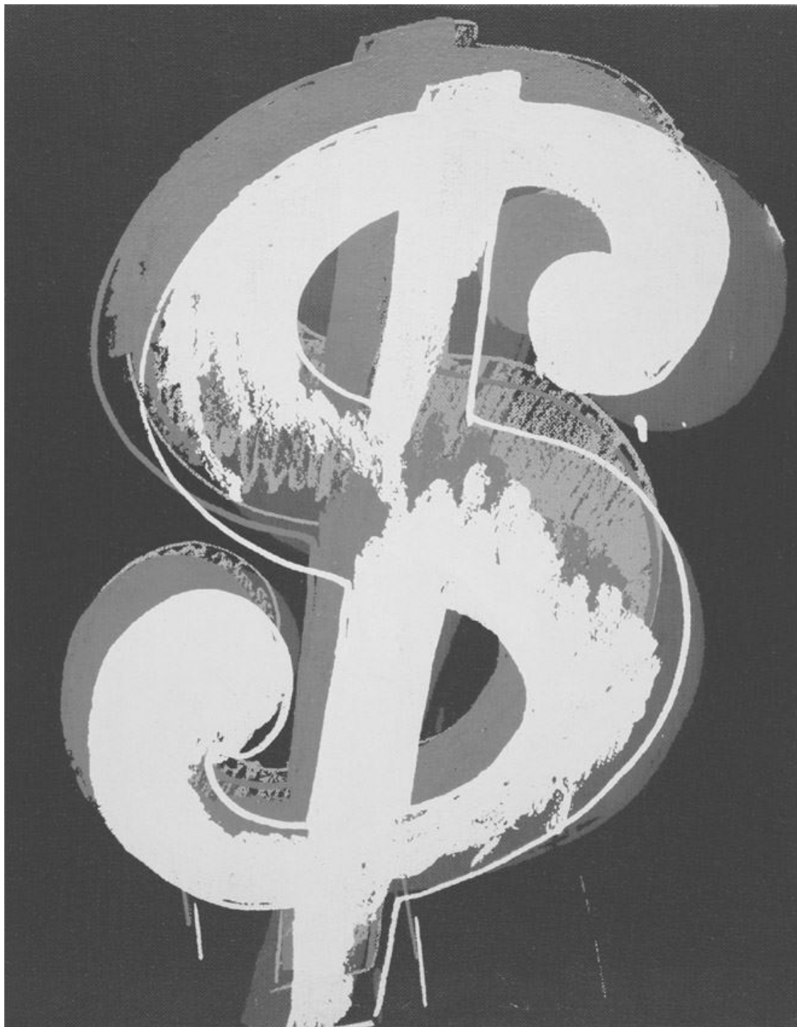
Энди Уорхол. Знак доллара, ок. 1981

Неслучайно крупнейшие, исторически сложившиеся центры художественного творчества – Венеция, Амстердам и Нью-Йорк – являются одновременно и крупнейшими рынками предметов искусства. Предприимчивого художника с той же силой тянет к деньгам, с какой любителя граффити влечет к еще не тронутой его кистью стене. Так было всегда.