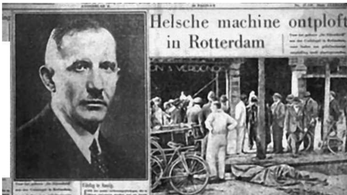
Публикация в немецкой газете посвященная гибели Коновальца