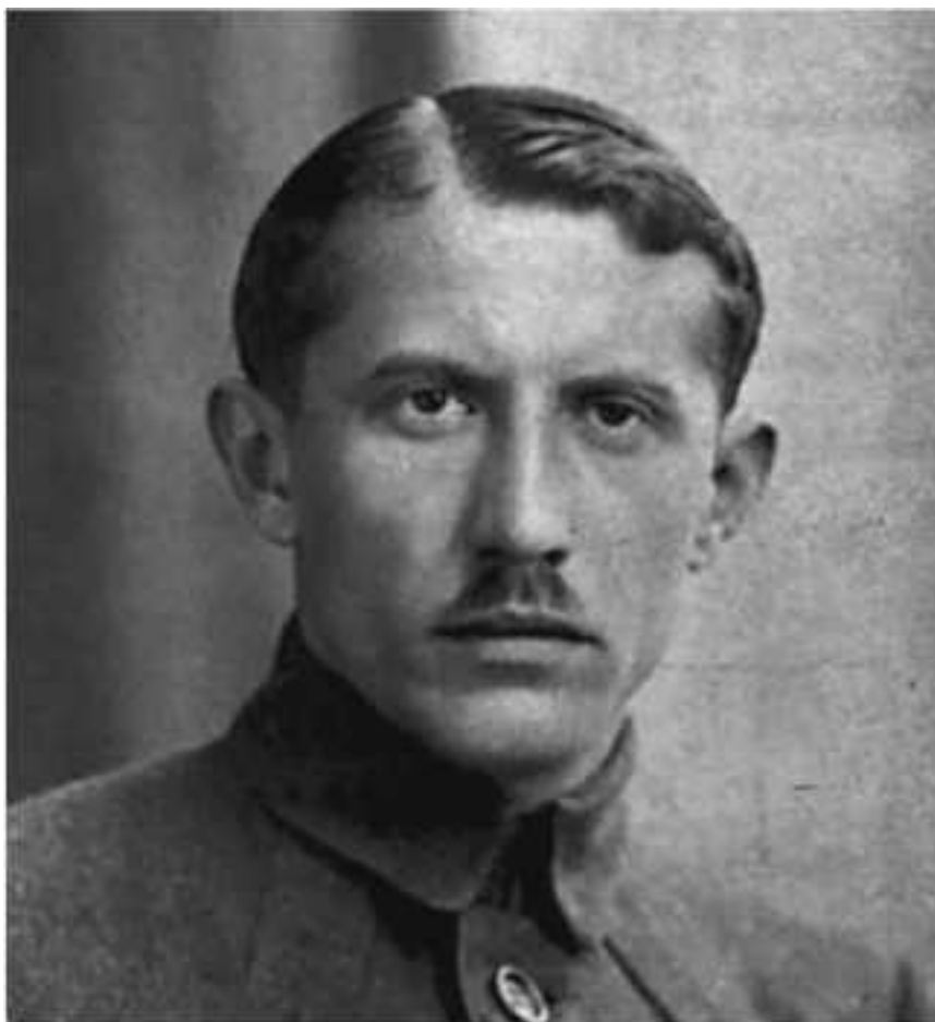
Евгений Михайлович Коновалец (1891 (1892?) – 1938) – видный деятель украинского националистического движения 1920 – 1938 годов