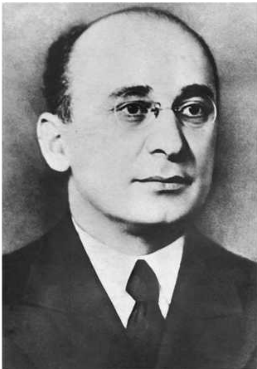
Лаврентий Павлович Берия (1899–1953) – в 1938–1945 годах – нарком внутренних дел СССР