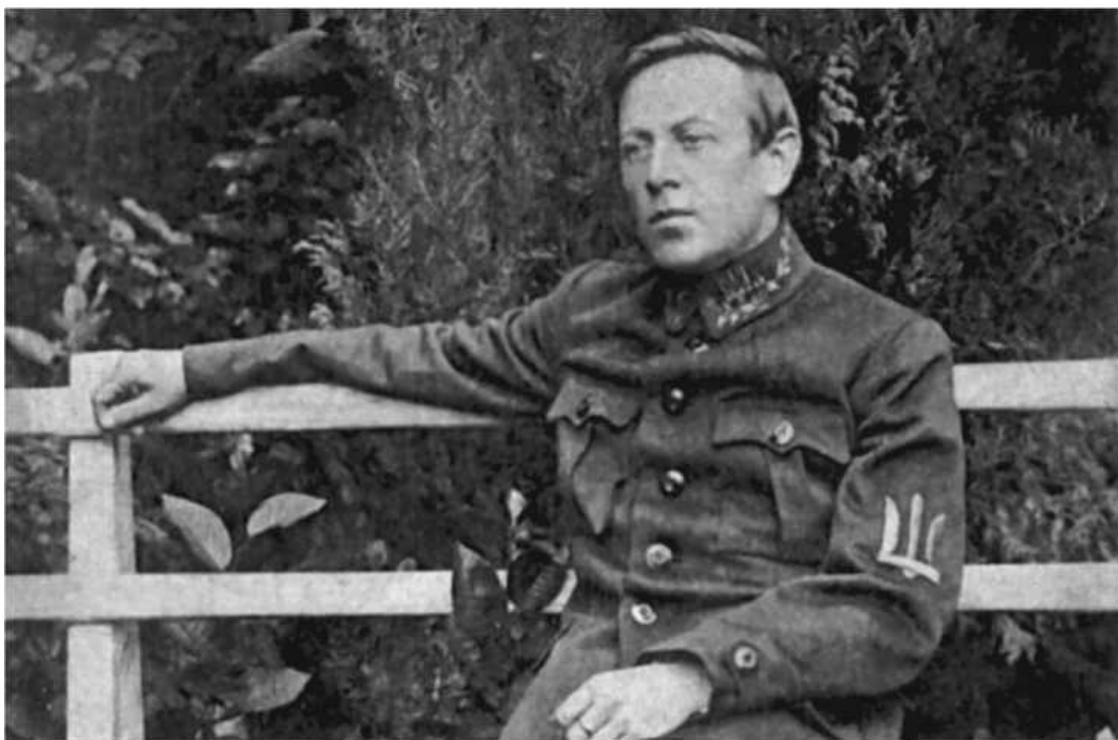
Симон Васильевич Петлюра (1879 – 1926) – украинский военный и политический деятель, глава Директории Украинской Народной Республики в 1919–1920 годах

В Особом отделе, понесшем тяжелые потери, срочно потребовался телефонист и шифровальщик. Так я был послан на работу в органы безопасности. Это и было началом моей службы в ВЧК-КГБ.