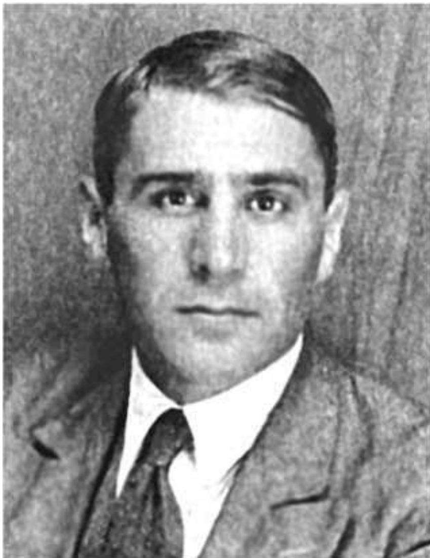
Павел Судоплатов. Фотография с загранпаспорта-прикрытия. Финляндия. 1935 год