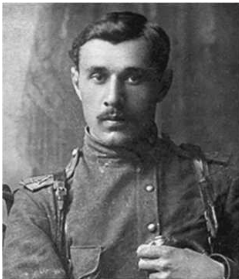
Николай Владимирович Скоблин (1893–1937) – штабс-капитан царской армии, деятель белого движения и агент НКВД

Скоблин бежал из Парижа в Испанию на самолете, заказанном для него Орловым (когда Орлов в 1938 году бежал, он сохранил золотое кольцо Скоблина в качестве доказательства своей причастности к этому делу). Сам Скоблин погиб во время воздушного налета на Барселону в период гражданской войны в Испании. Его женой была известная русская певица Надежда Плевицкая, поддерживавшая связь с НКВД. Она не подозревала, что Шпигельглас руководил операцией по захвату Миллера, и считала его другом своего мужа. Она только знала, что Шпигельглас («Дуглас») был связан с советскими представителями и поддерживал их материально. Ее арестовали во Франции за соучастие в похищении Миллера и приговорили к двадцати годам каторжных работ. Она умерла в тюрьме в 1944 году. Если бы Скоблин проводил эту операцию, как пишут некоторые «знатоки» истории нашей разведки, с ведома немцев, то Плевицкая была бы освобождена ими, или, во всяком случае, немцы обязательно попытались бы ее использовать, чтобы выйти на связи нашей разведки во Франции.