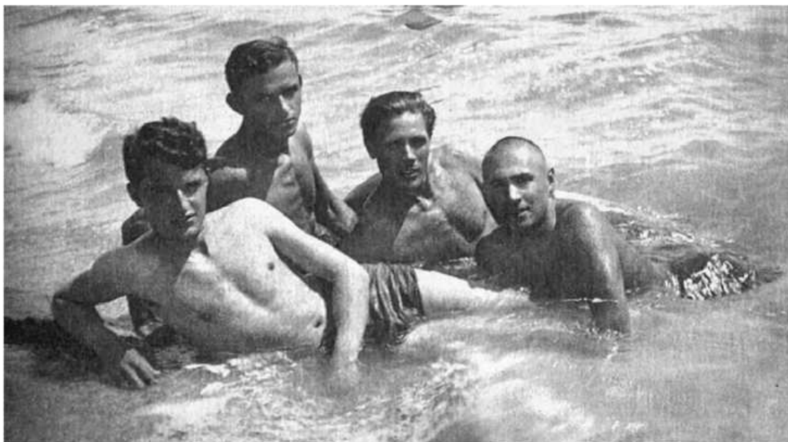
Будущие руководители советской разведки: Сергей Савченко (крайний слева) и Павел Судоплатов (крайний справа). Бердянск. 1928 год