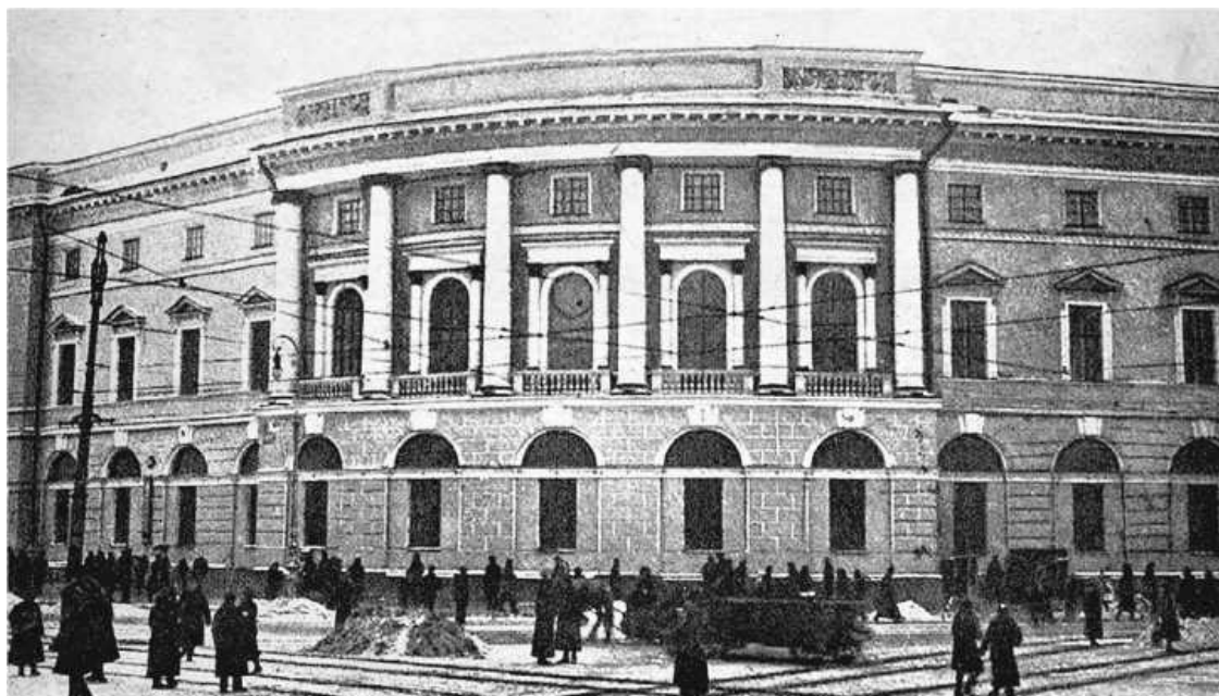
Государственная публичная библиотека им. Салтыкова-Щедрина. Ленинград. Начало тридцатых годов