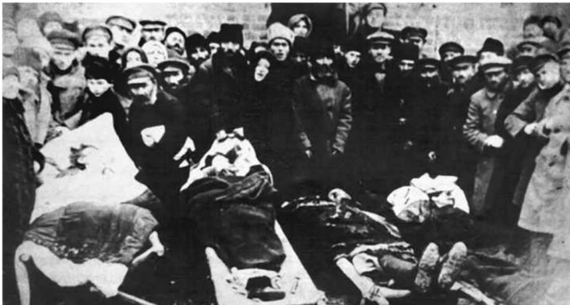
Жертвы петлюровского погрома 1919 года в Проскурове

Опыт, приобретенный при выполнении обязанностей телефониста, а затем шифровальщика, оказался полезным. Я печатал документы с грифом ««секретно», посылавшиеся командованию, и расшифровывал телеграммы, которые мы получали непосредственно от главы ВЧК Феликса Дзержинского из Москвы.