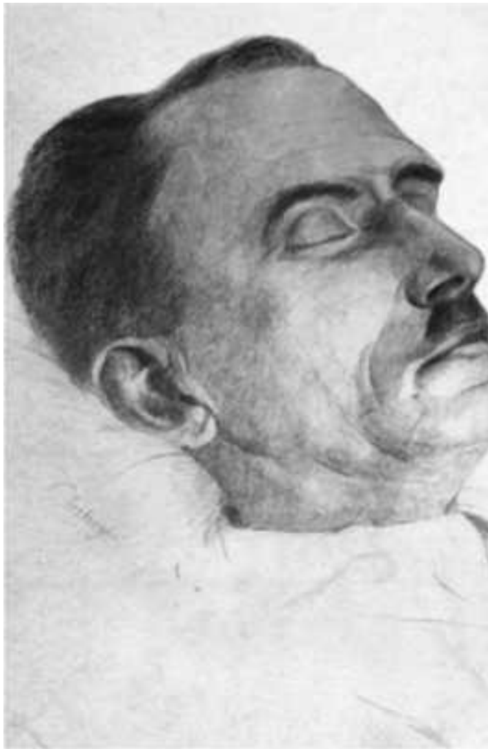
Посмертный портрет Евгения Коновальда. Автор К. Зибергер

23 мая 1938 года после прошедшего дождя погода была теплой и солнечной. Время без десяти двенадцать. Прогуливаясь по переулку возле ресторана «Атланта», я увидел сидящего за столиком у окна Коновальца, ожидавшего моего прихода. На сей раз он был один. Я вошел в ресторан, подсел к нему, и после непродолжительного разговора мы условились снова встретиться в центре Роттердама в 17.00. Я вручил ему подарок, коробку шоколадных конфет, и сказал, что мне сейчас надо возвращаться на судно.