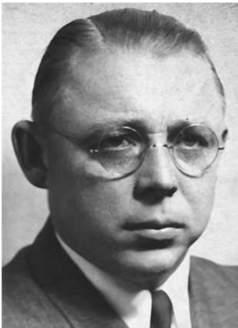
Василий Михайлович Зарубин (1894–1974) – легендарный советский разведчик, генерал-майор (9 июля 1945 года).

Весь 1937-й и часть 1938-го года я неоднократно выезжал на Запад в качестве курьера. Крышей для меня служила должность радиста на грузовом судне. Встретившись с Коновальцем, я ужаснулся, услышав, что ОУН передала немцам дезинформацию о том, что ряд командиров Красной Армии из числа украинцев – Федько, Дубовой и др. (позднее все они были ликвидированы Сталиным) – выражали свои симпатии делу украинских националистов. Люди Коновальца выдумывали подобные истории, чтобы произвести впечатление на немцев и получить от них как можно больше денег. Позднее мне довелось прочесть в украинской эмигрантской прессе, что такие красные командиры как Дубовой, Федько и ряд других якобы делили свою лояльность между советской властью и украинским национализмом. Коновалец решился сообщить мне об этом, поскольку знал, что как организатор украинского подполья я смогу узнать правду.