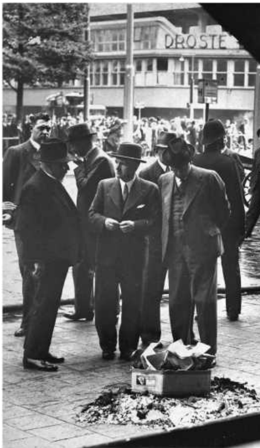
Остатки «адской машины», с помощью которой убили Евгения Коновальца