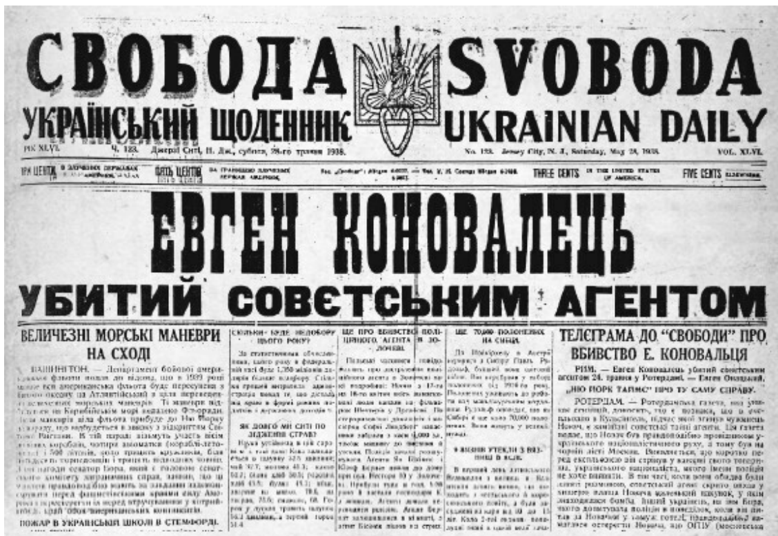
Публикация в издававшейся в США газете украинских эмигрантов о смерти Коновальца. 28 мая 1938 года