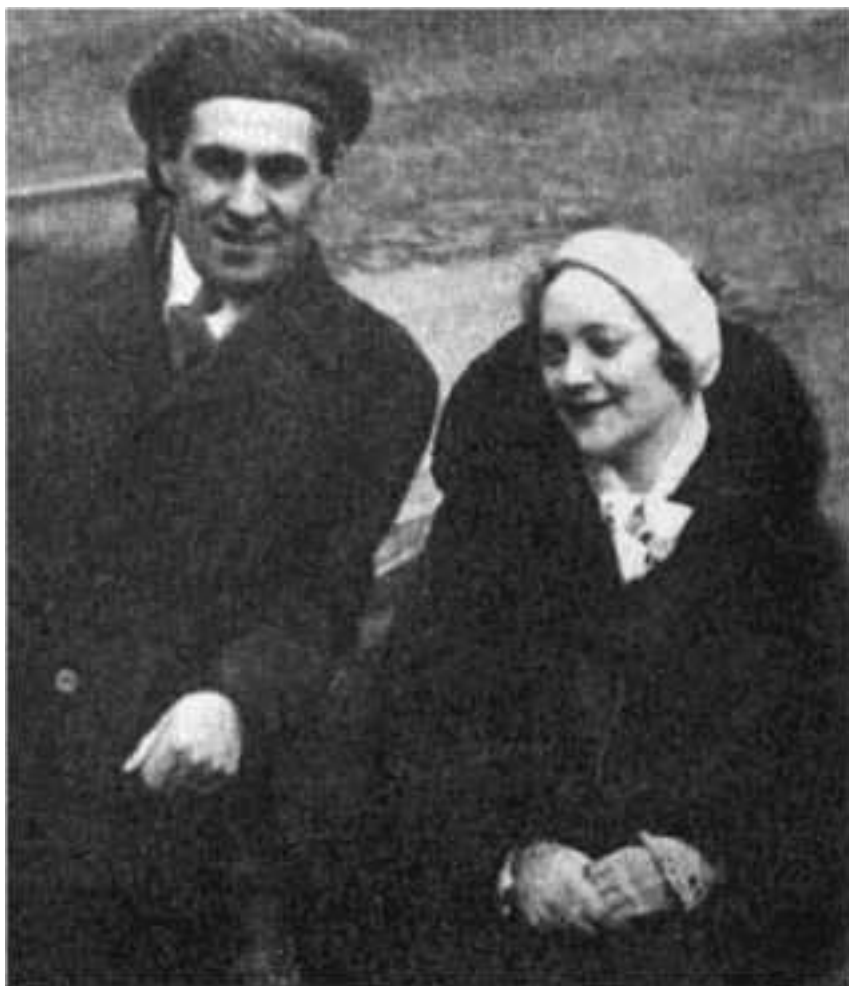
Павел Судоплатов с женой. 1935 год

Однако чем больше я думал об этом предложении, тем более заманчивым оно мне представлялось. И я согласился. После чего сразу приступил к интенсивному изучению немецкого языка – занятия проходили на явочной квартире пять раз в неделю. Опытные инструкторы обучали меня также приемам рукопашного боя и владению оружием. Исключительно полезными для меня были встречи с заместителем начальника Иностранного отдела ОГПУ – НКВД Шпигельгласом. У него был большой опыт работы за границей в качестве нелегала – в Китае и Западной Европе. В начале 30-х годов в Париже «крышей» ему служил рыбный магазин, специализировавшийся на продаже омаров, расположенный возле Монмартра.