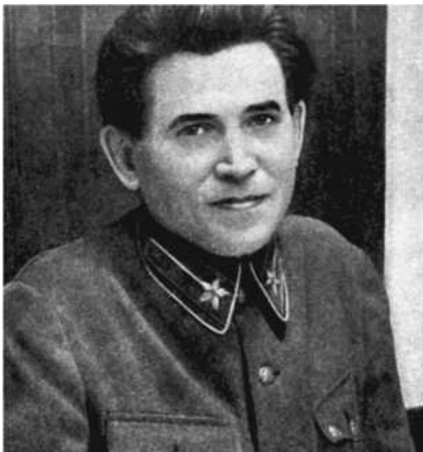
Николай Иванович Ежов (1895–1940). В 1936–1938 годах – народный комиссар внутренних дел

В ноябре 1937 года, после празднования двадцатилетия Октябрьской революции, я был вызван вместе со Слуцким к Ежову, тогдашнему наркому внутренних дел. Я встретился с ним впервые, и меня буквально поразила его неказистая внешность. Вопросы, которые он задавал, касались самых элементарных для любого разведчика вещей и звучали некомпетентно. Чувствовалось, что он не знает самих основ работы с источниками информации. Более того, похоже, что его вообще не интересовали раздоры внутри организации украинских эмигрантов. Между тем Ежов был и народным комиссаром внутренних дел, и секретарем Центрального комитета партии. Я искренне считал, что просто не в состоянии оценить те интеллектуальные качества, которые позволили этому человеку занять столь высокие посты. Хотя к этому времени я и был уже весьма опытным профессионалом в разведслужбе, но в том, что касалось карьеры в высших эшелонах власти, оставался наивным человеком: ведь те руководители, с которыми я сталкивался до сих пор, такие как Косиор и Петровский, возглавлявшие компартию Украины, были высокоинтеллектуальными людьми с широким кругозором.