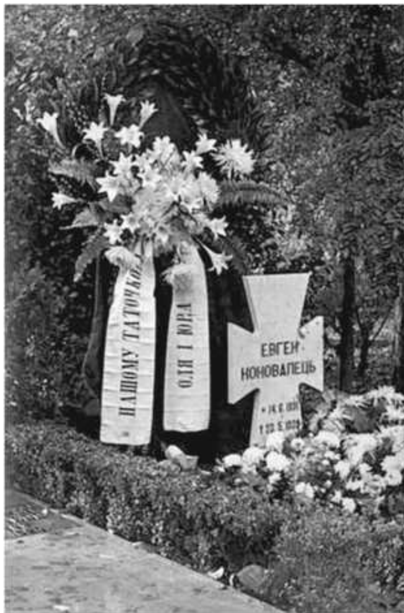
Временный памятник на могиле Евгения Коновальца на кладбище Кросвейк. Роттердам

Уходя, я положил коробку на столик рядом с ним. Мы пожали друг другу руки, и я вышел, сдерживая свое инстинктивное желание тут же броситься бежать.