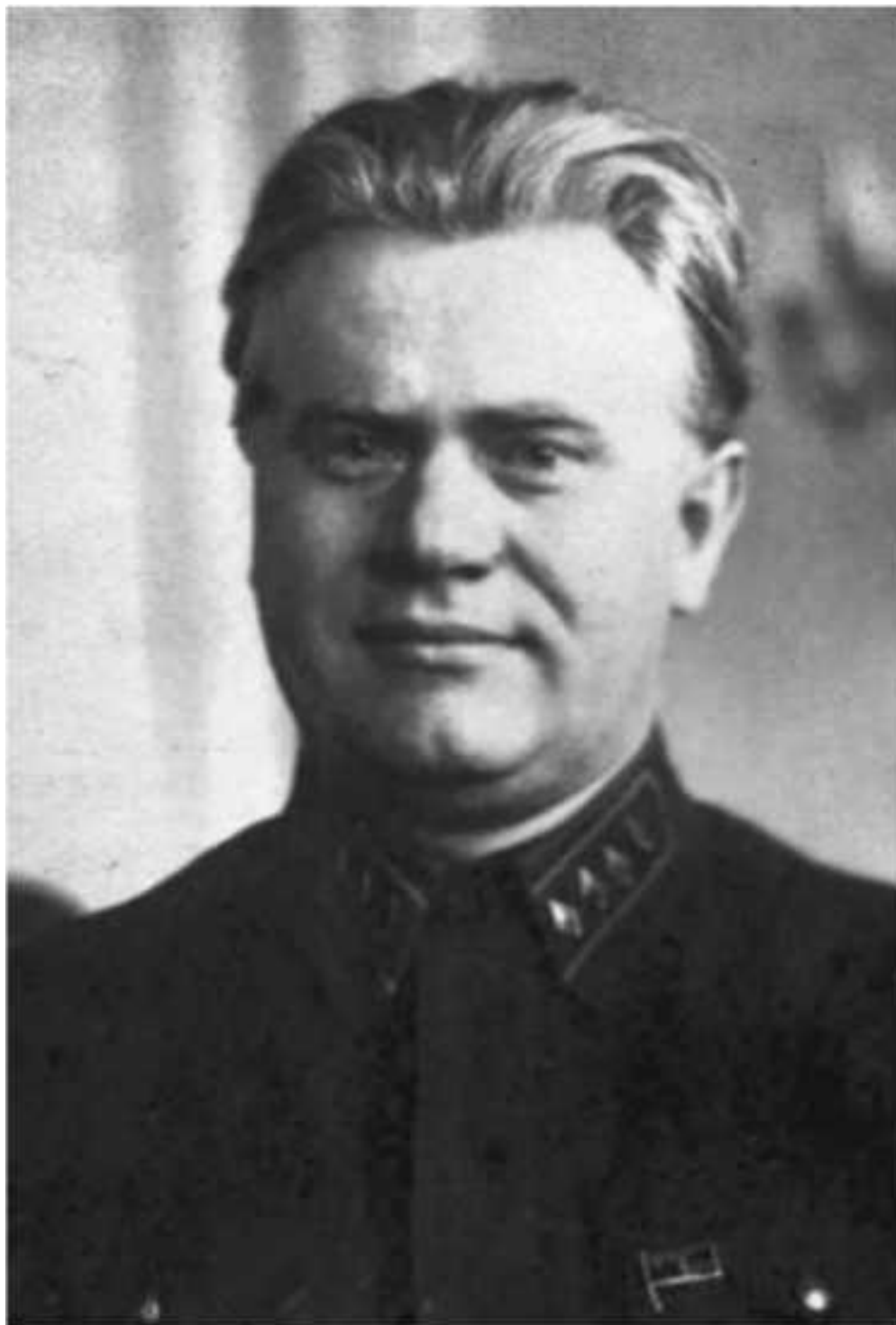
Всеволод Аполлонович Балицкий (1892–1937) – деятель ВЧК-ОГПУ-НКВД, комиссар государственной безопасности 1 ранга (26.11.1935).

В 1933 году глава украинского ГПУ Балицкий был назначен заместителем председателя общесоюзного ОГПУ. Переезжая в Москву на новую работу, он взял с собой нескольких сотрудников, в том числе и меня. Я получил в управлении кадров центрального аппарата госбезопасности должность старшего инспектора, курировавшего перемещения по службе и новые назначения в Иностранном отделе (закордонной разведке) ОГПУ.