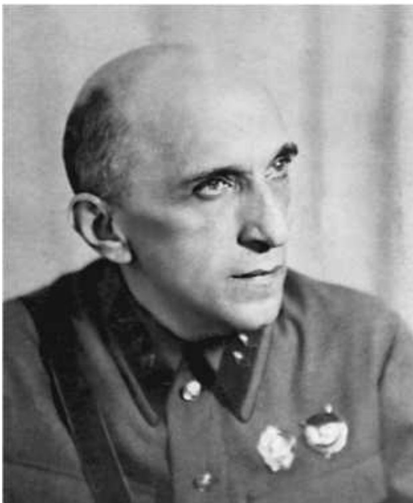
Яков Исаакович Серебрянский (1891–1956) – старший майор ГБ (1935), руководитель Спецгруппы особого назначения (СГОН) при НКВД СССР, сотрудник Иностранного отдела ОГПУ- НКВД. 1941 год