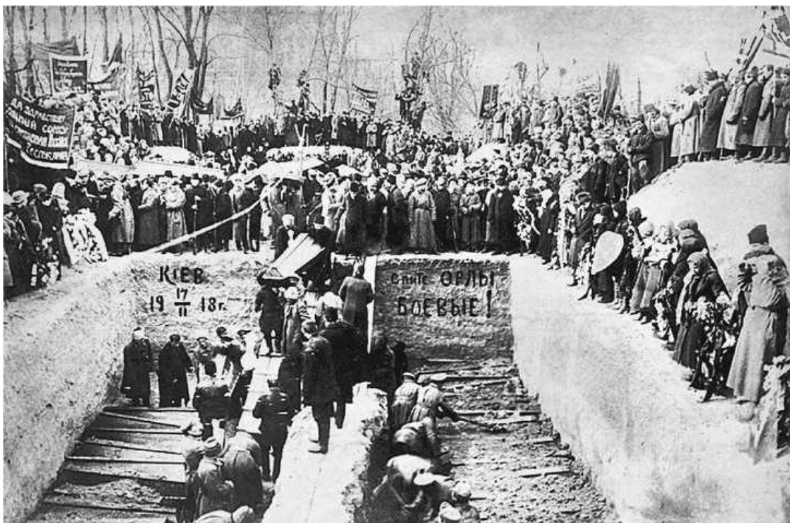
Похороны участников Январского восстания. Киев, 17 февраля 1918 года

Сталин попросил Петровского высказаться. Тот торжественно объявил, что на Украине Коновалец заочно приговорен к смертной казни за тяжчайшие преступления против украинского пролетариата: он отдал приказ и лично руководил казнью революционных рабочих киевского «Арсенала» в январе 1918 года.