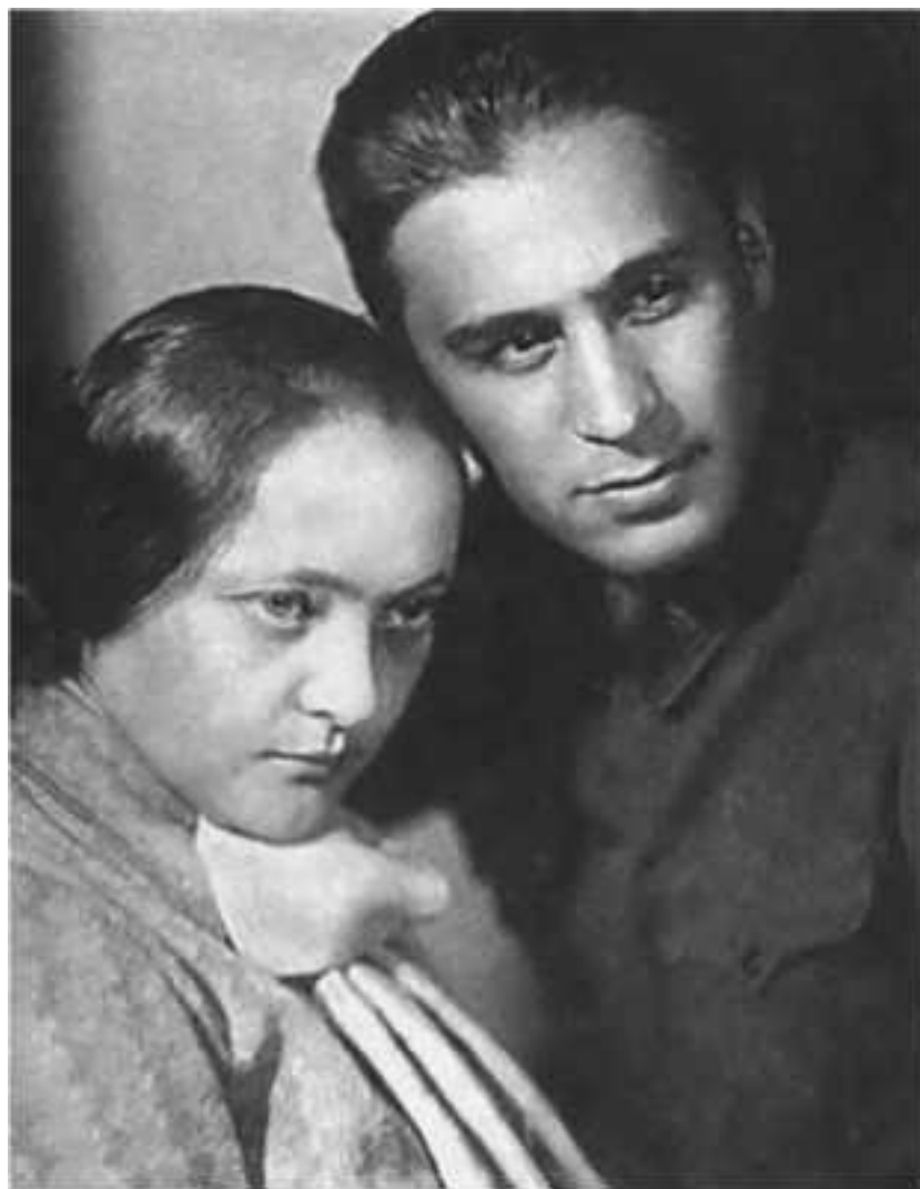
Павел Судоплатов с супругой

В 1941 году Эйтингон был направлен в Турцию и пробыл там почти весь 1942 год под именем Леонида Наумова. Там он готовил покушение на Франца фон Папена, тогдашнего германского посла в Турции. По слухам, фон Папен должен был возглавить правительство Германии в случае отстранения Гитлера от власти генералами вермахта. Это открывало путь к сепаратному миру между Германией, Англией и США. Попытка покушения оказалась неудачной – наш агент-болгарин нервничал, и бомба взорвалась раньше времени у него в руках. В результате сам он погиб, а фон Папен отделался лишь легкими царапинами.