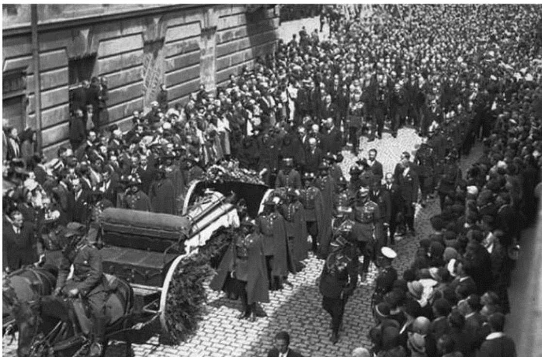
Похороны Бронислава Перацкого в Варшав

Особенно тревожили террористические связи этой организации, в частности, договоренность с хорватскими националистами и участие в убийстве югославского короля Александра и министра иностранных дел Франции Луи Барту. Для меня было открытием, что все эти террористы финансируются абвером – разведывательной и контрразведывательной службой вермахта. Полной неожиданностью явилась для меня и новость, что убийство польского министра генерала Перацкого в 1934 году украинским террористом Мацейко было проведено вопреки приказу Коновальца, и стоял за этим Бандера, соперничавший с последним за власть. Бандера стремился к контролю над организацией, играя на естественной неприязни украинцев к Перацкому, который нес ответственность за репрессии против украинского меньшинства в Польше. Коновалец рассказал мне, что к этому времени между Польшей и Германией был подписан договор о дружбе, так что немцев никоим образом не устраивали любые враждебные акции по отношению к полякам. Они были так взбешены, что выдали Бандеру, скрывавшегося в Германии. Убийца генерала, Мацейко, сумел скрыться.