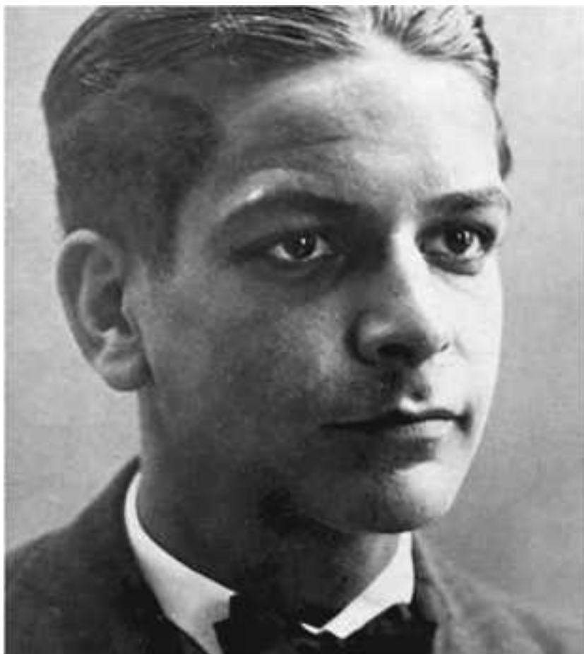
Рамон Меркадер (1913–1978) в юности

Во время пребывания в Барселоне я впервые встретился с Рамоном Меркадером дель Рио, молоденьким лейтенантом, только что возвратившимся после выполнения партизанского задания в тылу франкистов. Обаятельный молодой человек – в ту пору ему исполнилось всего двадцать лет. Его старший брат, как мне рассказали, героически погиб в бою: обвязав себя гранатами, он бросился под немецкий танк, прорвавшийся к позициям республиканцев. Их мать Каридад также пользовалась большим уважением в партизанском подполье республиканцев, показывая чудеса храбрости в боевых операциях. Тогда я и не подозревал, какое будущее уготовано Меркадеру: ведь ему было суждено ликвидировать Троцкого, причем операцией этой должен был руководить именно я.