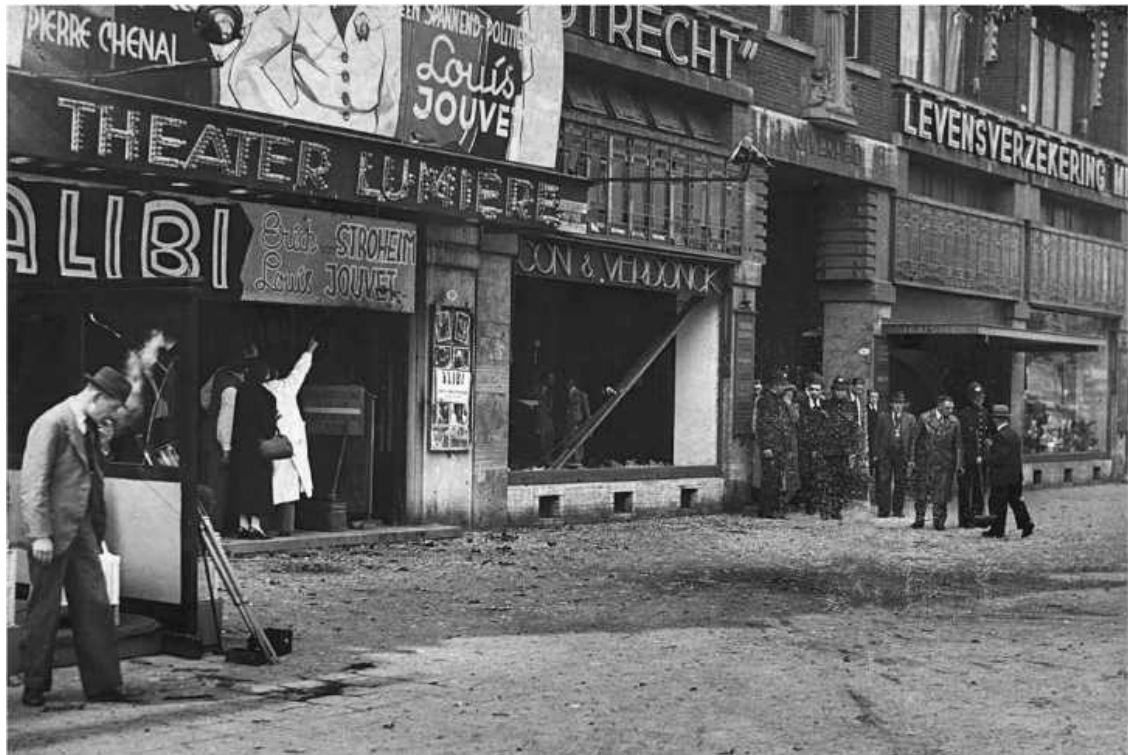
Разгромленная взрывом улица Колсингель, где произошло убийство