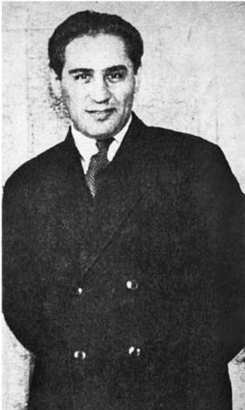
Павел Судоплатов в Берлине. 1935 год