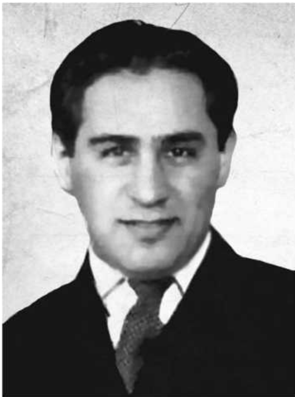
Павел Судоплатов Весна 1938 года