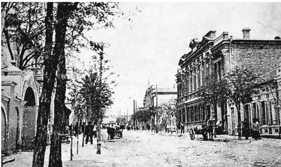
Мелитополь. Начало XX века

Я родился в 1907 году на Украине, в городе Мелитополе, расположенном в богатом фруктами регионе и в то время насчитывавшем около двадцати тысяч жителей. Мать у меня русская, а украинцем был мой отец – разнорабочий, пекарь, булочник, повар, официант. Как и всех детей – а нас в семье было пятеро, – меня крестили в русской православной церкви на день Петра и Павла. Мое начальное образование включало в себя изучение Нового и Ветхого Завета и основ русского языка, поскольку в царское время преподавание украинского в школах запрещалось. Пользовались им лишь в качестве разговорного. До десяти лет, пока не умер отец, у меня было самое обычное детство. После его смерти заботы о семье легли на плечи матери и старшей сестры. В год смерти отца произошла революция, власть взяли большевики.