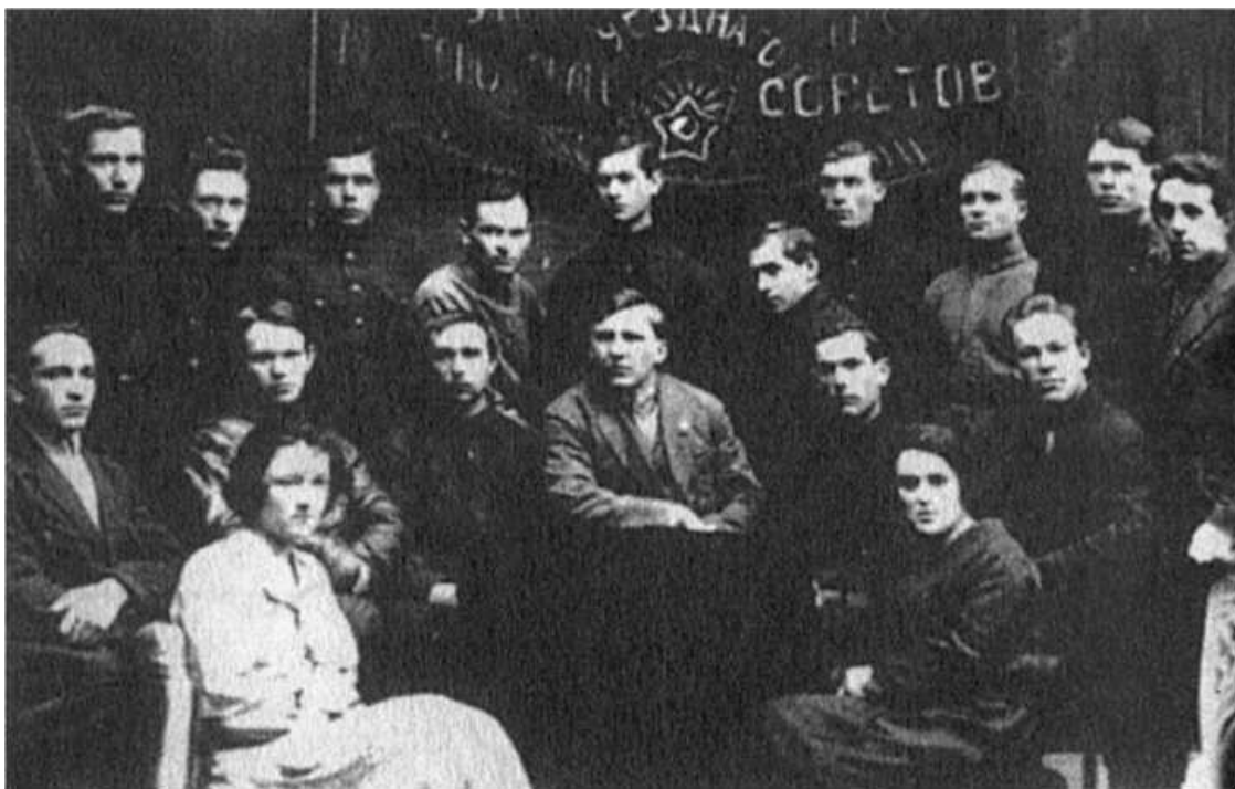
Сотрудники окружного отдела ГПУ города Мелитополя. В верхнем ряду – Павел Судоплатов. 1925 год