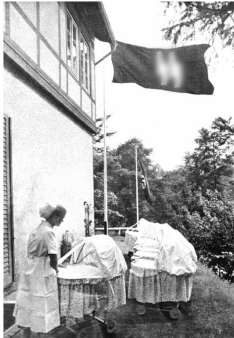
Родильный дом Лебенсборн

истинных арийцев. Также Лебенсборн включал в себя сеть детских домов, куда свозили отобранных пленных младенцев.