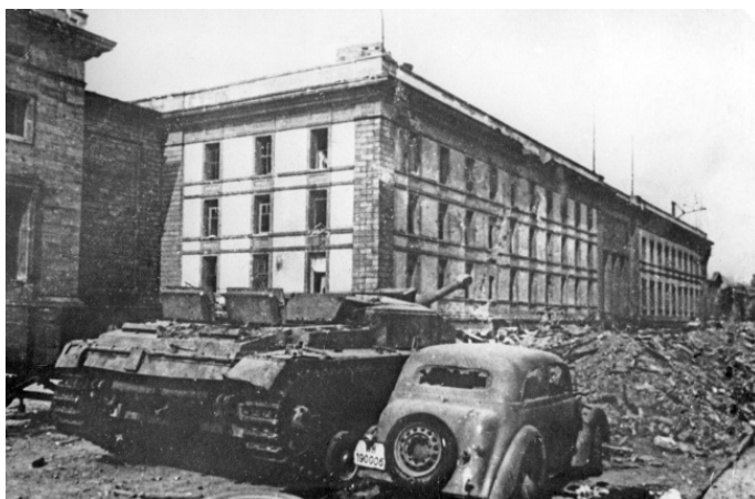
Бункер Гитлева в Берлине

Хойзерман вспоминает, что в здании рейхсканцелярии у профессора Блажки был маленький кабинет. И там должны оставаться стоматологические карты Гитлера. Нужные документы оказались на месте.