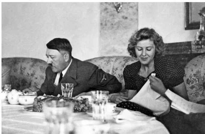
Гитлер и Ева Браун