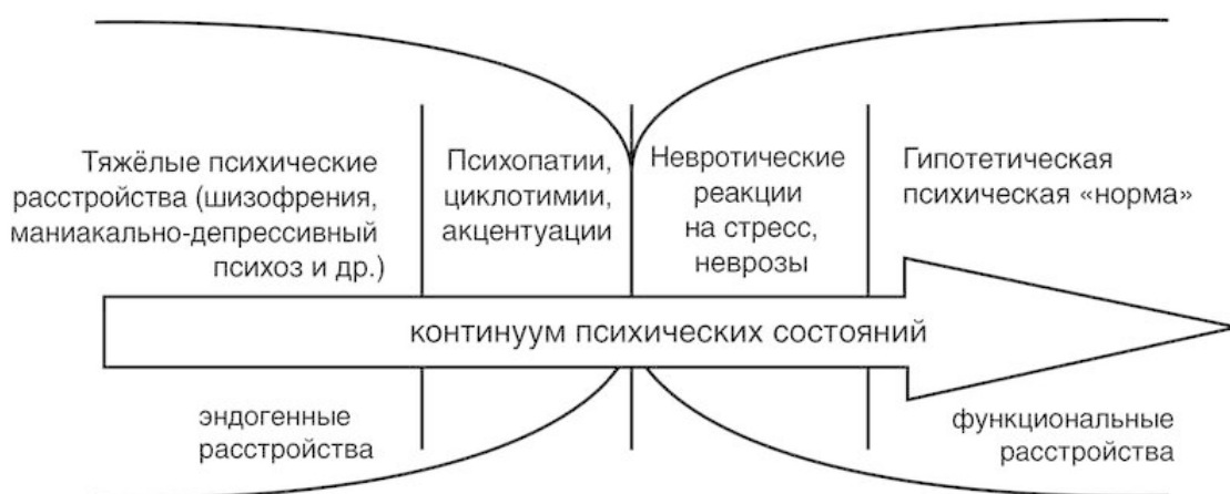
Рис. № 2. Схема эндогенных и функциональных психических расстройств

• Те же, что примыкают к правой части оси, называются «функциональными», то есть предполагается, что человек, в целом, нормален, просто у него под воздействием обстоятельств что-то сбилось в настройках (нарушена психическая «функция», а не организация системы).