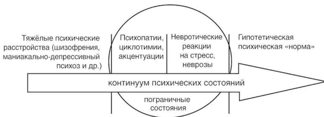
Рис. № 1. Схема континуума психических состояний

Должен сказать, что неспециалист, скорее всего, даже не заметит разницы между пограничными расстройствами, находящимися справа и слева от центра этой нашей воображаемой оси психических состояний.