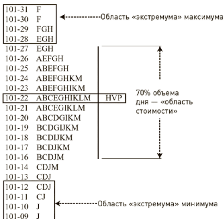
Рис. В. 1. День с нормальным распределением

Типы трейдеров. Во время торговых дней с нормальным распределением средний трейдер торгует в основном примерно в середине области стоимости, немного выигрывая и немного проигрывая — как правило, работая в ноль. Мой наставник как-то назвал таких трейдерами «из дядюшкиной фирмы». Он объяснил это тем, что их нельзя уволить из-за кровного родства. Однако это же родство является причиной, по которой они не могут расти в должности внутри фирмы.