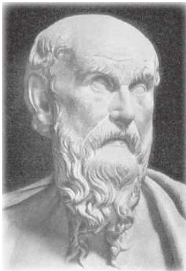
Гесиод (?) (ок. VIII в. до н. э.). Копия эпохи Клавдия с бронзовой статуи ок. 200 до н. э.

Начать эту книгу я бы хотела фразой, которой Аниела Яффе в 1958 г. закончила свой труд «Явления духов и предзнаменования»: такие феномены приближают нас к «ощущению единства бытия». Они символически связывают потусторонний мир и мир реальный, невидимое и видимое, нематериальное и материальное, синхронное и асинхронное, мнимое и явное, подсознательное и сознательное и придают нашему миру, ограниченному тремя измерениями, – по словам Карла Густава Юнга, «системе ящичков» – осмысленную завершенность (Юнг, 1985). Стремление постичь мир как единое целое, дойти до его сути, было свойственно человеку всегда, равно как и знание о том, что скрытое от глаз ( occultum на латыни), паранормальное, существующее наряду с обычным, привычным, является составной частью жизни, как бы ни противился рассудок человека этой истине. Человек по своей природе – существо, тесно связанное с миром, который он воспринимает как единое целое, а себя – его неотъемлемой частью. В детстве такая связь еще не нарушена, человек с доверием воспринимает мир, и это чувство – дар его Творца.