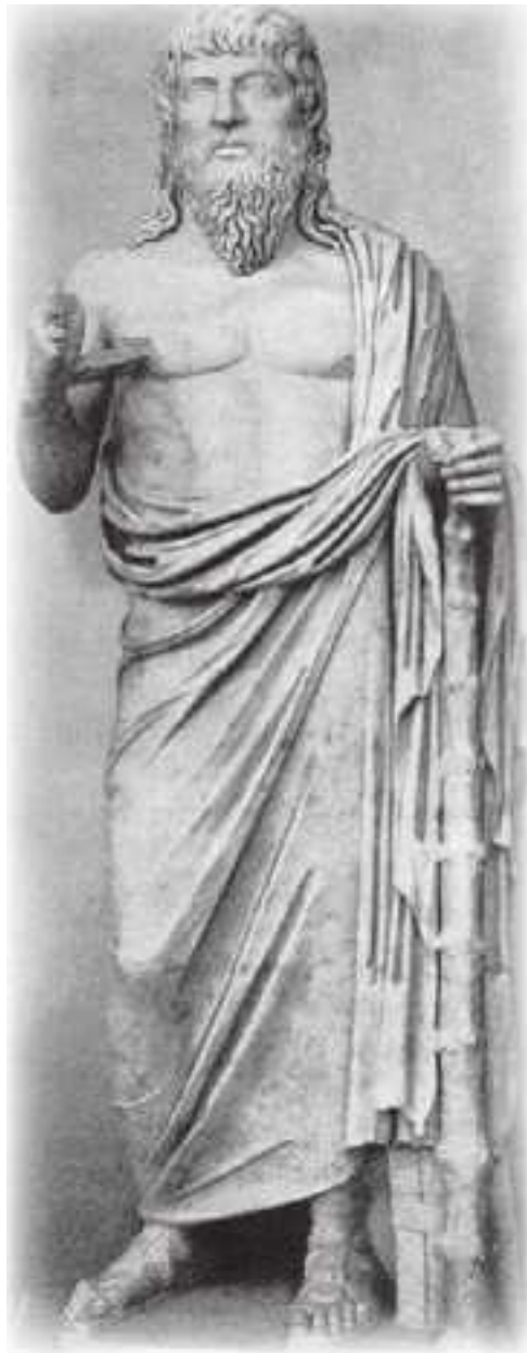
Гераклит Эфесский (ок. 500 г. до н. э.)

Разногласия с миром ведут к отчуждению от него. Вторая стадия истории человечества ознаменована односторонним развитием интеллекта. Утрачивается априорное знание, благодаря которому человек вначале еще чувствовал себя связанным со всем миром, а свойственный ему интерес к тому, «что лежит в его (мира) основе» (Гёте), превращается в любопытство, поднимается до критического переосмысления и сомнений. Аналитическое и практическое расчленение того, что было познано как целостное, ведет к раздробленному восприятию и угасанию чувства персональной ответственности.