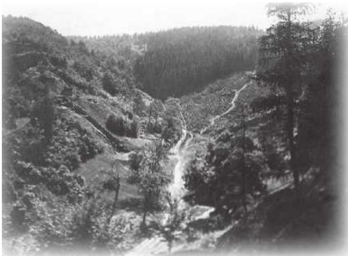
Вид на долину Дюбельсмулен из Хюненбринка, под Неттельштадтом. 1934