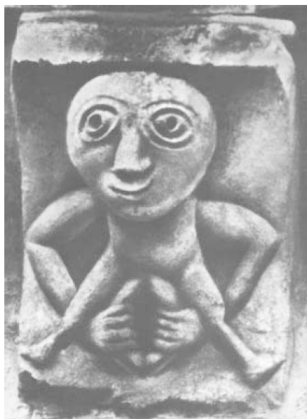
Рис. 6. «Шиле-на-гиг», Британия. Камень с рельефом, датируемым X в., использован при строительстве церкви св. Марии

Последний образ сравнивался в свое время известной исследовательницей мифологии и фольклора островных кельтов Э. Росс с так называемыми «шилена-гиг» – горельефами, изображающих жуткого вида женщин, демонстрирующих свои гениталии. Как пишет Э. Росс, данная фигура имеет «двойной смысл: плодородие, которое символизируют гениталии, и смерть, которую олицетворяет также гипертрофированная голова» [Ross 1973, 149]. В чем-то такая интерпретация опирается на более распространенную