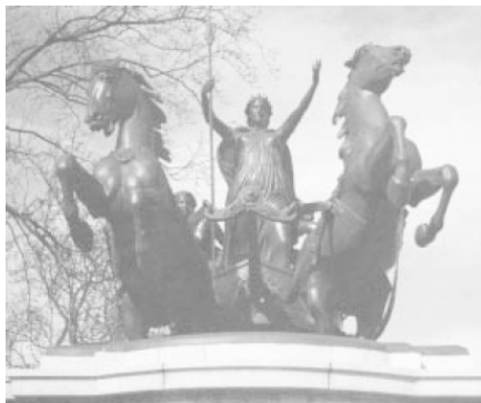
Рис. 1. Боудика. Бронзовая статуя на набережной Темзы, Лондон