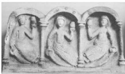
Рис. 5. Рельеф на священном «источнике Ковентины», фигуры кельтских богинь судьбы, которые, в отличие от парок и мойр, не прядут нити, а льют священную влагу. Британия, II в. до н. э.