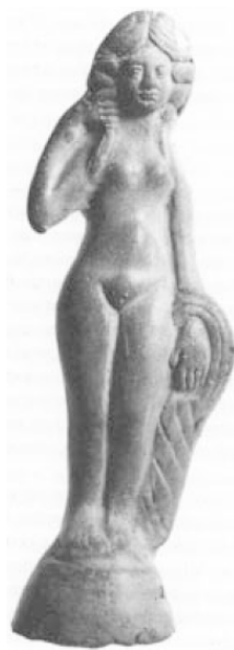
Рис. 4. Глиняная фигурка «нимфы», ок. II в. до н. э., найдена на юге Британии

Мы полагаем, что в описании красавицы Этайн следует обратить внимание еще на одну деталь. Волосы Этайн сравниваются с ярко-желтым цветком (ирл. ailestar 'гиацинт? ирис?' [TBDD 1963, 1, 16]), и при этом говорится, что они сверкали на зеленом шелке плаща, подобно золоту, так что на них было трудно смотреть (букв. forderg – «сверх-красные», т. е. «сверх-яркие», в переводе С. Шкунаева – опущено, см. [TBDD 1963, 1, 12]). В се вместе – зеленый плащ, ярко-желтые пряди волнистых волос и стояние у воды – создает образ цветка, а точнее – болотного ириса, который в поздней фольклорной традиции считался цветком смерти. В Ирландии вплоть до XVII в. практически не было распространено цветоводство, цветы не культивировали и, более того, они считались чем-то не только не нужным, но и опасным. Особенно это касалось цветов, растущих у воды, – лилий, кувшинок, ирисов и проч., поскольку своим видом эти цветы привлекали внимание детей, которые, пытаясь дотянуться до красивого яркого цветка, могли упасть и погибнуть в болоте или в омуте. Видимо, по этой причине детям было принято рассказывать страшные истории о цветах, которые, якобы, сажает водяной, сурово наказывающий того, кто решится сорвать его посадки.