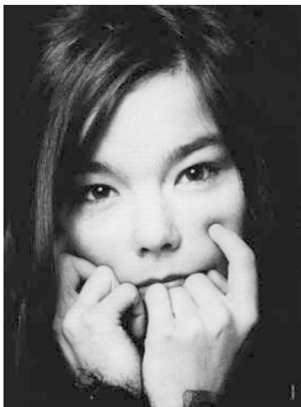
Рис. 2. Бьорк

В одном из ранних ирландских поэтических оградительных текстов, относящихся к жанру «Лорика» ( Logica , букв. 'броня') и датируемых VIII в., поэт, перечисляя злые силы, от которых он хочет себя защитить, говорит, в частности: