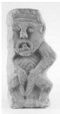
Рис. 7. «Шиле–на–гиг», Ирландия, XII в.

В том же, что касается имени, а точнее – самоназывания этих персонажей, то имя красавицы Этайн (Etaine), как нам кажется, так же сложно для интерпретации и, что главное, также многозначно, как и имена–ряды Син и Кайльб. Поясним нашу мысль.