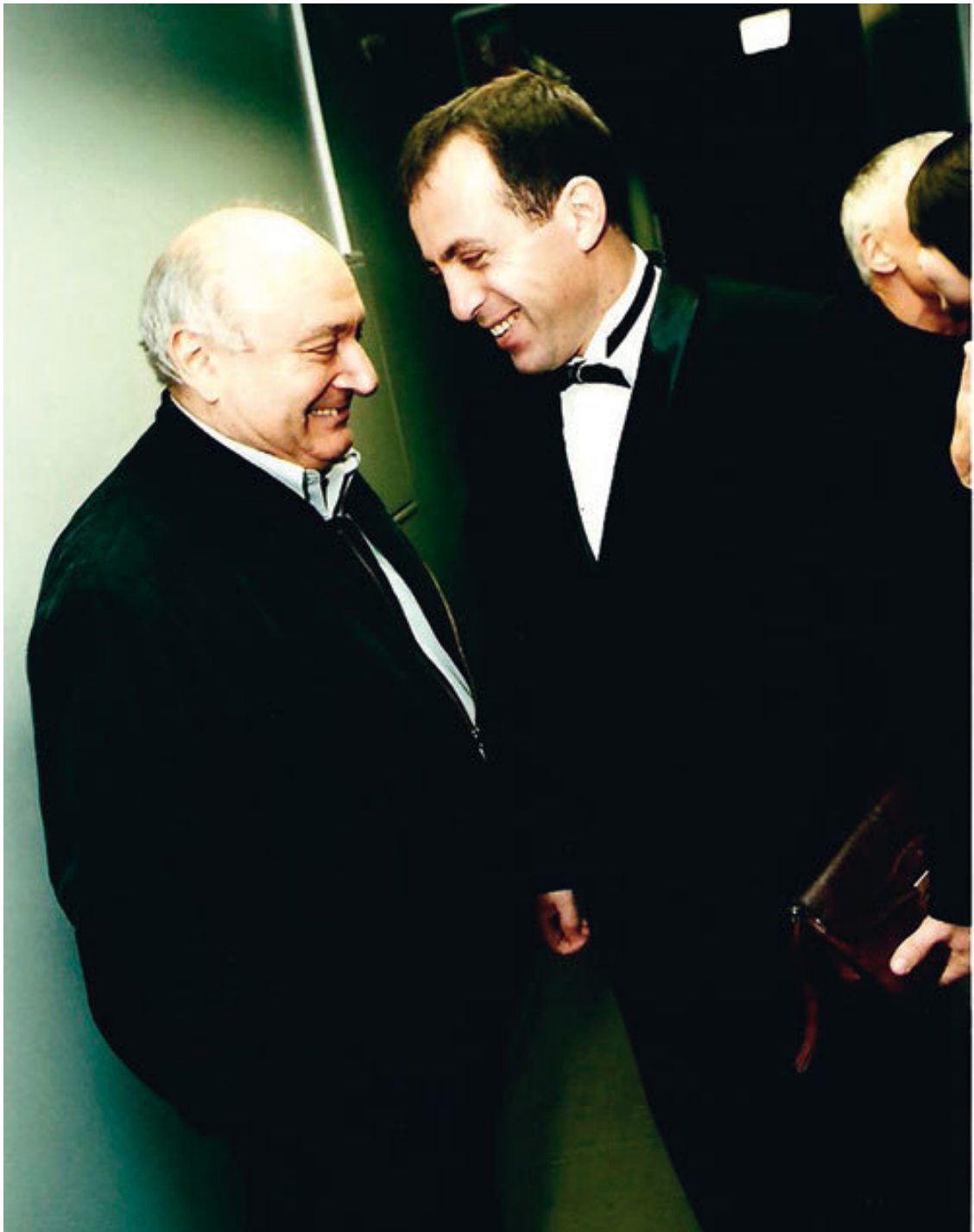
С Михаилом Жванецким