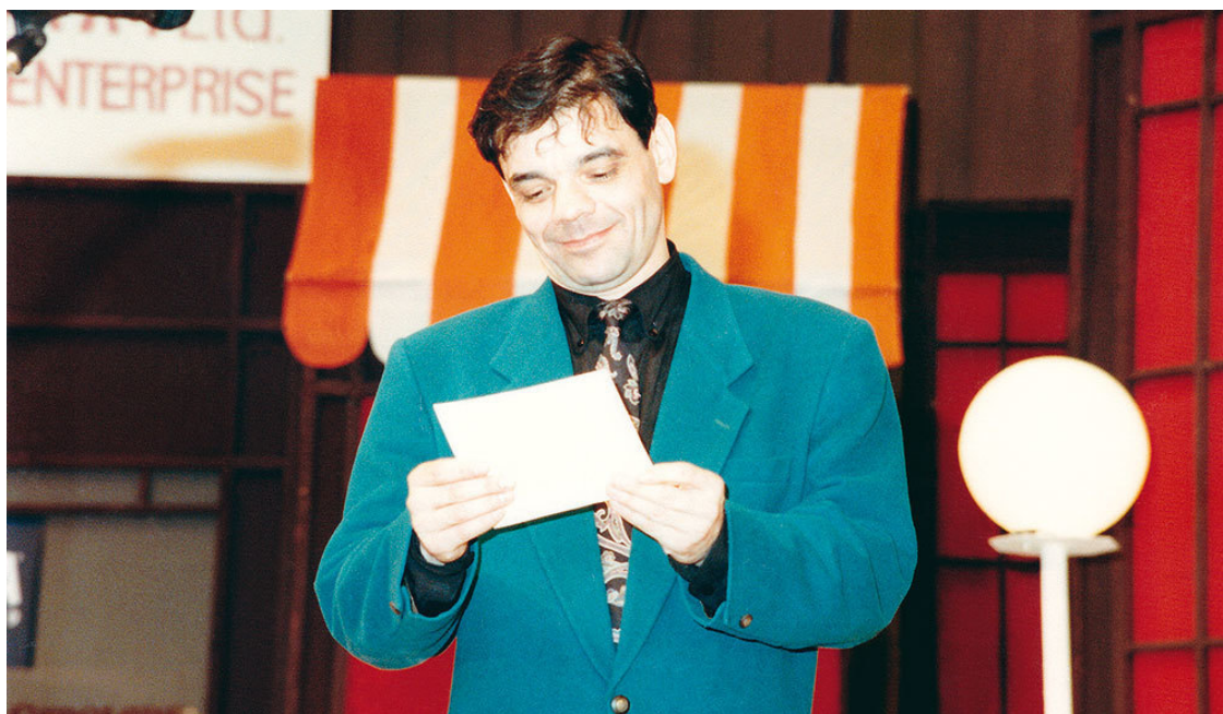
Константин Райкин с орденом на квартиру в папин дом, «MORE SМЕНА-1993»

И мы с Костей побрели дальше, оставив позади застывшую скульптуру запорожского сатирика.