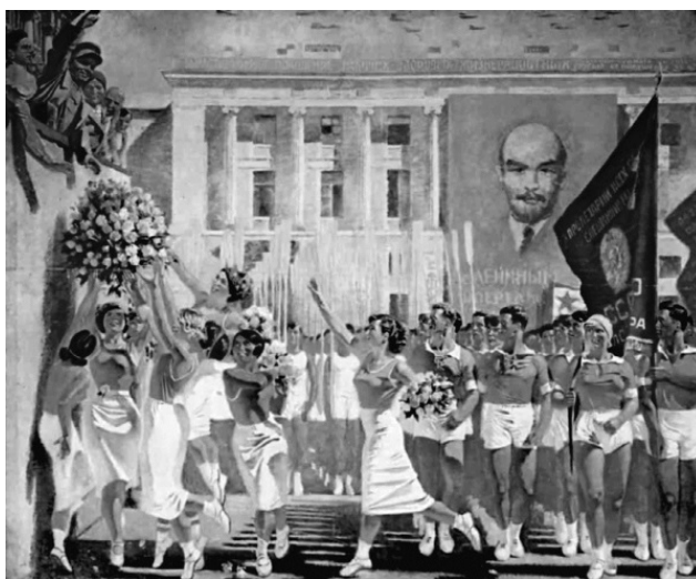
Киров принимает парад физкультурников. Художник А.Самохвалов, 1935 г.

Ну, кто, скажите, в XVIII веке – даже в окружении неистового физкультурника и прогрессиста Петра Великого – мог бы предположить, что через двести лет миллионы людей во всем мире будут интересоваться новостями странных потешных баталий? Этот парадокс всем известен по Куприну и по Лагину И по Ильфу-Петрову Да и второстепенные фельетонисты не молчали – вместе с песельниками. «В небе злая, грозовая панорама, мяч плывет у ворот по воде, но упрямо едет прямо на «Динамо» вся Москва, позабыв о дожде...». Большой спорт заставлял занятых взрослых людей запоминать «голы, очки, секунды», хранить в сознании и подсознании сотни имен, финтов, победных финишей со сломанной лыжной палкой и с исправной тоже. Я встречал стариков, которые, не присутствуя на соревнованиях, по рассказам очевидцев и скрупулезным газетным заметкам, могли в деталях рассказать о схватках Королева, Балавадзе, Ялтыряна – старых советских боксеров и борцов. Впрочем, популярность атлетов была ощутимой уже в предреволюционной России.