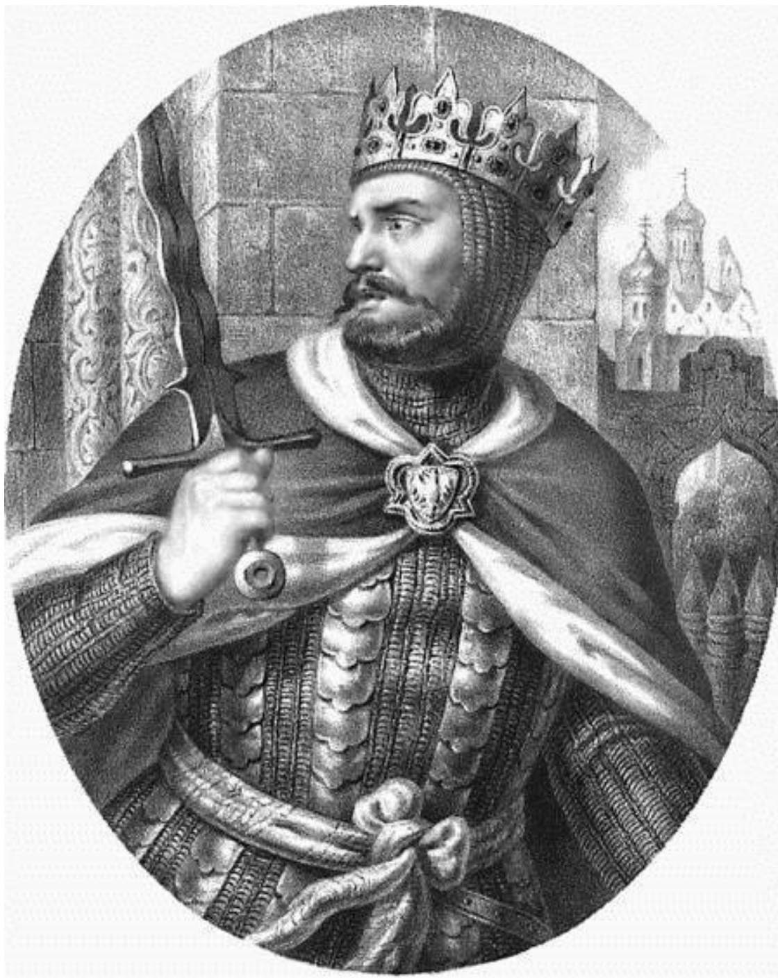
Болеслав I Храбрый. Художник А. Лессер, XIX в.

По словам С.М. Соловьева, впервые рассмотревшего династический конфликт 1015–1019 гг. в сравнительно-историческом аспекте, причиной междукняжеской вражды была «давняя ненависть Святополка к Борису как сопернику, которому отец хотел оставить старший стол мимо его; явное расположение дружины и войска к Борису, который мог воспользоваться им при первом случае, хотя теперь и отказался от старшинства; наконец, что, быть может, важнее всего, пример соседних государей, с одним из которых Святополк находился в тесной связи, объясняют как нельзя легче поведение Святополка: вспомним, что незадолго перед тем в соседних славянских странах – Богемии и Польше – обнаружилось стремление старших кня-