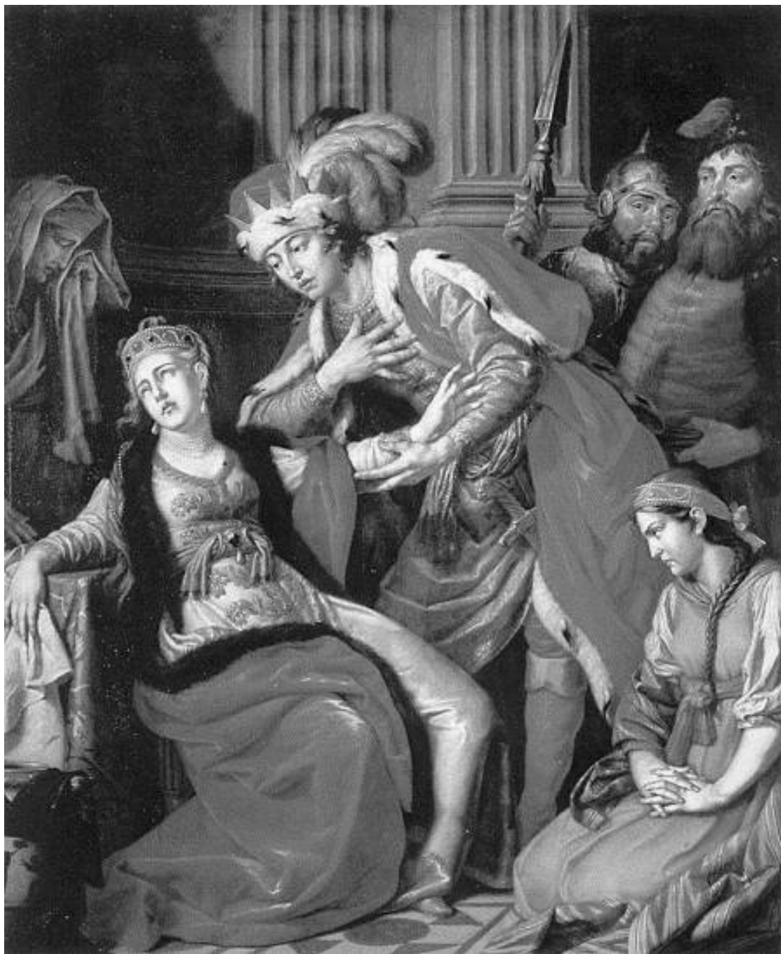
Владимир и Рогнеда. Художник А. П. Лосенко, 1770 г.

Конфликт не заставил себя долго ждать: он разразился в 975 г., когда древлянский князь Олег убил за браконьерство в своих владениях Люта, сына влиятельного киевского воеводы Свенельда, который потрудился разжечь войну между Ярополком и Олегом. В 977 г. Олег потерпел поражение в битве под Овручем и погиб во время бегства. Узнав об этом, Владимир бежал «за море», и его волость перешла к Ярополку. Согласно ПВЛ, через три года Владимир вернулся с помощью скандинавских наемников-варягов: первым делом он выгнал из Новгорода киевских посадников и объявил войну брату. Принимая во внимание условность летописной хронологии для X в., некоторые исследователи принимают датировку, предложенную