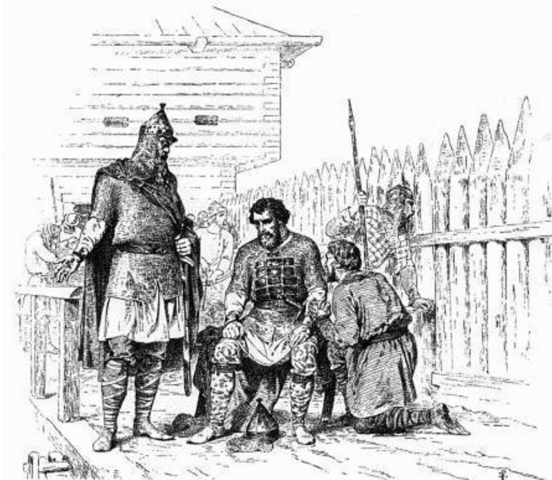
Ярополк Святославич. Художник В. П. Верещагин, 1891 г.