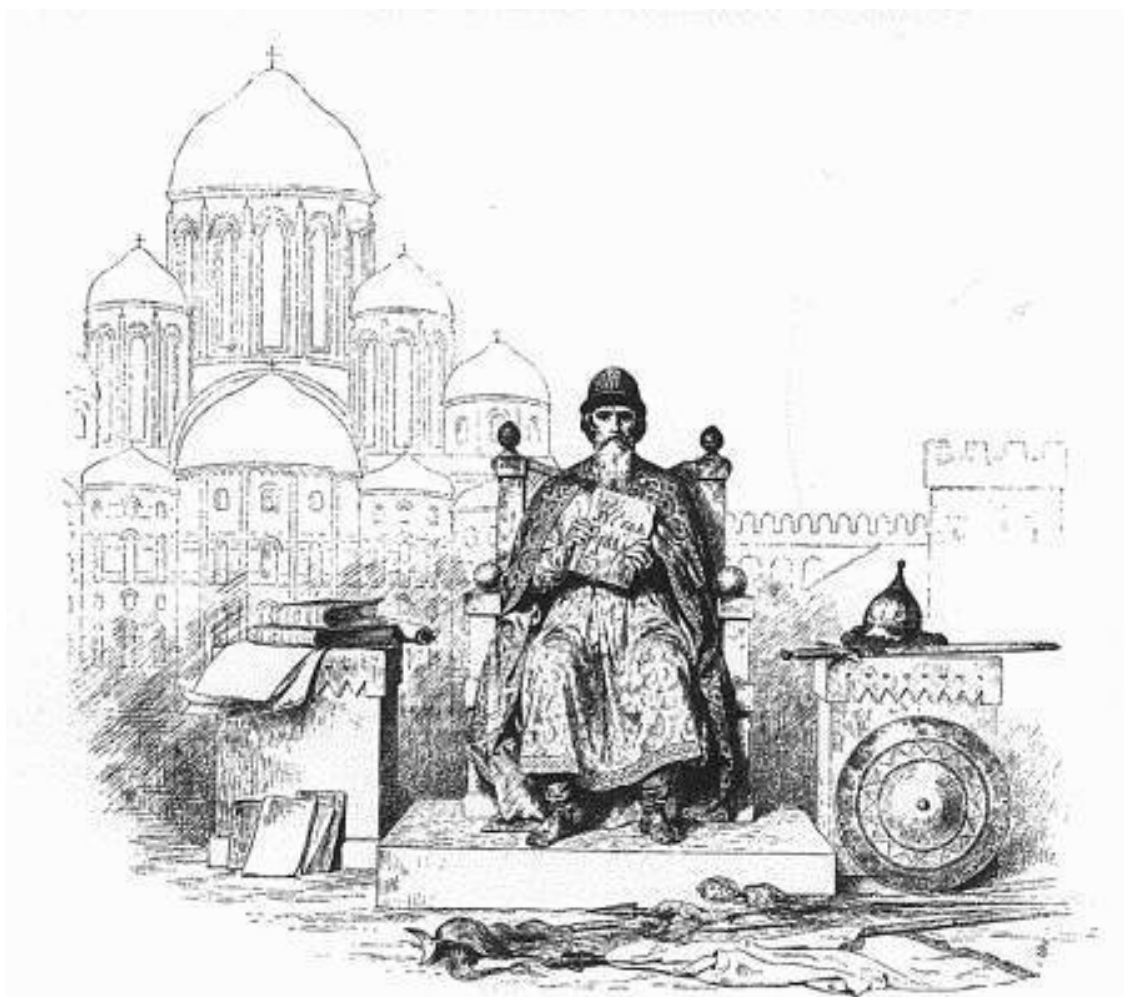
Ярослав I Мудрый. Художник В. П. Верещагин, 1891 г.

С.М. Соловьев отмечал: «Любопытно, что в летописи Иоакима матерью Бориса и Глеба названа Анна – царевна, причем Татищев соглашает свидетельство киевского летописца о болгарском происхождении матери Борисовой тем, что эта Анна могла быть двоюродного сестрою императоров Василия и Константина, тетка которых, дочь Романа, была в супружестве за царем болгарским. Если б так было, то для нас уяснилось бы предпочтение, которое оказывал Владимир Борису, как сыну царевны и рожденному в христианском супружестве, на которое он должен был смотреть как на единственно законное. Отсюда уяснилось бы и поведение Ярослава, который, считая себя при невзгоде Святополка старшим и видя предпочтение, которое оказывал отец Борису, не хотел быть посадником последнего в Новгороде и потому спешил объявить себя независимым» 33 .