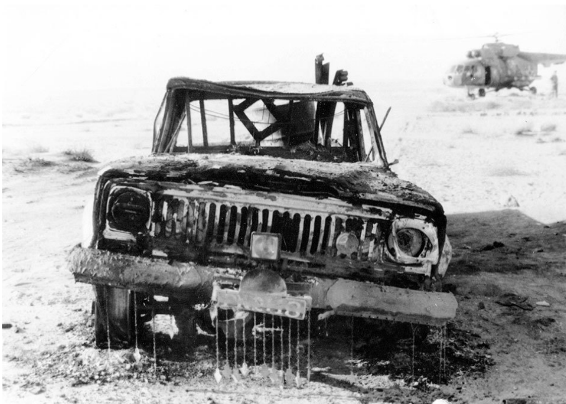
Очередной автомобиль из каравана «душманов» уничтоженный спецназом

Так рота минирования наконец встала в один ряд с ротами спецназа нашего отряда. Командиры групп, которые раньше предпочитали минерам лишний пулемет, стали менять свое