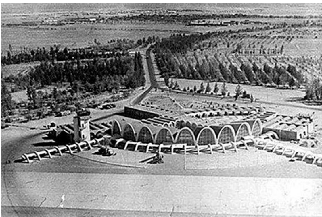
Кандагарский аэропорт Ариана

Я служил в роте минирования отряда и именно о своей роте, о ее становлении, о разной роли офицеров в этом процессе хочу рассказать.