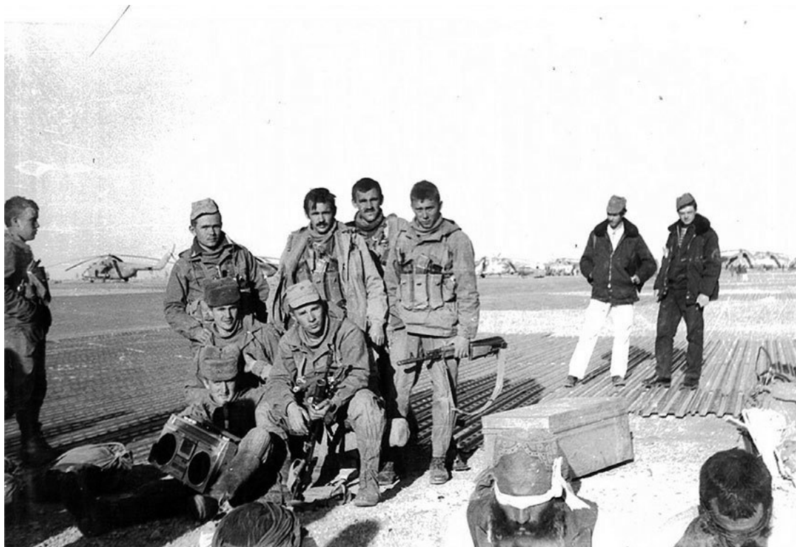
Кандагарский аэродром, стоянка вертолетного отряда, 205-го отдельной вертолетной эскадрильи, разведчики третьей роты вернулись из налета с пленными боевиками