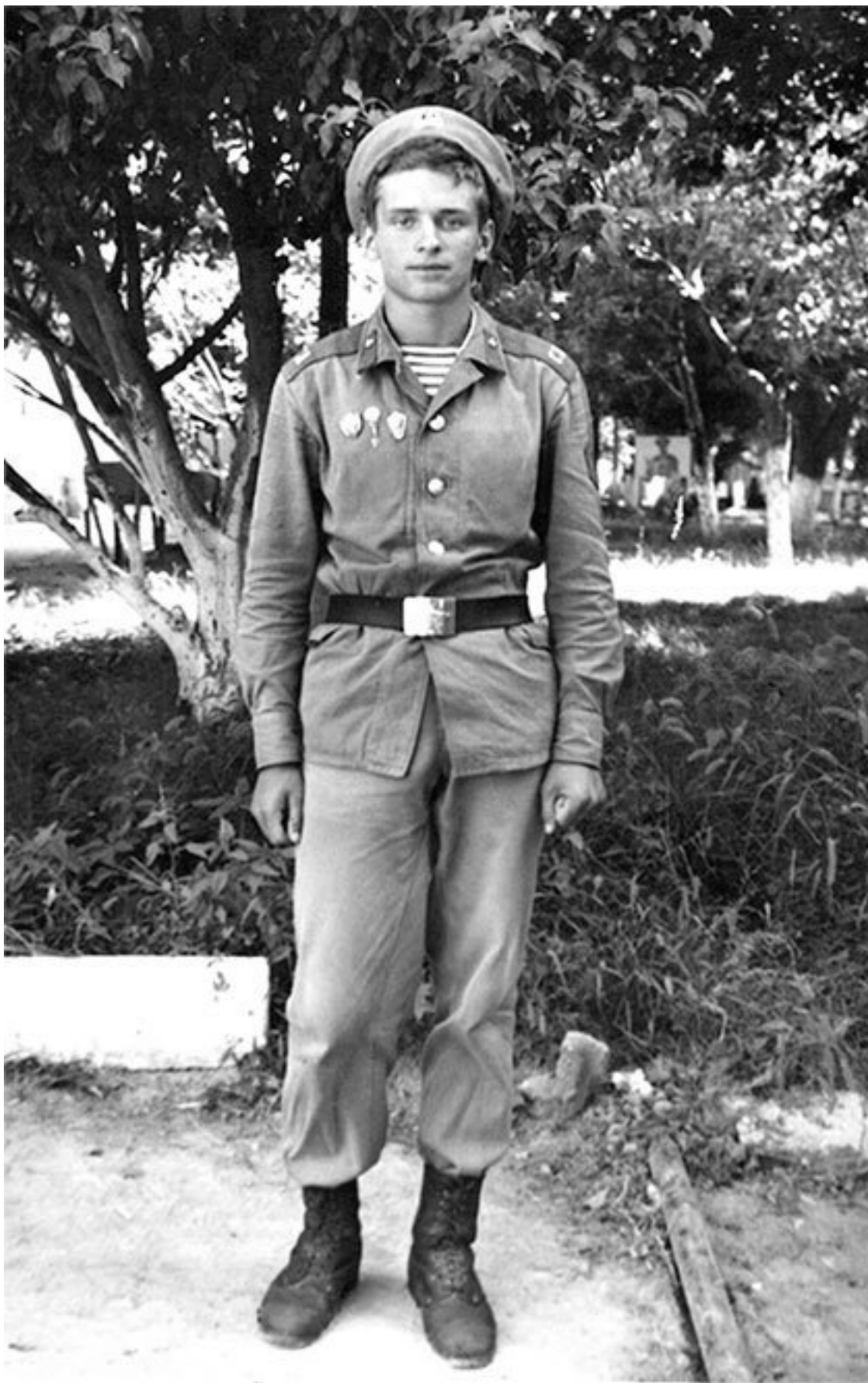
Командир отделения учебной роты минирования, 467-й отдельный учебный полк спецназа, г. Чирчик, май 1985 г.