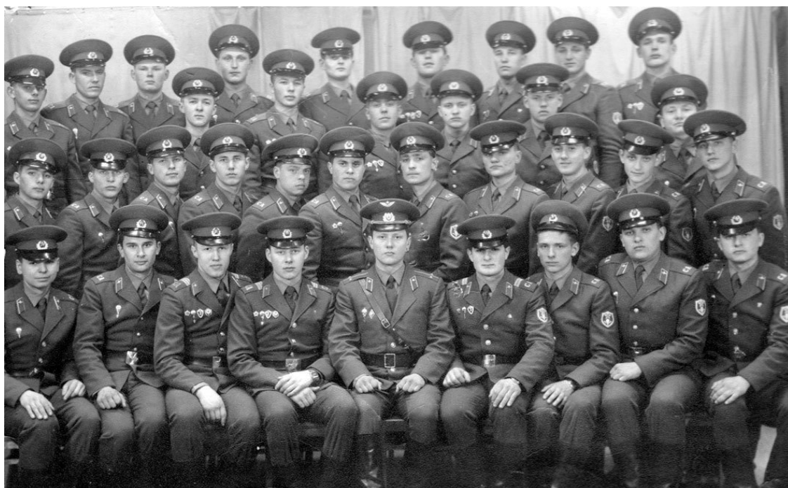
Мой учебный взвод минирования, 1071 упСпН, г. Печоры

Сержантский состав, отобранный из лучших курсантов предыдущих выпусков, имел свою «иерархию». Заместитель командира взвода был реальным начальником для командиров отделений. Сержанты были обоснованно требовательны к курсантам, не спускали ни малейшей провинности. Однако наказания очень редко переходили в плоскость неуставных отношений. По традиции провинившийся курсант повышал свою физическую выносливость. Основа взаимоотношений между курсантами – равенство, и один не мог стать сильнее других, поэтому «качались» повзводно.