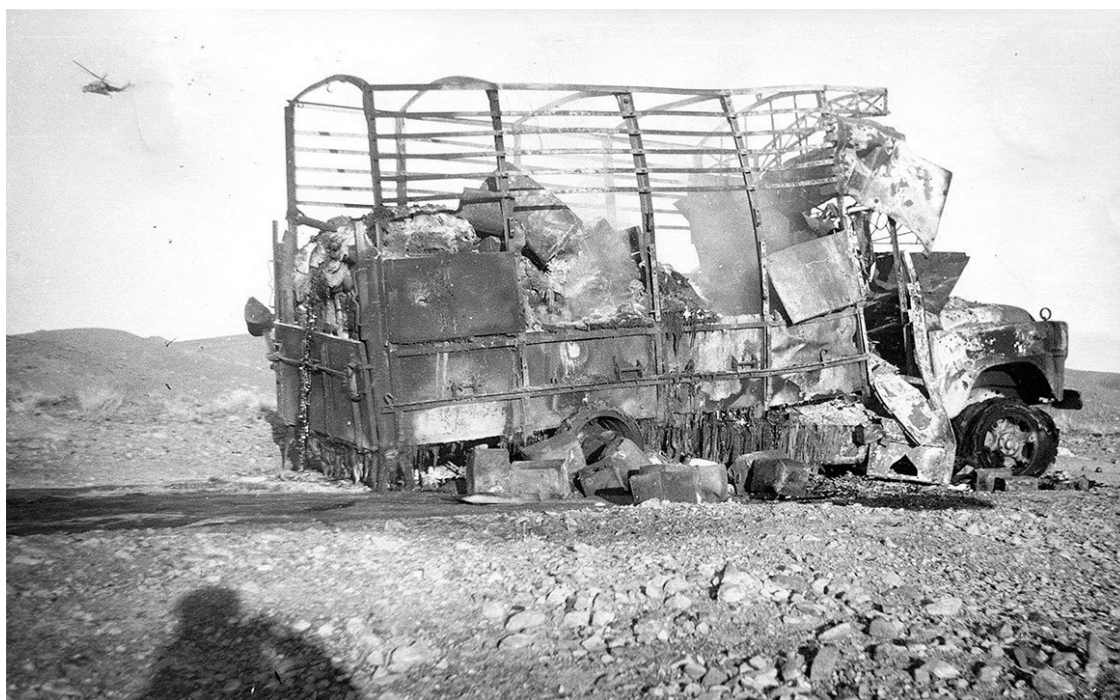
«Дымит забитый караван...»

Основным видом боевой деятельности нашего отряда были засады. Основная задача подрывников – увеличение огневой мощи разведгруппы. Как эффективная работа подрывников во время боевого выхода увеличивала возможности группы, так и грамотная работа роты минирования увеличивала результативность всего отряда.