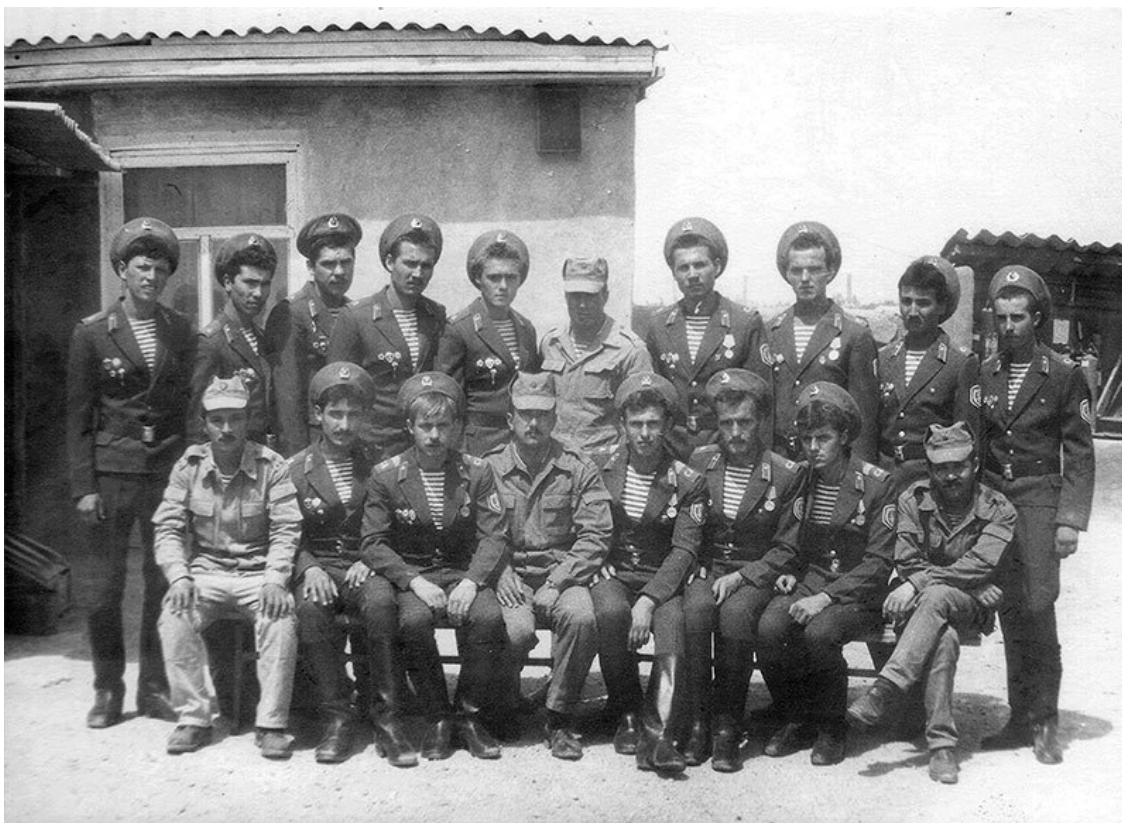
Увольняемые в запас военнослужащие роты минирования, май 1987 г.