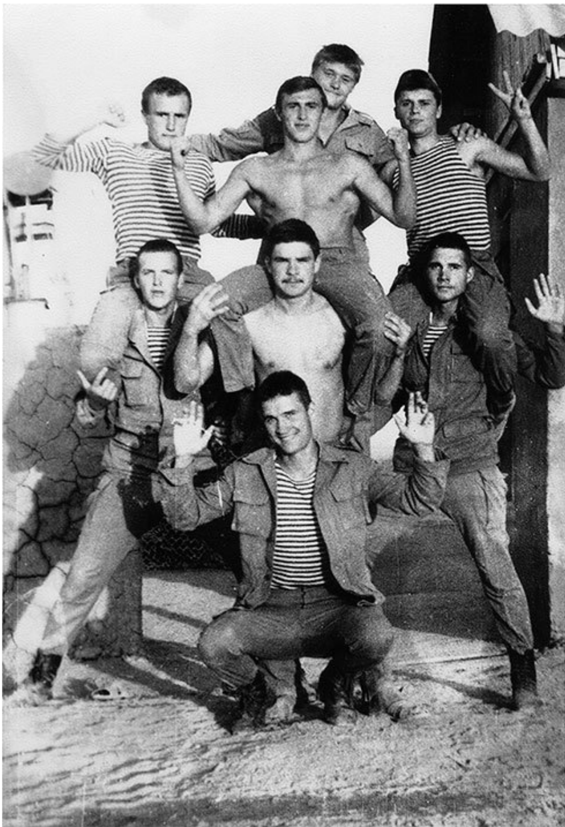
Подрывники первого выпуска 467-го оупСпН, в Кандагарском батальоне спецназа, осень 1987 г.