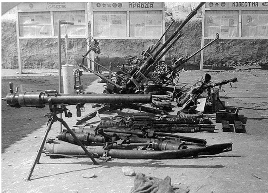
Боевые трофеи Кандагарского отряда

лений 173-го отряда решали задачи куда более важные, чем подметание дорожек и выравнивание по нитке солдатских кроватей. Будучи человеком неглупым, Кочкин понимал, что со временем от него будут требовать больше, чем блистать на смотрах и проверках.