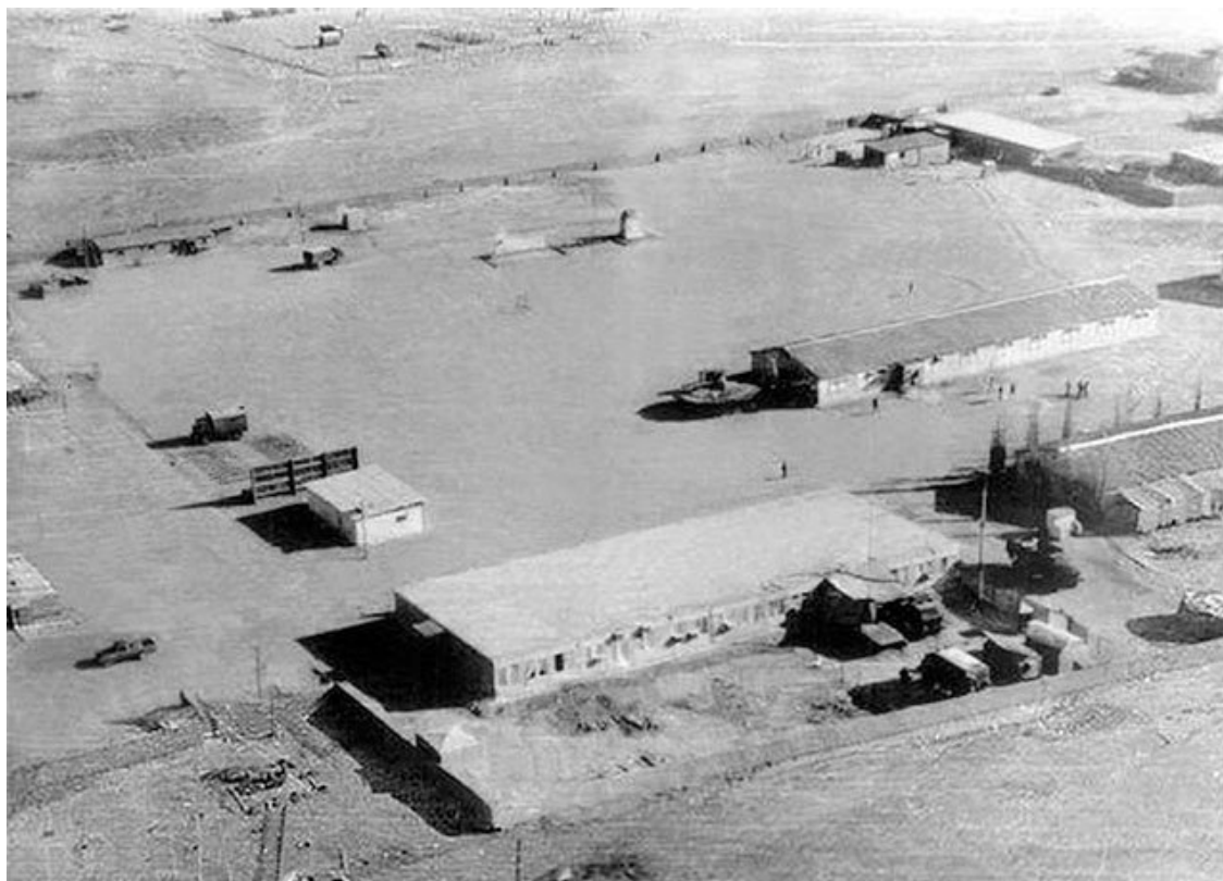
Пункт постоянной дислокации 173-го отдельного отряда спецназа с высоты птичьего полета