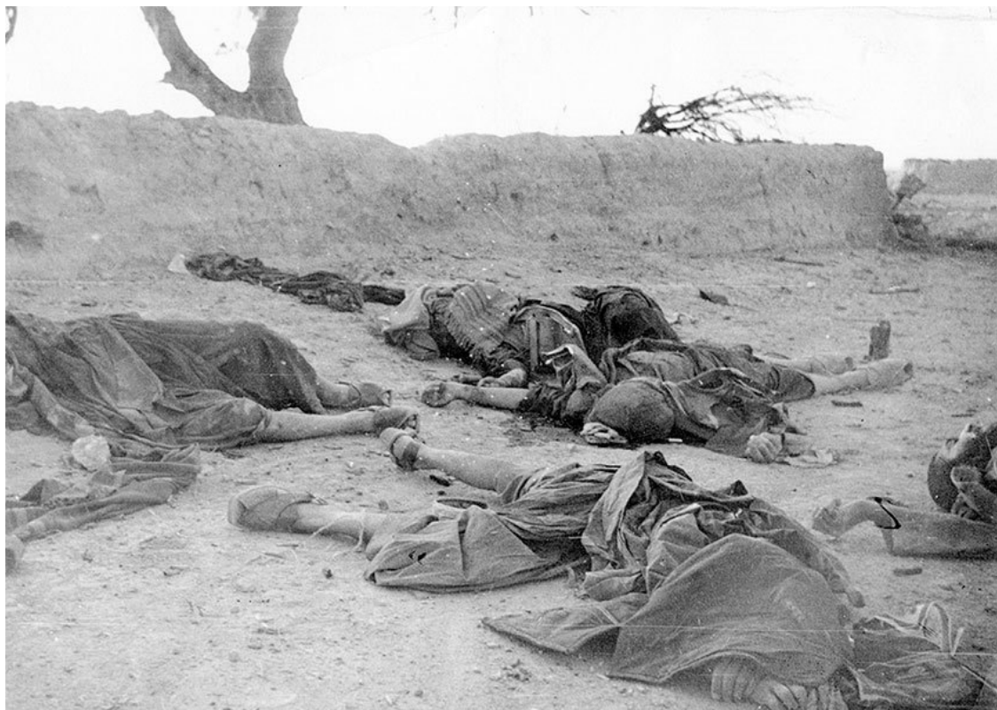
На войне как на войне, уничтоженные спецназом в ночном бою бандиты