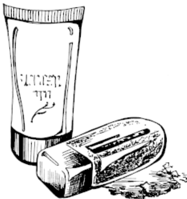
Рис. 3. Жидкая крем-пудра

Жидкая крем-пудра замечательно подходит обладательницам сухой или нормальной кожи, а женщинам с жирной кожей ее лучше не использовать, поскольку она лишь проявит все недостатки кожи (рис. 3).