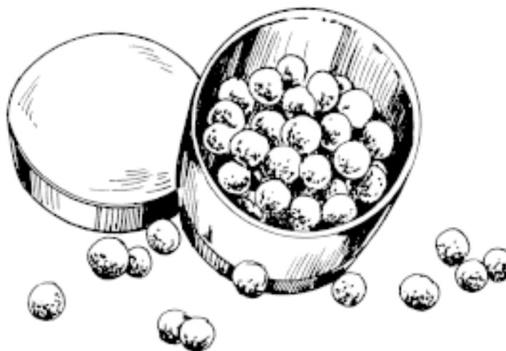
Рис. 4. Пудра в виде шариков

Пудра в виде разноцветных шариков содержит светоотражающие частицы, благодаря чему придает коже неповторимую свежесть. Тем не менее, не стоит злоупотреблять ею, наносить такую пудру следует очень тонким слоем (рис. 4).