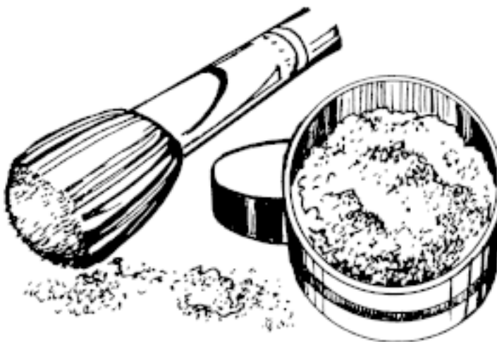
Рис. 1. Рассыпчатая пудра

Рассыпчатая пудра ложится ровным слоем на кожу лица, целиком смешиваясь с тональным кремом и становясь таким образом незаметной. Правда, носить с собой рассыпчатую пудру затруднительно, поэтому пользоваться ею лучше дома (рис. 1).