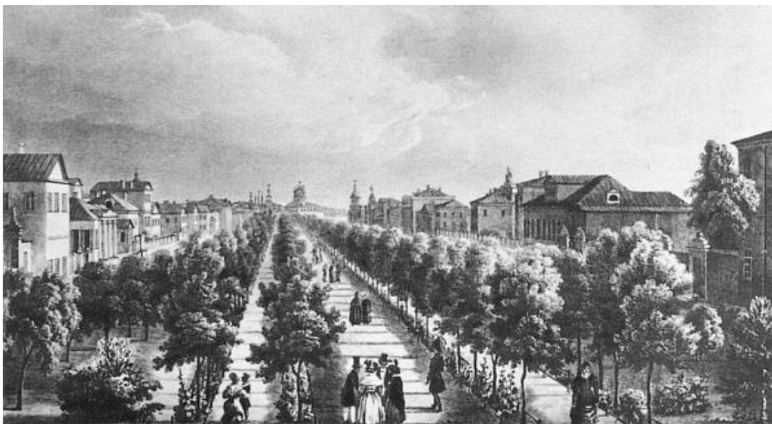
Тверской бульвар в 1825 г.

Бульвар был освещен. Но свет горел как-то тускло, фонари рассыпались искрами в сухом воздухе и терялись где-то в вышине. Листья уже облетели, и остовы деревьев торчали неустроенно, некрасиво, коряво. На душе стало тревожно. И почему я не поехала на метро? На бульваре не было ни души. Вот странность! Ведь москвичи гуляют здесь в любое время суток и в любую погоду. Так повелось аж с конца XVII века, когда бульвар засадили деревьями и он сразу стал любимым и самым уютным местом Москвы. Его украсили беседками, фонтанчиками, резными мосточками, даже бюсты знаменитых людей поставили. Тут прогуливалась вся аристократическая Москва. А по бокам неспешно ездили кареты, из которых выглядывали юные красотки, прельщая кавалеров. Часто кареты создавали такое столпотворение, что и проехать невозможно.