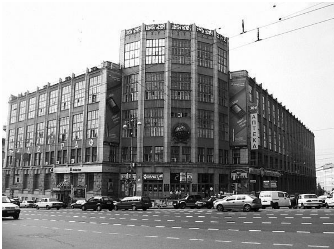
Здание Центрального телеграфа на Тверской улице