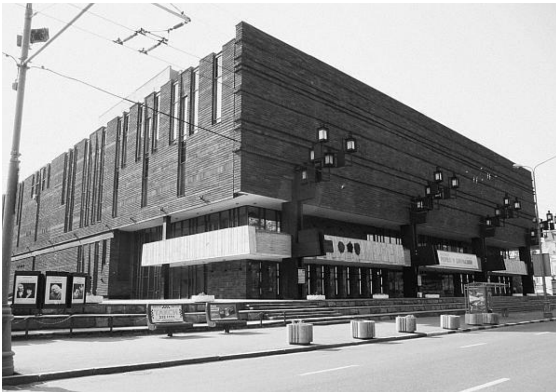
Здание МХАТа им. Горького

Наш великий вождь народов однажды, вытряхнув своей иссохшей рукой табак из знаменитой трубки, решил, что и бедного Михоэлса пора вытряхнуть из жизни – слишком уж велики стали его влияние и известность в стране и мире. Словом, в 1948 году Соломон Михоэлс разбился на машине где-то под Минском. Похороны в Москве были наипышнейшими. Только народ все равно шептался: великого актера убрали по приказу сверху.