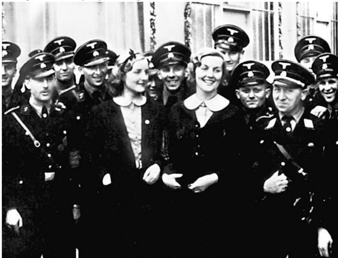
Британские аристократки Диана и Юнити Митфорд среди членов нацистской партии. Сентябрь 1937 г.