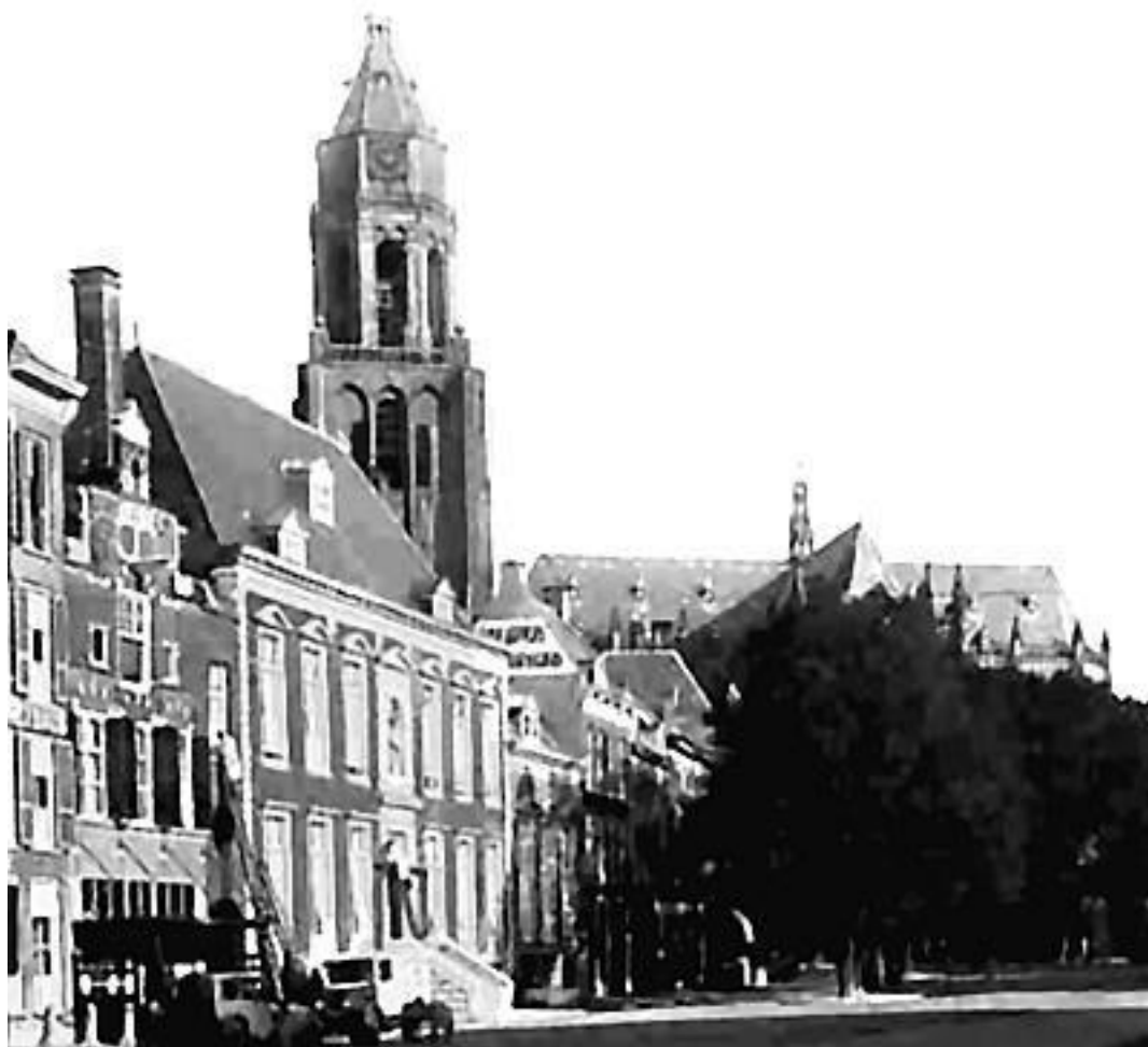
Башня церкви Св. Евсевия города Арнема, в пригороде которого родилась мать Одри Хепберн и мэром которого был дед Одри. Фото 20 – 30-х гг. XX века

Известно, что ван Уффорд отплыл на корабле в Сан-Франциско; там он познакомится с немецкой эмигранткой Марией Каролиной Роде, которая станет его второй женой. Спустя несколько лет он вернется в Нидерланды, где и умрет 14 июля 1955 года в возрасте шестидесяти лет.