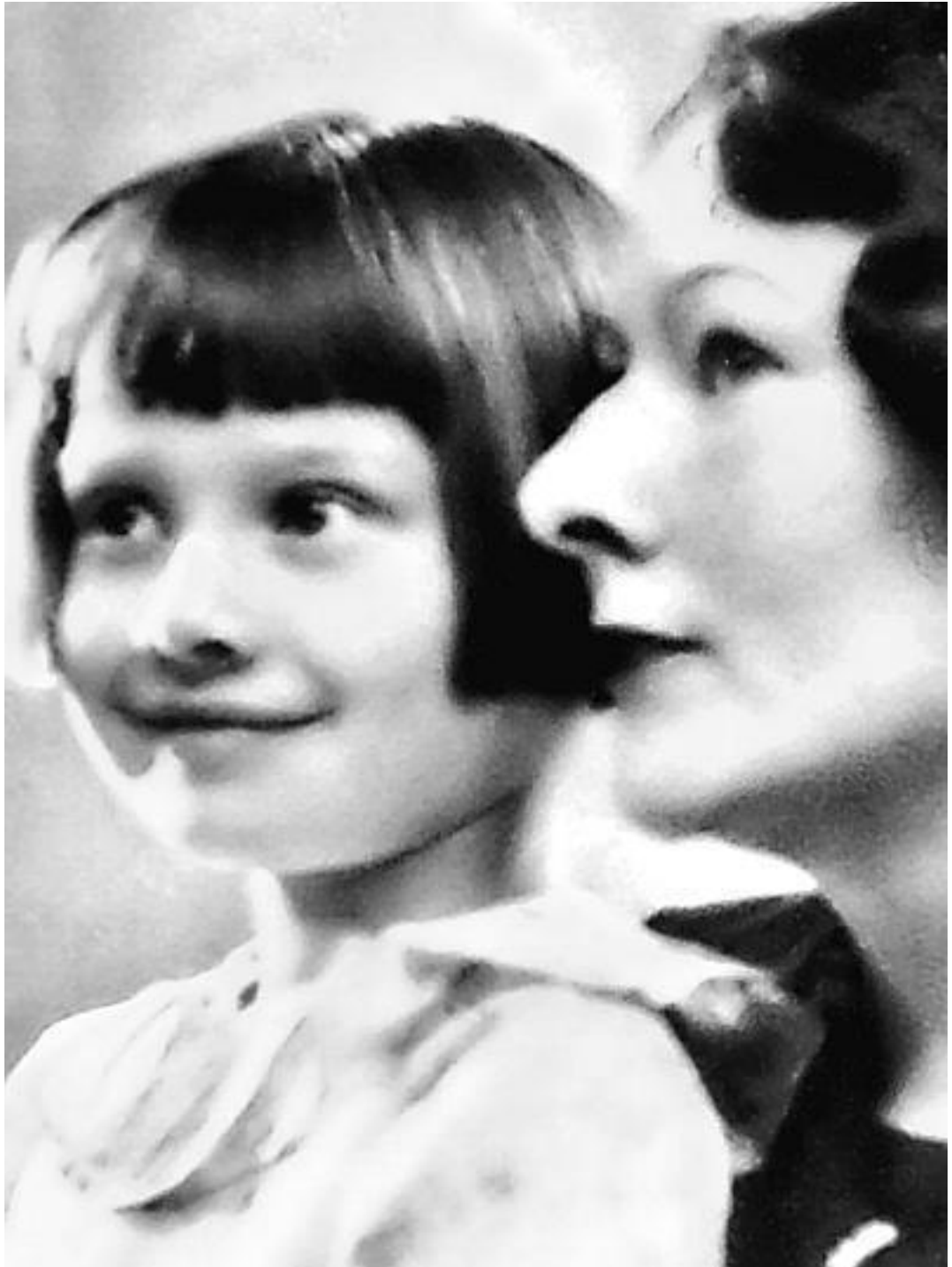
Маленькая Одри с матерью

– В детстве меня научили тому, что привлекать внимание к себе – признак дурных манер. Никогда не следует выставлять свои чувства напоказ... Я и сейчас слышу голос матери: «Никогда не опаздывай! Сначала думай о других! Никогда не говори о себе. Твоя болтовня не представляет никакого интереса. Нужно говорить о других!»