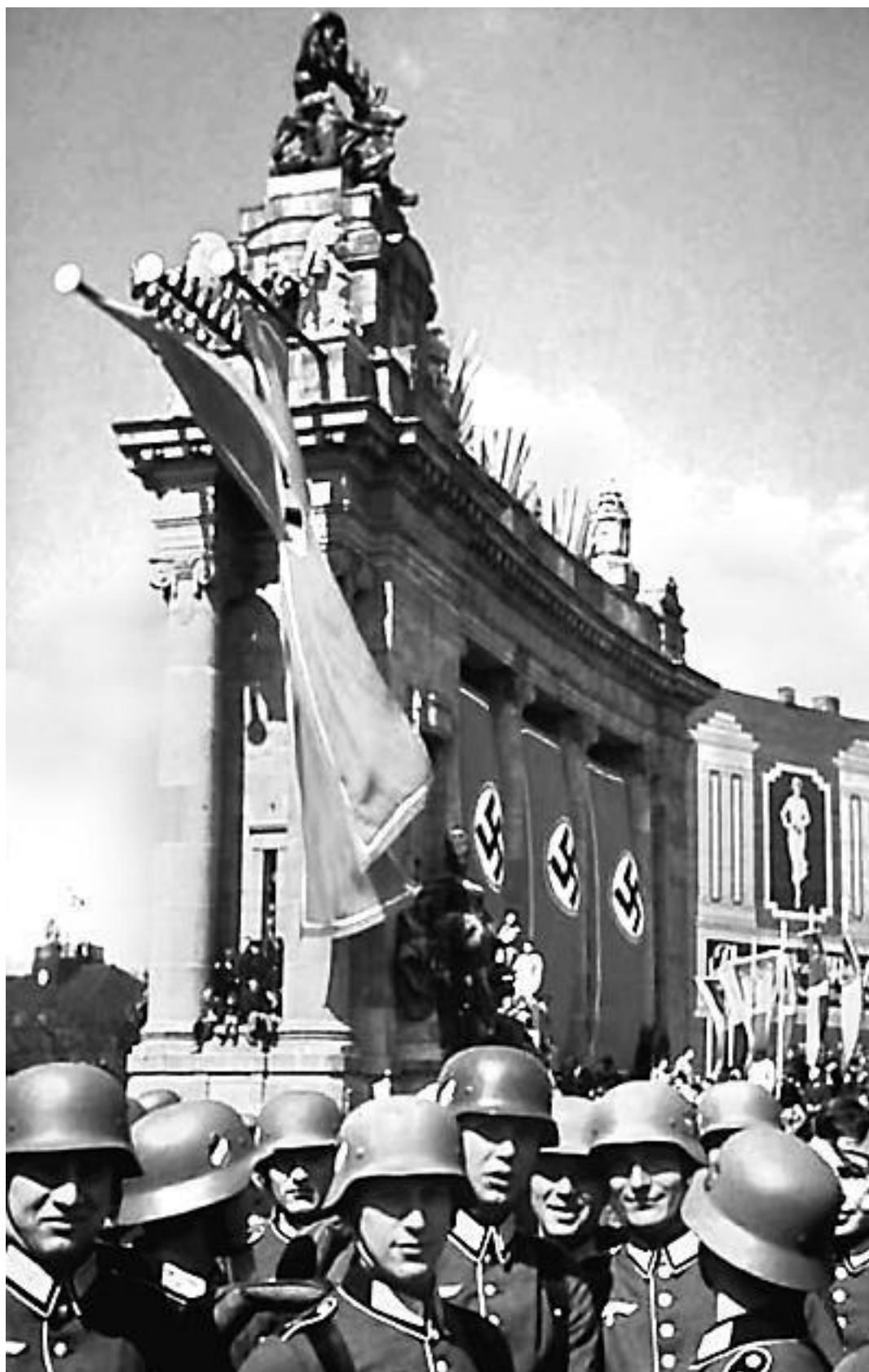
Германия 30-х гг.