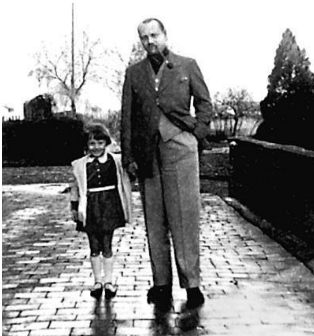
Редкое фото – Одри с отцом