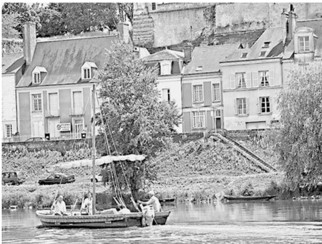
Замок Амбуаз, к которому мы подплываем