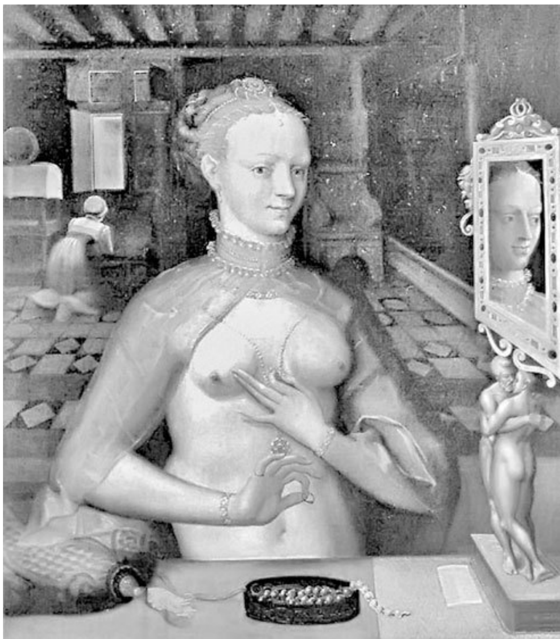
Диана де Пуатье

Отвлекусь на одну пикантную деталь. В первую брачную ночь четырнадцатилетний Генрих был настолько равнодушен к супруге, что никак не мог исполнить свою супружескую обязанность – настолько, что его отцу, Франциску, пришлось вторгнуться в спальню новобрачных, чтобы взбодрить свое чадо. Наутро же в это дело вмешался римский папа, дядя Екатерины, который захотел лично, «глазом и пальцем», убедиться в потере ею девственности. В дальнейшем Генрих делил ложе со своей супругой только по настоянию Дианы, беспокоившейся об отсутствии королевского потомства. Екатерина же, страстно влюбленная в Генриха, шла на всяческие ухищрения, лишь бы добиться его расположения. И даже распорядилась, чтобы пробили дырку в потолке спальни Дианы, откуда она, Екатерина, смогла бы наблюдать за эротическими приемами последней. Но и после десяти лет супружества Екатерина оставалась бесплодной, что могло служить поводом для развода. В конце концов, лейбмедик королевского двора Фернель спас ее. Он знал, что Генрих страдал от деформации полового члена, из-за которой семя извергалось в сторону. Внимательно осмотрев королеву, он обнаружил и у нее некоторое